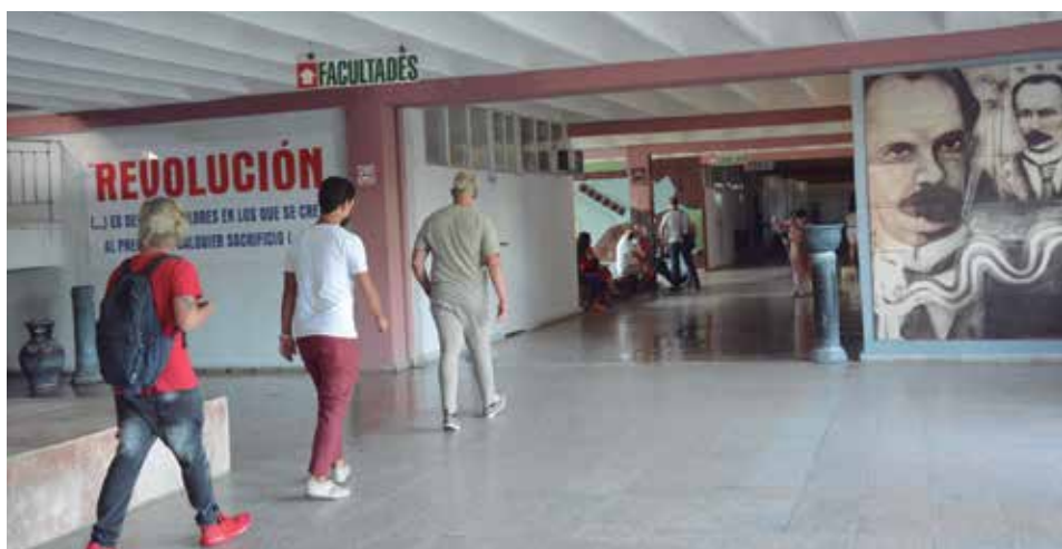
El curso escolar en la Universidad espirituaña se extenderá hasta febrero de 2023.