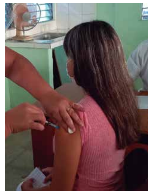
Alrededor del 99 por ciento de la población vacunable ya cuenta con el esquema completo.

Rivero Abella explicó que en la provincia se han realizado estudios de respuesta inmunológica a las vacunas a partir del esquema empleado con tres dosis de Abdala y una de Soberana O2 como refuerzo, y los niveles de inmunidad están alrededor de la media del país.