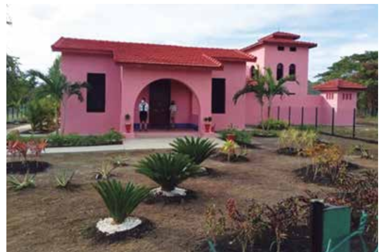
La casa quinta de la hacienda El Abanico es el único exponente de su tipo existente en el Valle de los Ingenios.