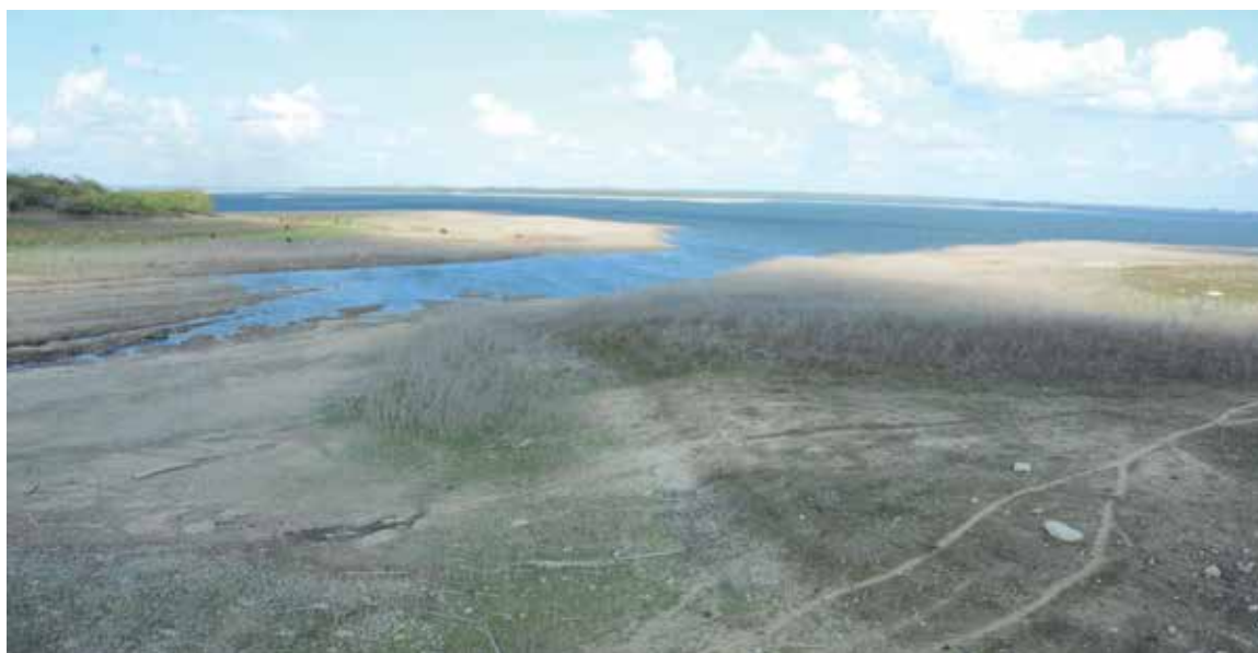
Los embalses del territorio apenas acumulan el 30 por ciento de su capacidad.

En el período seco, que se extiende de noviembre a abril, aquí solo se acumulan unos 133 milímetros de lluvia, que representan algo más del 60 por ciento de la media histórica de la etapa