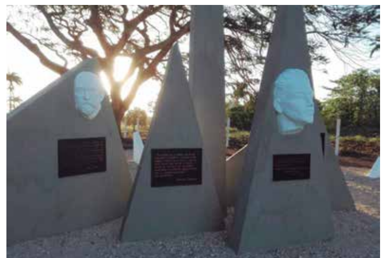
El Monumento Nacional La Reforma honra a Francisco Gómez Toro (Panchito), hijo del Generalísimo Máximo Gómez.