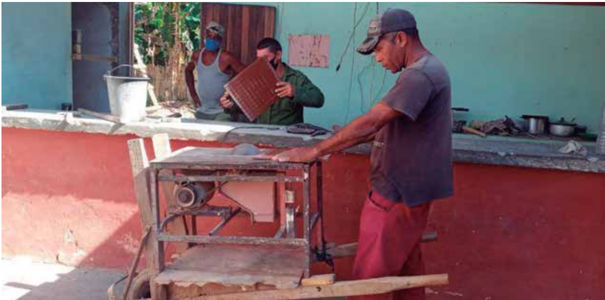
El círculo social es una de las instalaciones beneficiadas por las mejoras constructivas.