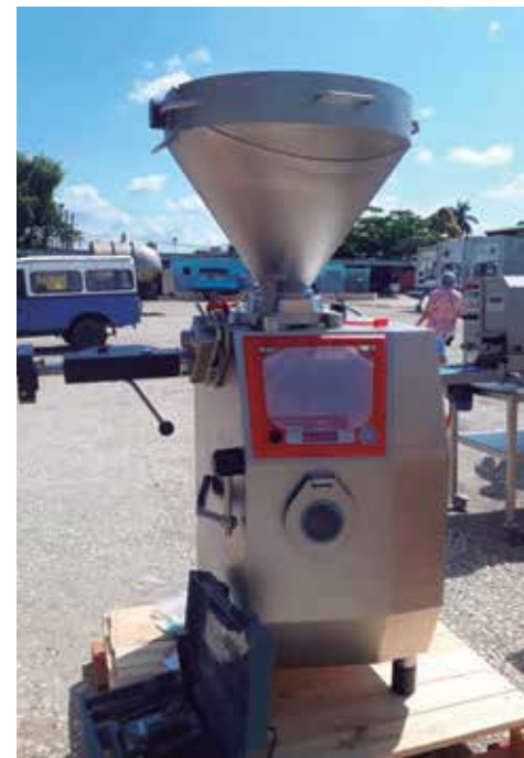
Las nuevas máquinas beneficiarán el proceso en el área de conformados.

miento en la Planta de Conformados de la Industria Pesquera espirituaña, se podrán superar las 3 toneladas de alimentos diarios, en dependencia de los volúmenes de captura y, por ende, crecer en fuerza laboral, sobre todo en los meses pico de cosecha, para duplicar las elaboraciones con un impacto favorable en la producción de alimentos destinados a la red de casillas especializadas y otros tipos de mercados del territorio. (X. A. M.)