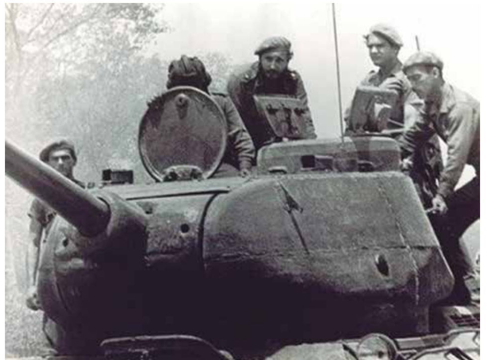
Con la responsabilidad principal al frente del país desde su cargo de primer ministro, el Comandante en Jefe mantuvo el control sobre la situación.

Creyeron que con 1 400 hombres, 30 aviones de combate y transporte, cinco tanques, 11 camiones artillados, 30 morteros, 28 cañones sin retroceso, 50 bazucas, 46 ametralladoras, 9 000 fusiles y subametralladoras y abundantes pertrechos bastaba para