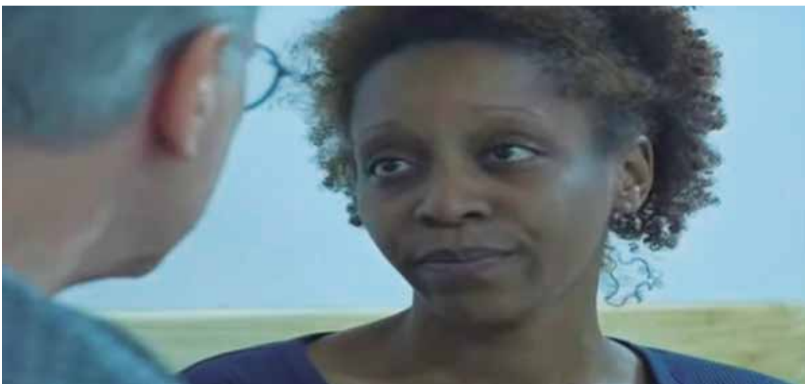
El personaje de Xiomara en la telenovela Tú fue uno de los más seguidos por los televidentes.

“Me han ofrecido algunos proyectos que estoy valorando. He aceptado otros, aunque no estoy autorizada aún para hablar sobre ello. Ojalá y se sorprendan como mismo sucedió al verme en la telenovela”.