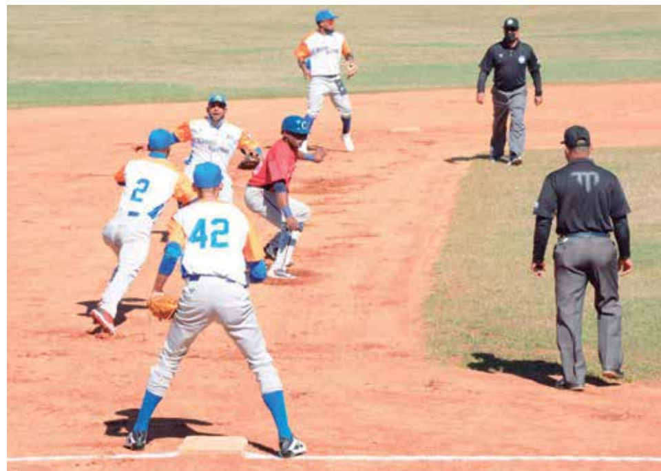
Los Gallos han mantenido un paso estable en lo que va de campaña.