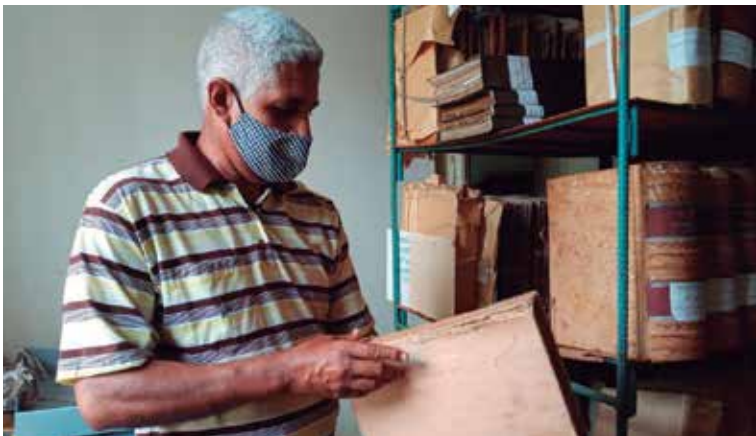
Para muchos investigadores de la ciudad es una preocupación el deterioro que muestran estos fondos.

Descubrir y pulir esas manos de ángeles resultó entonces uno de los aciertos del primer curso de Restauración de papel que incorporó a su programa curricular la Escuela de Oficios Fernando Aguado y Rico, de la Oficina del Conservador de Trinidad y el Valle de los Ingenios. Los siete jóvenes egresados de la nueva especialidad no solo desarrollaron acciones de conservación, limpieza manual y encuadernación de documentos valiosos, sino que se “enamoran” de un oficio casi en peligro de extinción.