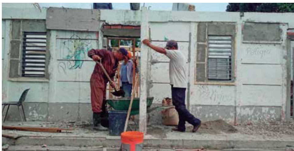
La escuela primaria de Caracusey es uno de los planteles beneficiados por estas acciones constructivas.