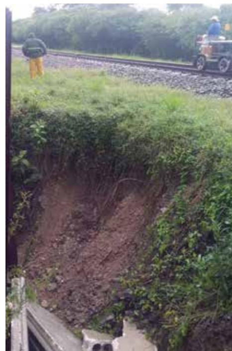
Imágenes del deslave ocurrido a la altura del puente Las Margaritas, en la línea del ferrocarril central.

Según el sitio transportespirituano.cu , este