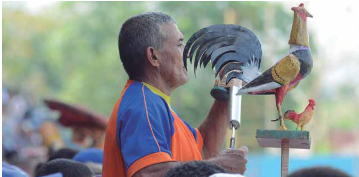
Muchos aficionados siguieron paso a paso la actuación del equipo y se quedaron esperando más.

Ciego, vencedor frente a Santiago de Cuba en semifinales 3-1, es favorito para llevarse la corona. Los Guerreros están por seguir asombrando la historia. (E. R. R.)