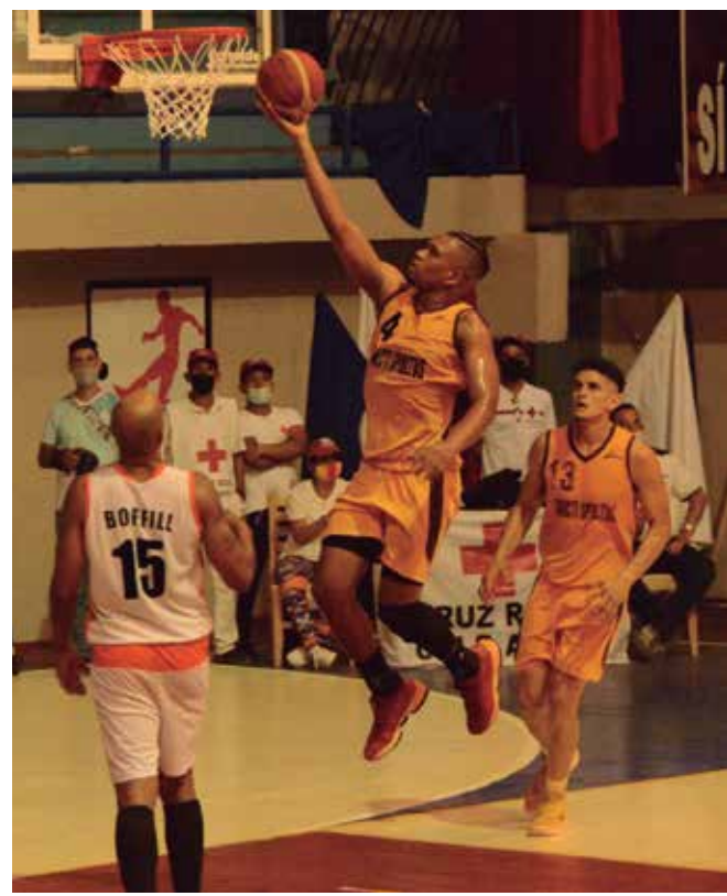
El equipo espirituaño se enfrenta a un difícil rival: los archifavoritos Búfalos avileños.

No es esta la gran actuación con que algunos sobredimensionan el papel de los Gallos. Hay que ver el real color de la medalla, que no es como el bronce de los niños en el Panamericano Sub-15. La pasión y el conformismo no deben colmar el realismo para poder encarar las carencias que nos separan de ese sueño colectivo que sigue teniendo al título de 1979 como un referente inalcanzable.