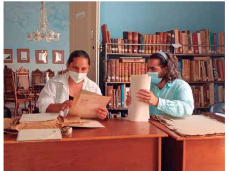
Estos jóvenes demostraron aptitudes y habilidades creativas en un oficio que necesita renovarse para resguardar el patrimonio documental de Trinidad.

De la misma manera que es responsabilidad de la nación conservar, proteger y custodiar su legado histórico, lo es la de rescatar el oficio de restaurador de