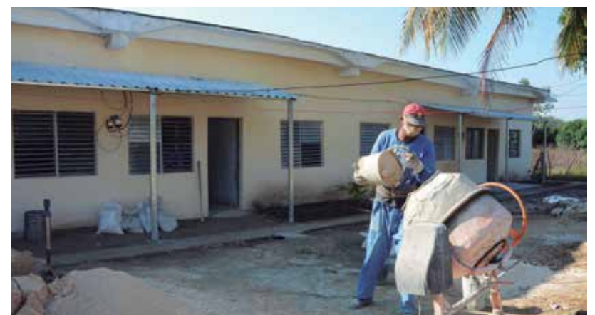
La adaptación de locales sigue siendo una opción más del programa de la Vivienda en la provincia.

Asimismo, está limitado el programa de rehabilitación y conservación de viviendas que hoy transita por la falta de financiamiento y la poca disponibilidad de recursos, precisó Vázquez Bernal.