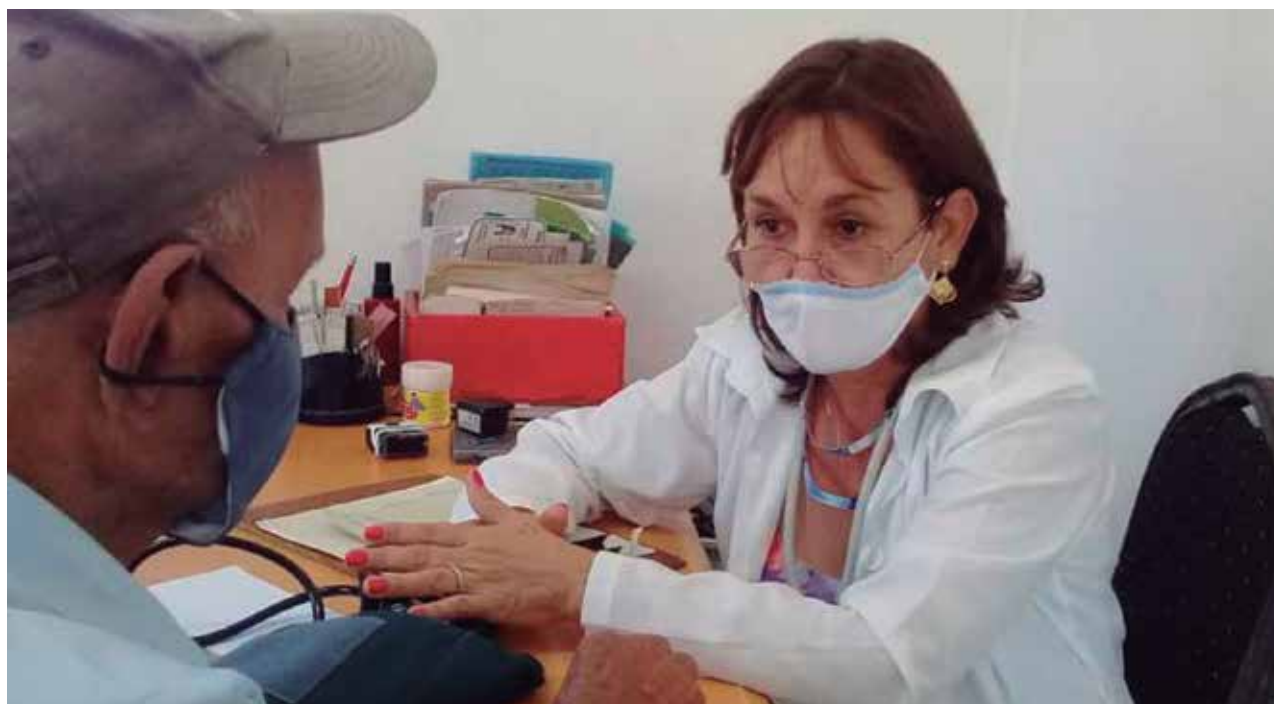
La estabilidad del médico es fundamental para el trabajo del consultorio, subraya la doctora.

Todo lo anterior se logra con un alto grado de eficiencia: el sobrecumplimiento de los ingresos y las utilidades respaldaron el incremento salarial y mayores aportes al presupuesto, tanto del territorio como al país.