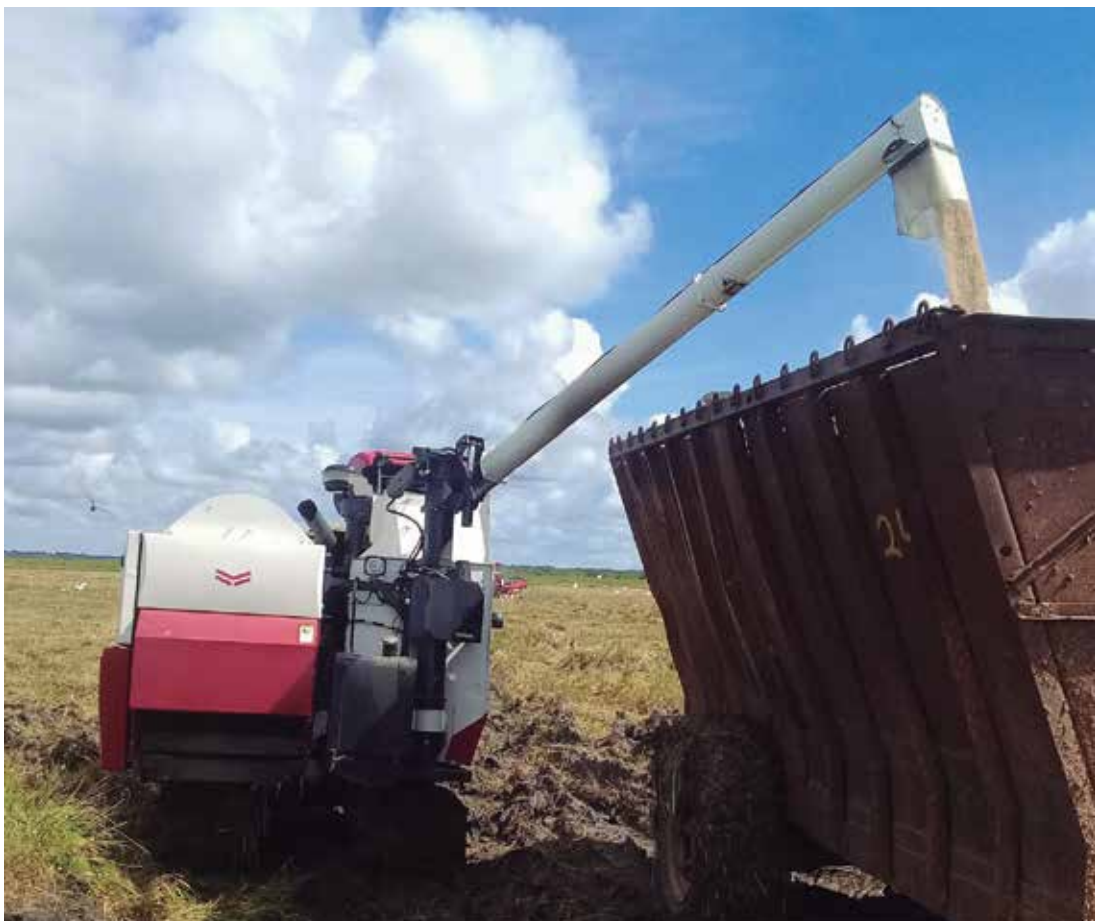
La alta humedad que prevalece en muchas terrazas hace más compleja la recolección del cereal.