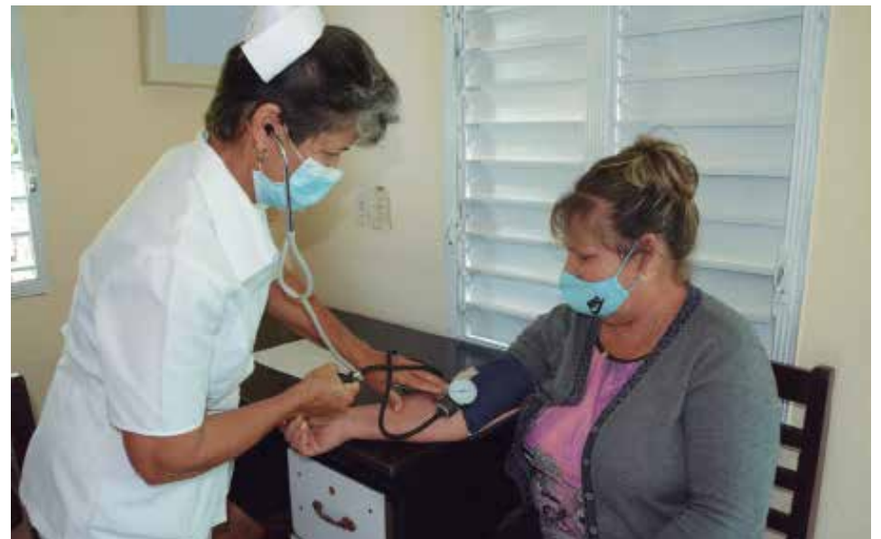
Por predominar la población envejecida, alrededor del consultorio acontece parte de la vida diaria.

“Cuando empecé aquí este era el lugar más conflictivo que tenía la provincia en cuanto al delito, pero se creó una Comisión de Prevención y, gracias al trabajo y apoyo