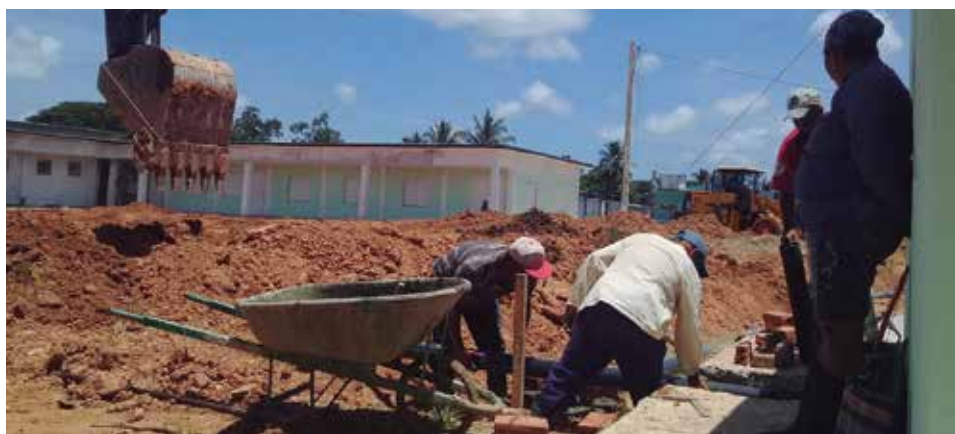
La obra sobrepasa los 10 millones de pesos.