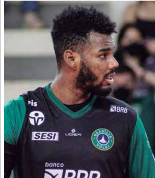
Goide fue el pasador más destacado del torneo.

A sus 37 años, Amargo formó parte del quinteto regular que consiguió el boleto al Centrobásquet 2022 y que próximamente buscará la clasificación a los Juegos Centroamericanos y del Caribe de San Salvador 2023. (E. R. R.)