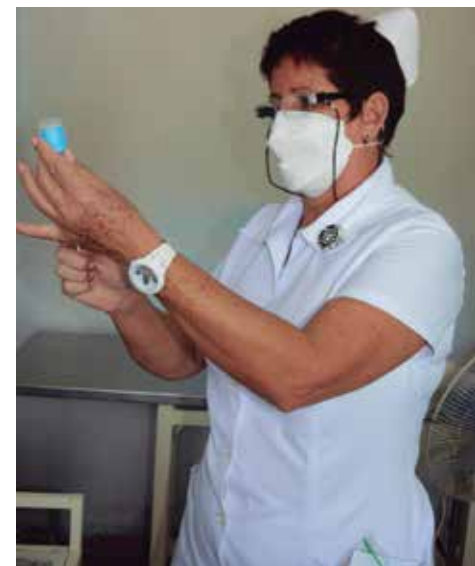
El refuerzo se aplica a quienes han cumplido seis meses de recibir la primera dosis.

“El refuerzo anticovid se les suministra a quienes han cumplido seis meses de recibir la primera dosis —explicó Díaz Rojas— y en el caso de los que estén contagiados en el mo-