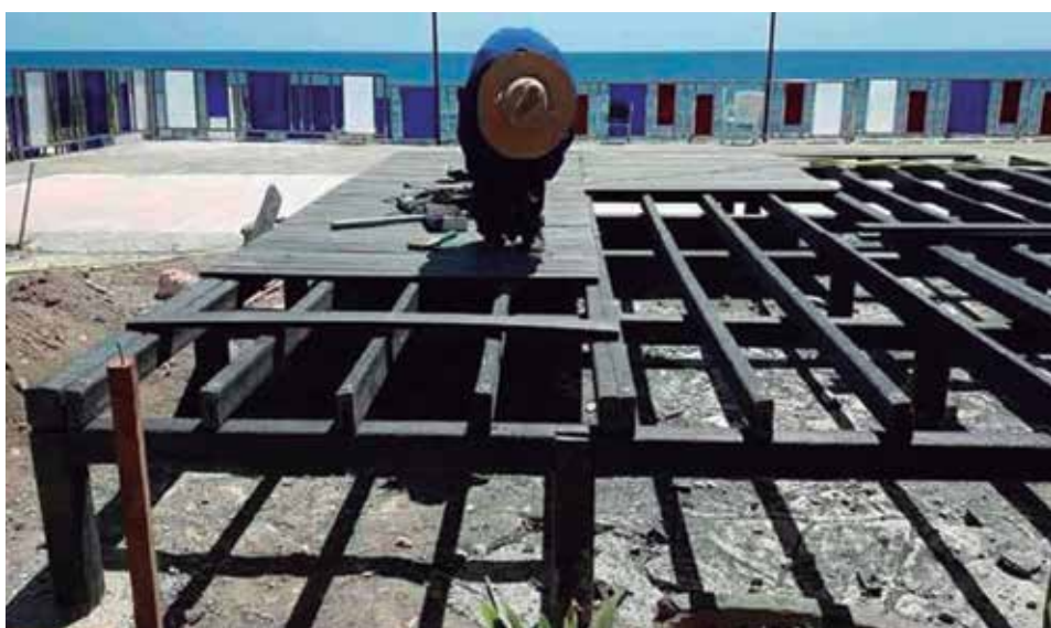
Las mipymes en Sancti Spíritus abarcan un amplio espectro de actividades productivas y de servicios.

La cuarta área destinada al esparcimiento popular es la de los portales de la Casa de Cultura, espacio que en esta ocasión acoge al Órgano Oriental y otras agrupaciones locales los días 25, 26 y 27 de julio, para dar continuidad al amplio programa recreativo a propósito del verano 2022 y en saludo a la efeméride del Moncada.