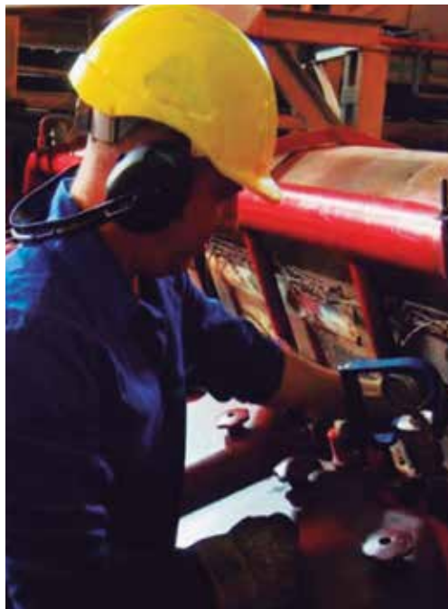
Para alcanzar resultados positivos resultan necesarias las operaciones y labores de mantenimiento durante las 24 horas del día.

Aunque la prioridad está en asegurar con los grupos de generación distribuida el déficit en la generación termoeléctrica y abrir un camino hacia la luz cuando los grandes motores no pueden más, los trabajadores no dejan atrás el compromiso de los cuidados medioambientales que se manifiestan en el mesurado vertimiento de desechos a aguas aledañas y la discreta emisión de ruidos y gases contaminantes a la atmósfera.