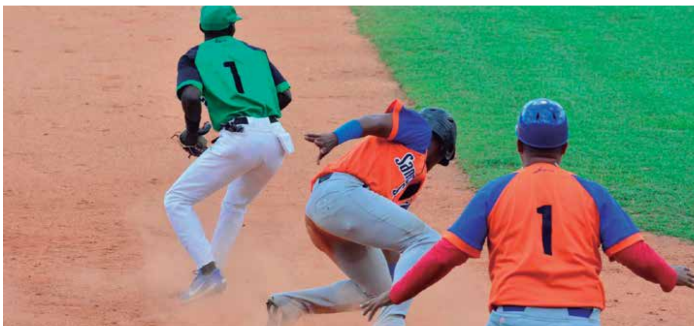
El evento regresa mutilado, después de dos años de ausencia.