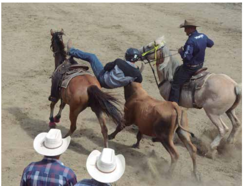
La Feria Delio Luna Echemendía acogerá espectáculos de rodeo y tendrá varios espacios con música campesina y mexicana.

Finalmente, al valorar el resultado de estas nuevas estructuras a casi un año de creadas mencionó su innegable aporte a la economía, fundamentalmente a través de los encadenamientos productivos que generan con el sector estatal.