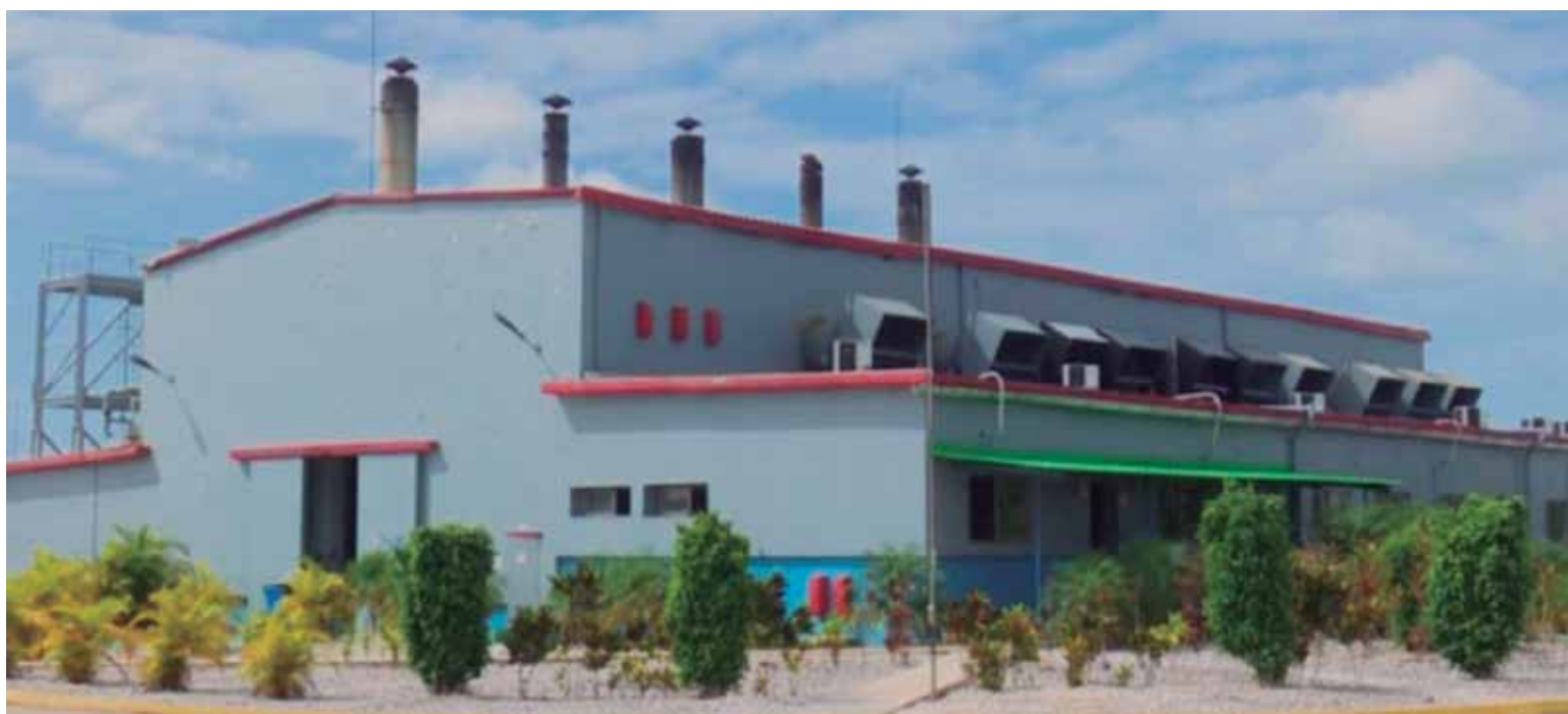
La entidad se ratifica como referencia nacional en la preservación del medio ambiente.