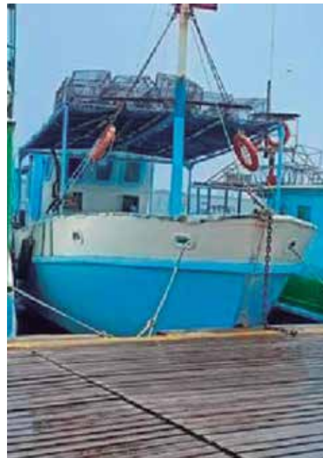
Parte de la flota langostera antes de su primera salida al mar.