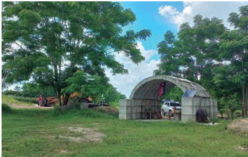
Se levantan varias de las estructuras que se han concebido para que la pieza no solo sea contemplativa.

En un área de 49 hectáreas, donde solo habitaba una tupida maleza, en la zona norte del kilómetro 339 de la gran carretera, muy