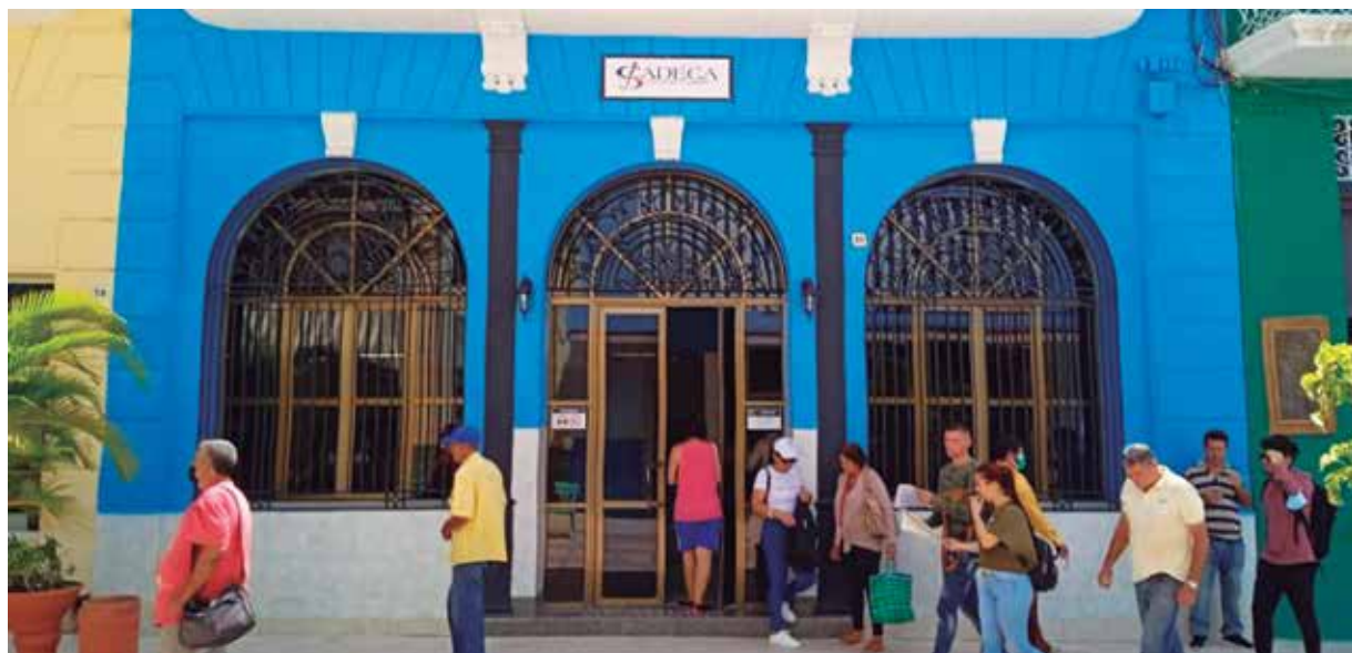
La compra ya se efectúa en unidades de Cadeca de Cabaiguán, Sancti Spíritus y Trinidad.