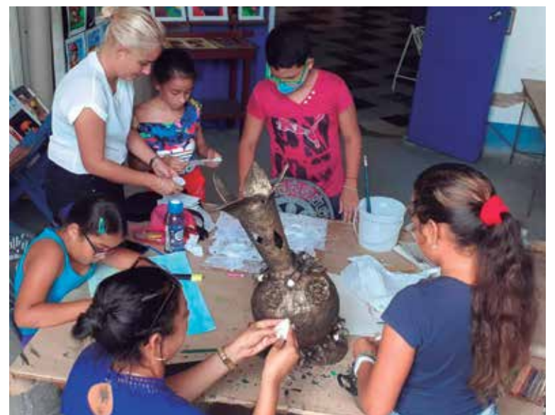
Resulta complejo conseguir los recursos para crear con la técnica de papel maché.