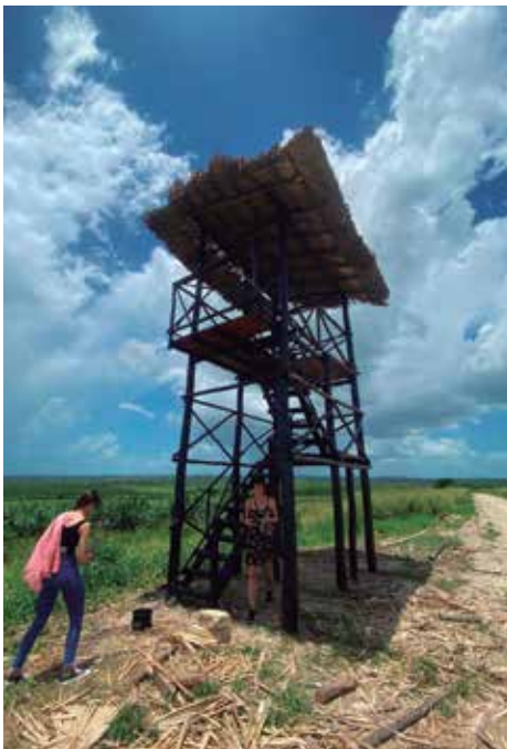
Desde el mirador se pueden apreciar los avances de la obra.

Un día Viaje infinito ubicará el kilómetro 339 de la Autopista Nacional entre lo más significativo de las artes visuales del país, con unas cuantas miradas internacionales. No solo aunar a la crítica y experticia, sino que pudiera convertirse en cátedra para transformar nuestras relaciones con los contextos naturales, en busca de vínculos menos perjudiciales y desde la sostenibilidad.