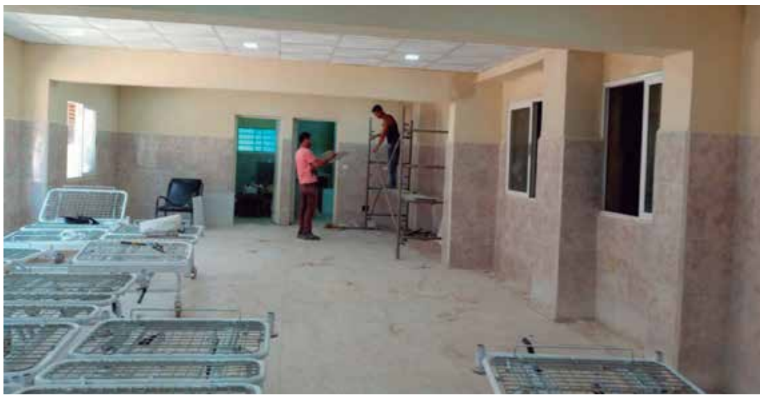
La sala de Medicina se incorporará a los servicios con un alto confort.