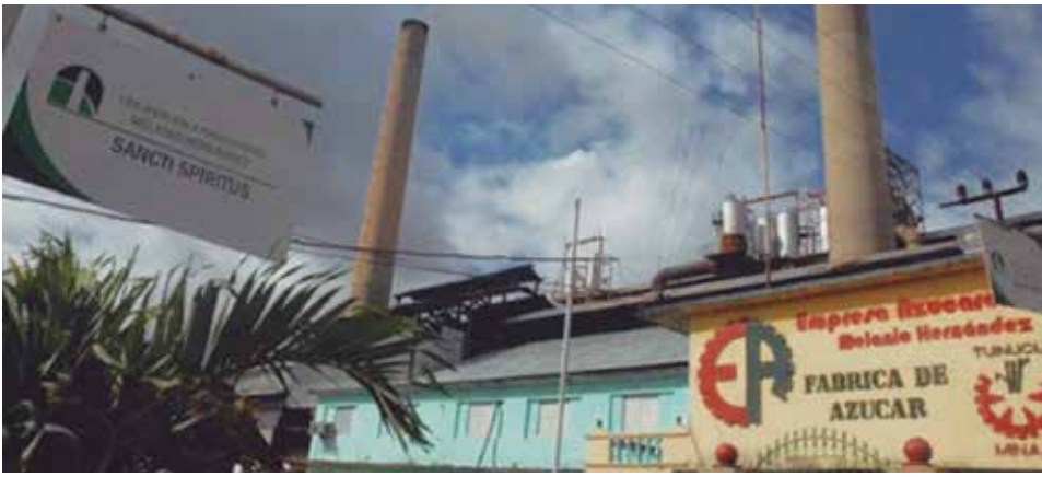
Al cierre de julio se declaró listo el 79 por ciento del equipamiento fabril en el central de Tuinucú.