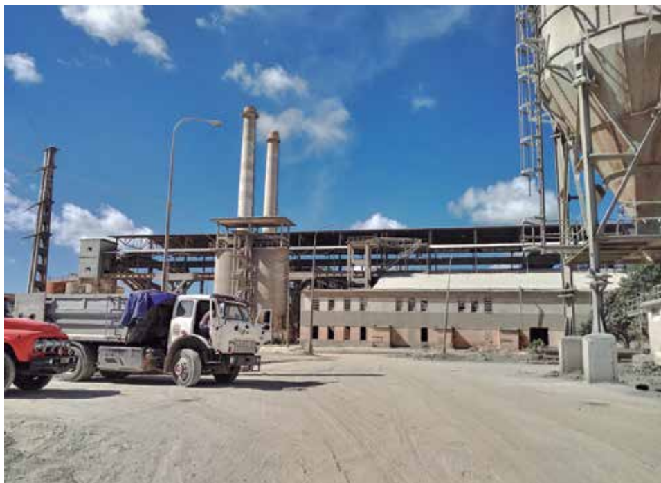
En la industria espirituana existe un proyecto para la fabricación de cementos especiales.