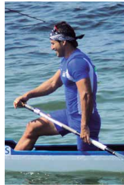
El espirituario cumplió una amplia preparación para retornar al C-2 a 500 metros.

Para enfrentar estos fuertes eventos todos realizaron un entrenamiento en la altura colombiana y en la presa La Coronela, de Caimito.