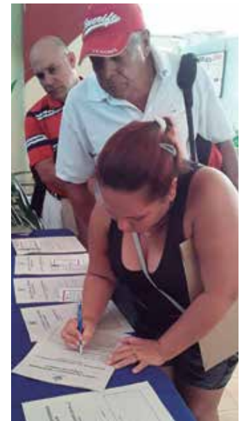
Unas 3 200 autoridades electorales tomaron posesión.

Un porcentaje de los cambios incluyen mejoras en la redacción, mayor rigor en la semántica, reformulación de enunciados, desglose en incisos y cambios de letras, entre otros, para lograr mayor entendimiento y comprensión del texto.