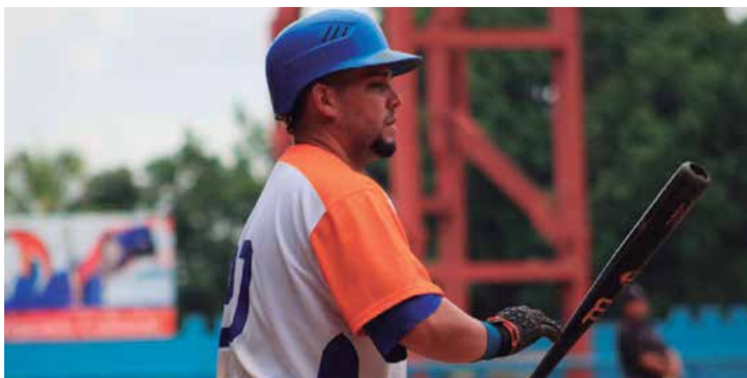
Además del bateo en sí, en Yunior resaltó la oportunidad del turno al bate.