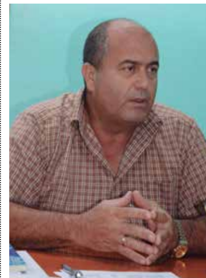
El director provincial de Educación afirmó que el objetivo es elevar la calidad del aprendizaje.

“Todas las instituciones están funcionando y el compromiso de los educadores espirituanos es elevar los indicadores de calidad del aprendizaje y aportar a la formación integral de las nuevas generaciones”, asegura el director provincial de Educación.