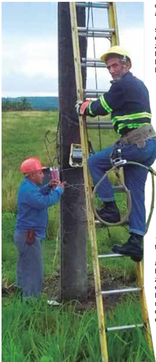
El liniero apuesta por atender las interrupciones en el menor tiempo posible.

Claro que he pensado en la muerte, pero no le temo, mucho menos viendo a mi familia, que es muy unida. Aquí nadie es eterno y el día que no esté, mis hijos me recordarán como lo que fui, una madre con mandarrias y flores, porque cuando era necesario reclamarles lo hacía, pero cuando tenía que elogiarlos y darles amor, ahí estaba yo.