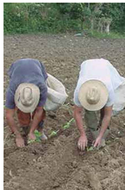
Se programa una siembra de 1 470 hectáreas de tabaco.

Con respecto a la campaña 2021-2022 al cierre de agosto la provincia tenía acopiadas 1 754 toneladas, el 80 por ciento de lo planificado, recolección que está prevista a concluir en la primera decena de septiembre, según Hernández Toledo.