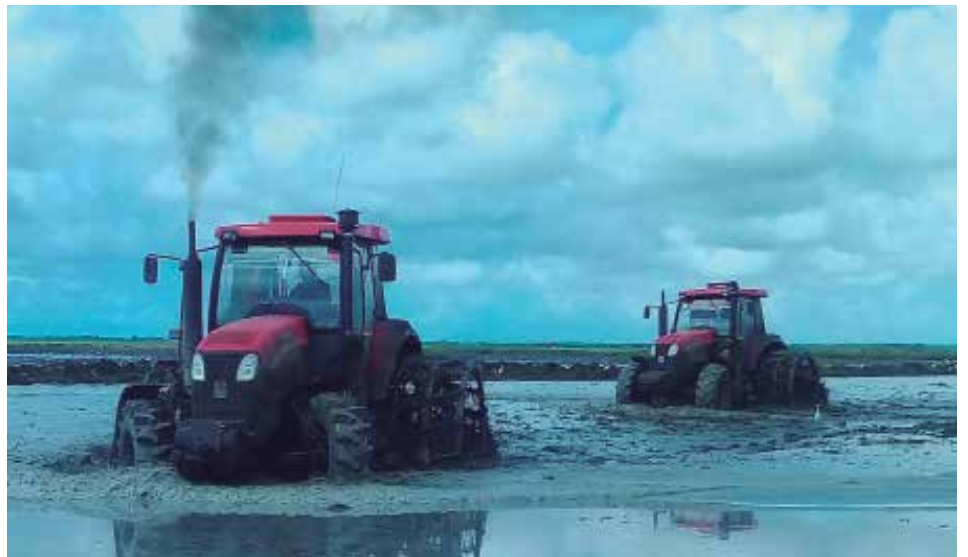
En los dos años más recientes, el nivel de agua subterránea extraída no rebasó los 10 millones de metros cúbicos anuales.

Aun así y en dependencia de la disponibilidad de insumos y otros medios, en el último lustro la empresa sierpense ha priorizado las acciones para la implementación de la Tarea