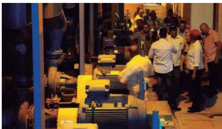
En un reciente recorrido por la Planta Potabilizadora, la viceprimera ministra Inés María Chapman constató el avance de los trabajos.

La planta, actualmente a un 95 por ciento de ejecución, comprende un cuarto de máquina y compresores, edificio socio-administrativo, filtros de agua, control de filtros, sala de química y cloración y un decantador, entre otras áreas.