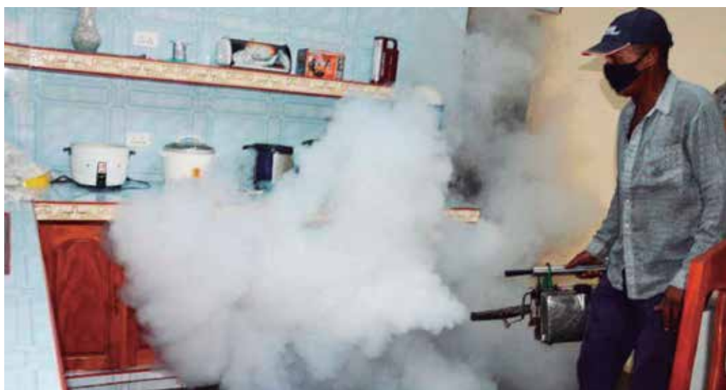
En las zonas más comprometidas se desarrollan acciones de carácter intensivo.