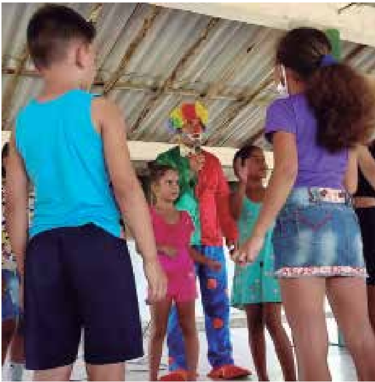
El público infantil recibió con regocijo a los teatreros.

La XXVIII Cruzada Teatral Por la ruta del Che distinguió la etapa estival al lograr, en condiciones complejas, llevar el arte a 125 comunidades de la provincia