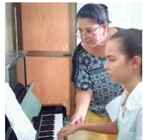
Los educandos tienen aseguradas las condiciones materiales para culminar el curso.