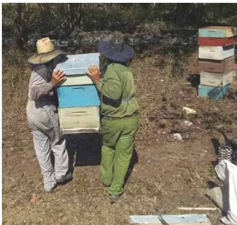
En los meses finales del año se enmarca la mayor producción de miel.

De las 803 toneladas inscritas en el plan del año, unas 120 dependían de los resultados de la movilidad de los apiarios hacia las costas, de ahí la trascendencia del cuatrimestre final en busca de recuperar los niveles productivos de un renglón con incidencia en la economía y la exportación.