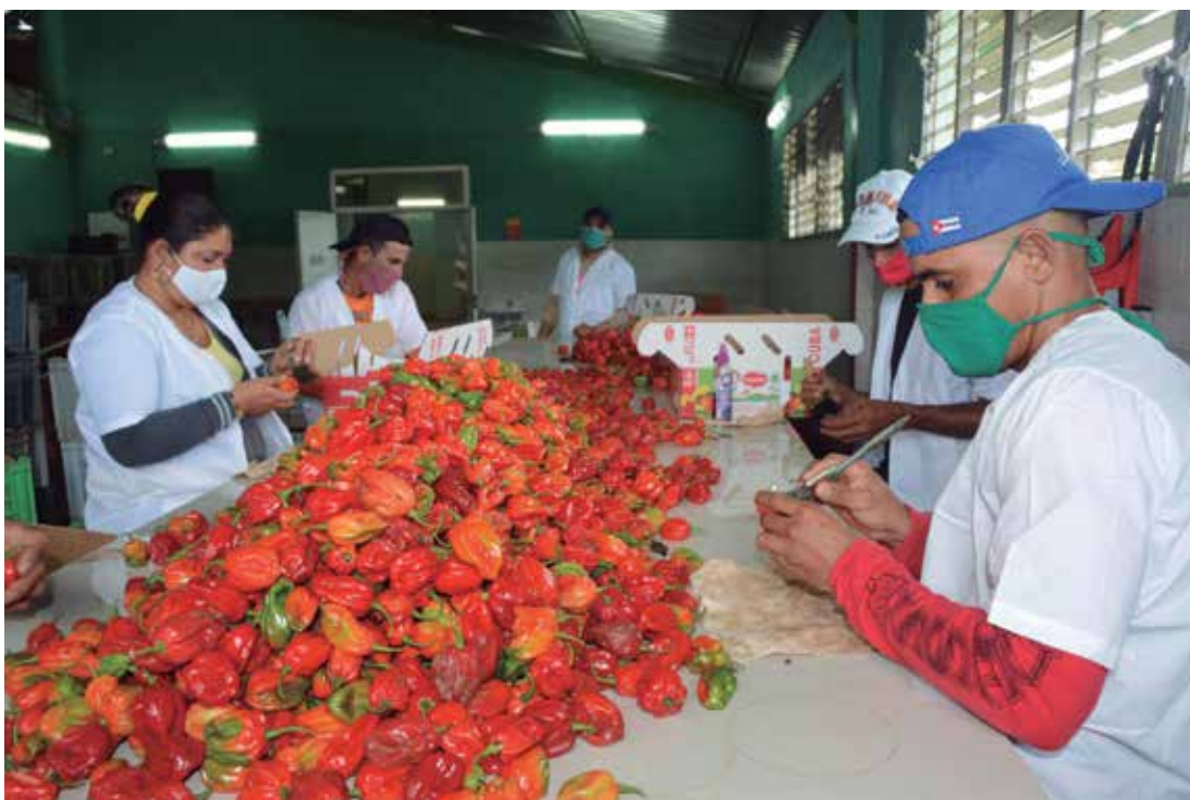
En la muestra se incluye la Empresa de Frutas Selectas.