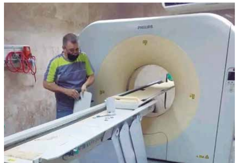
Trabajadores de Electromedicina devuelven vitalidad al tomógrafo del Hospital General Provincial Camilo Cienfuegos.

Máquinas de anestesia, autoclaves, ventiladores, equipos de alta tecnología... continúan funcionando, en ocasiones, gracias a las soluciones que idean aquellos hombres que, casi siempre, desde el anonimato hacen realidad la magia de la recuperación.