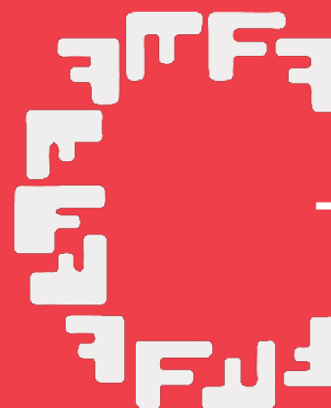
ALGUNOS ASPECTOS ESTABLECIDOS POR LA LEY