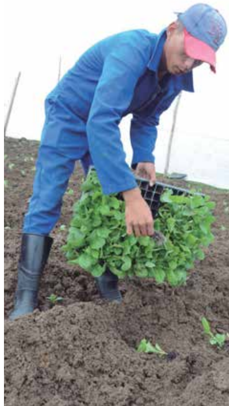
Alrededor de 950 vegeros sembrarán tabaco en la provincia.

Una de las fortalezas de la campaña es que participan los productores que tradicionalmente han obtenido rendimientos agrícolas por encima de una tonelada por hectárea y cuentan con las mejores condiciones de infraestructura, según precisó Hernández Toledo.