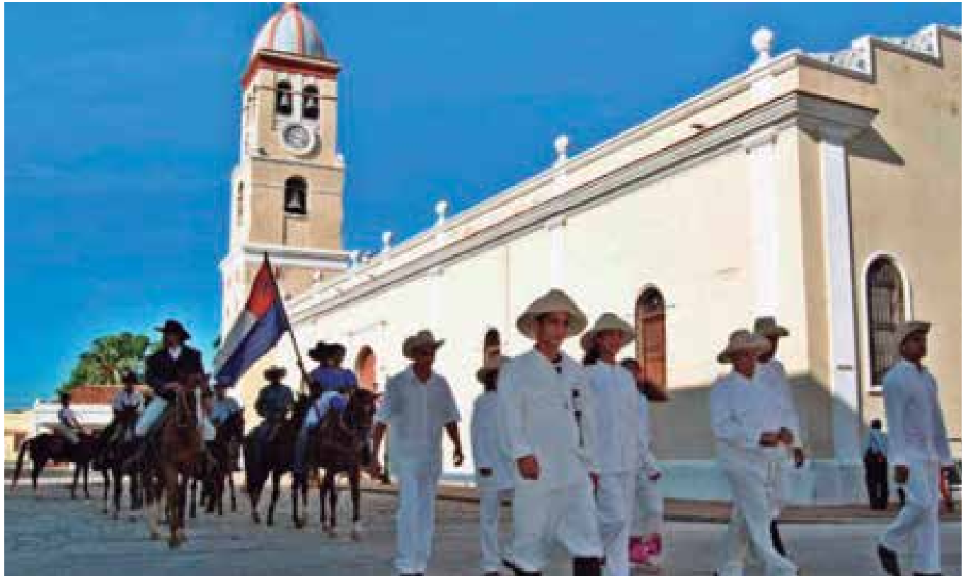
En la Plaza del Himno de Bayamo se evoca cada año el origen de La bayamesa .

Solo en el libro Bayamo , de José Maceo Verdecia, he visto la referencia a la ejecución instrumental del himno durante los festejos de Santa Cristina. Allí, sin embargo, no se especifican los nombres de los concurrentes ni se alude al canto de La bayamesa . Maceo Verdecia es