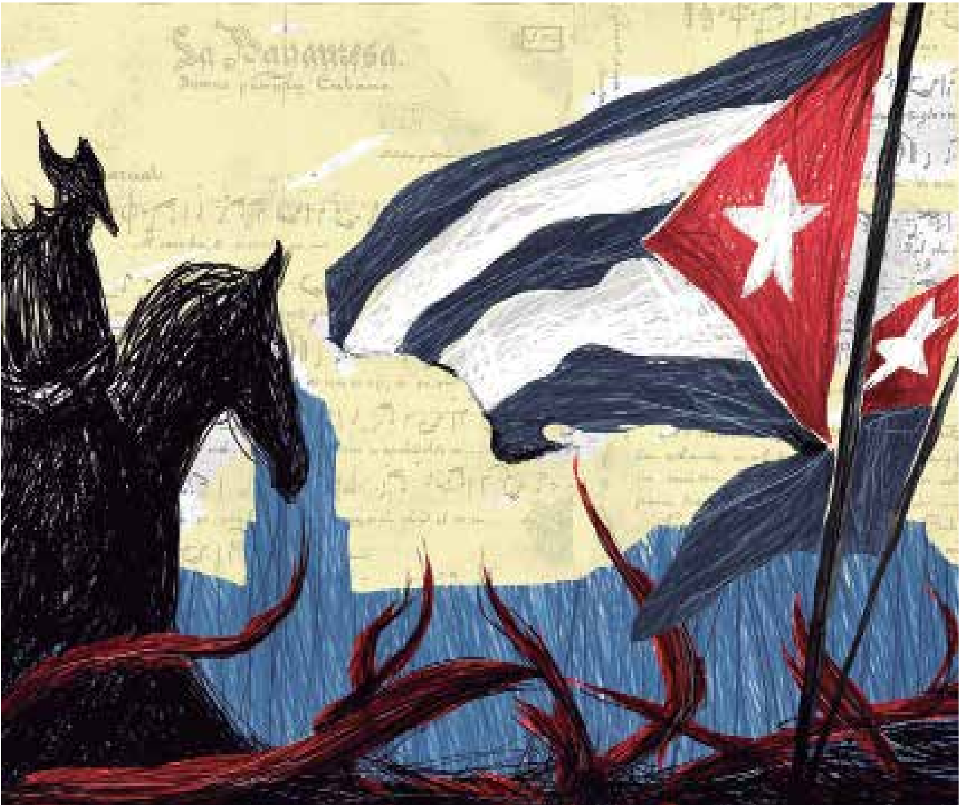
Ilustración: José A. Rodríguez Avila