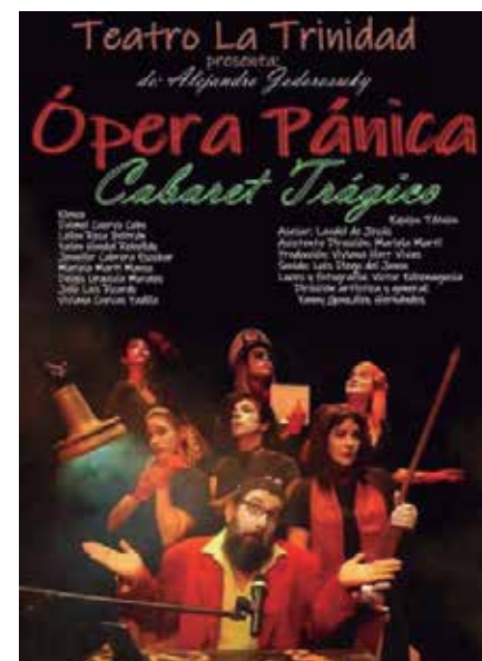
La agrupación regresa a la obra de Jodorowsky con Ópera Pánica .

Primero, de manera materialista y como ente social que soy, es mi sustento de vida, ya con que me paguen por hacer algo que me gusta y disfruto es suficiente. Por lo demás, es compromiso conmigo y con mucha gente que me rodea. Sigue siendo el teatro mi asidero, el lugar al cual volver cuando las cosas van a peor, es el lugar donde mantengo los sueños que todavía me restan y con los que navego cada día, a pesar de todo, enfrentándome a la tormenta de la cotidianidad.