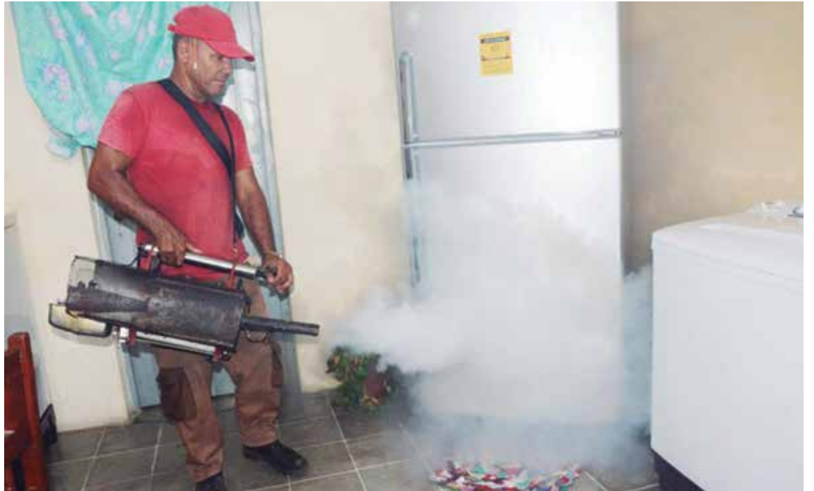
En Sancti Spíritus, Cabaiguán y Trinidad se desarrolla la fumigación de manera intensiva.

Como causa directa del dengue no han existido fallecidos en la provincia; sin embargo, personas con morbilidad asociada de enfermedades no controladas que han padecido de dengue anteriormente o en el transcurso del mismo han presentado signos de gravedad y complicación de su patología de base. Por lo que se hace necesario y de vital importancia acudir a los servicios de salud de forma rápida