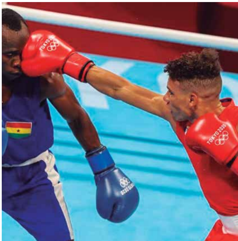
El espirotuano se incluye en el grupo de Domadores de Cuba que escalará al escenario de Tijuana, México, el próximo 28 de octubre.