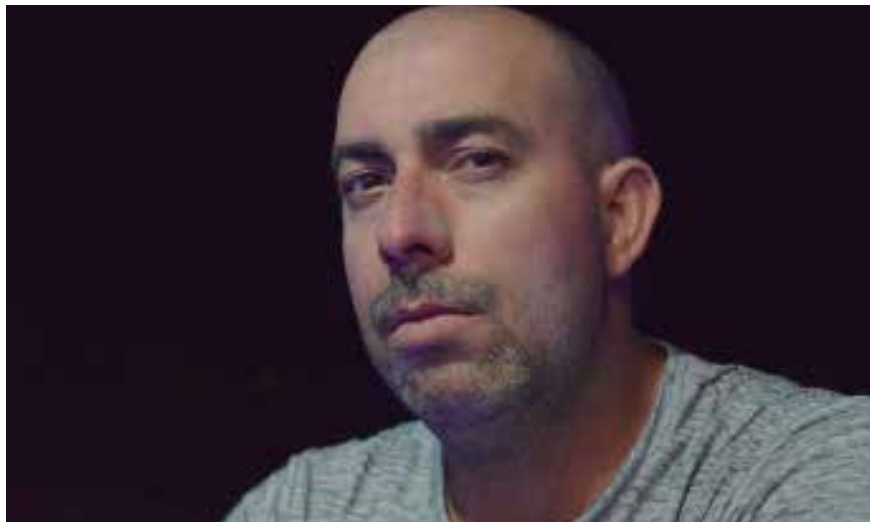
Yanny sigue encontrando en el teatro un asidero permanente.

Según entiendo, Jodorowsky defiende un aparato de conceptos, tanto mixtos como insólitos y, sobre todo, bien alejado del realismo, tan caro al teatro cubano actual. Sin embargo, persiste usted en discursar, digamos que en un terreno que se define entre el existen-