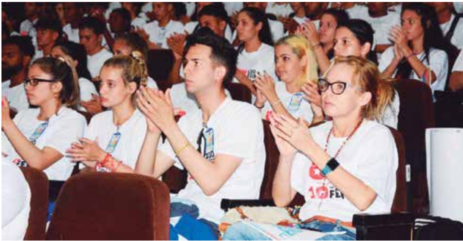
Los estudiantes coincidieron en la necesidad de que la brigada sea más dinámica en la solución de los problemas.