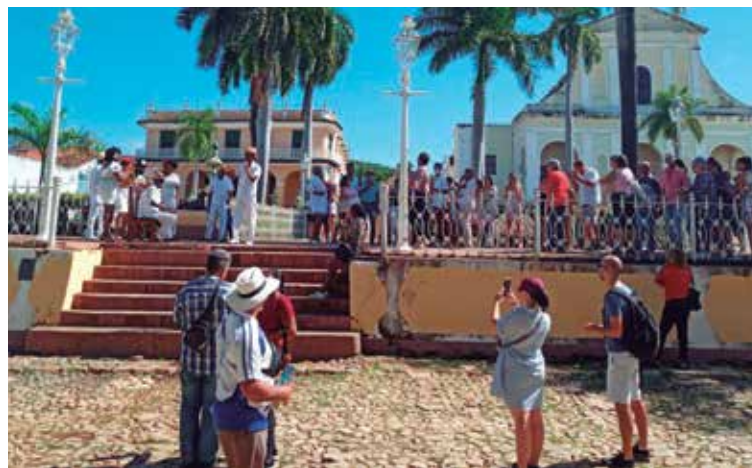
Visitantes de todo el mundo admiran los valores de la villa trinitaria.

Como principales escenarios se encuentran las plazuelas del Jigüe,