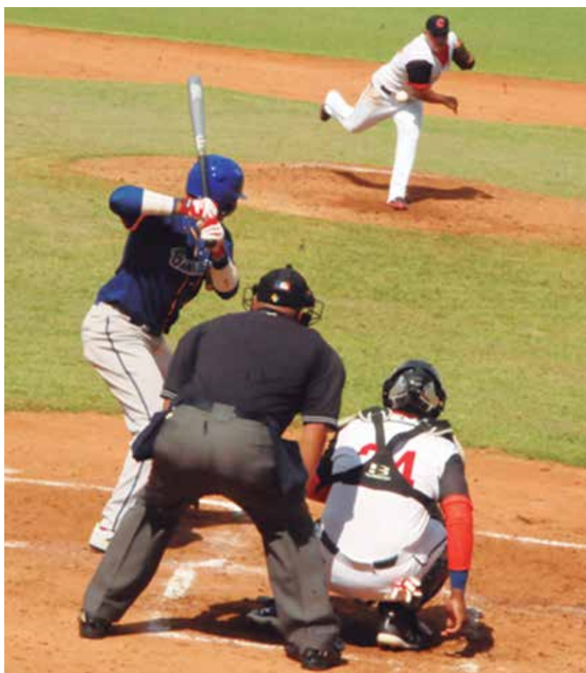
En los primeros partidos se ha mostrado paridad en los equipos.