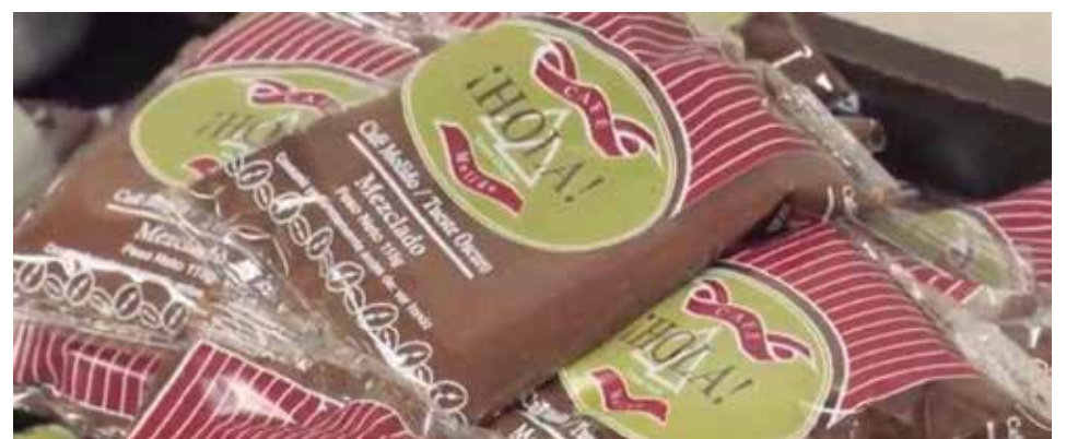
El precio del producto normado se incrementará a partir de noviembre.

El director expuso, además, que ya concluyó la producción de todo el café co-