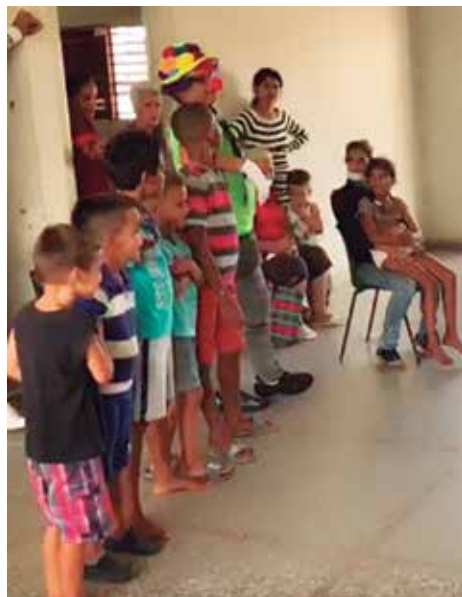
Tin Marín arrancó sonrisas a un público especial.

“Quiero agradecer inmensamente al pueblo de Jatibonico, porque muchas buenas manos aportaron para que regaláramos nuestra fantasía en una zona devastada por el huracán. Salimos el viernes 14 de octubre a la 1:15 a. m. para la botella con una valija bastante grande. Llegamos a La Habana, donde hasta los choferes de la guagua nos ayudaron a cargar los bultos y, de ahí, nuestro destino fue Pinar del Río. Primeramente, pensamos llegar hasta la comunidad del kilómetro 21 de La Coloma, pero la promotora cultural y la delegada del lugar nos comunican que solo había dos familias evacuadas y