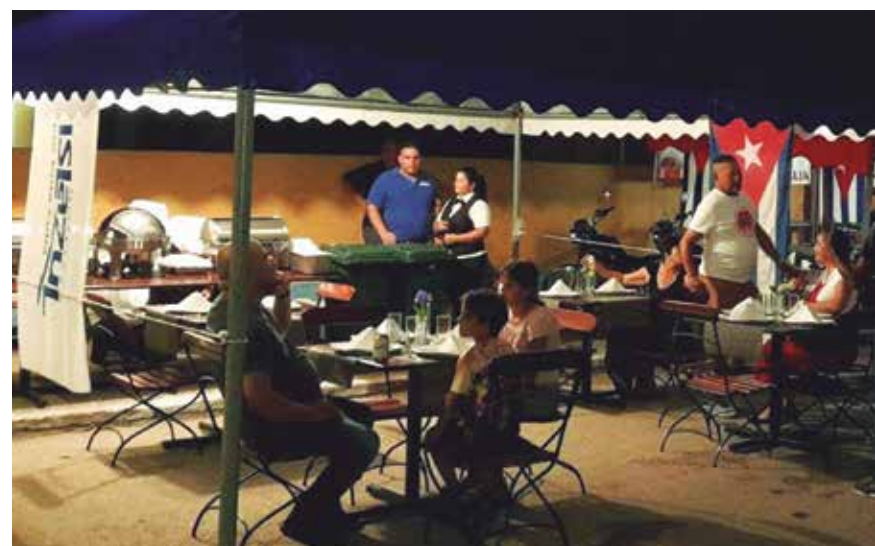
El montaje de unidades de la gastronomía estatal y otros puntos de venta de alimentos distingue las Noches Espirituanas.

Igualmente, dijo que toca al sector de la Cultura desarrollar un grupo de actividades dirigidas a amenizar los diversos espacios con la actuación de solistas, tríos y agrupaciones del territorio.