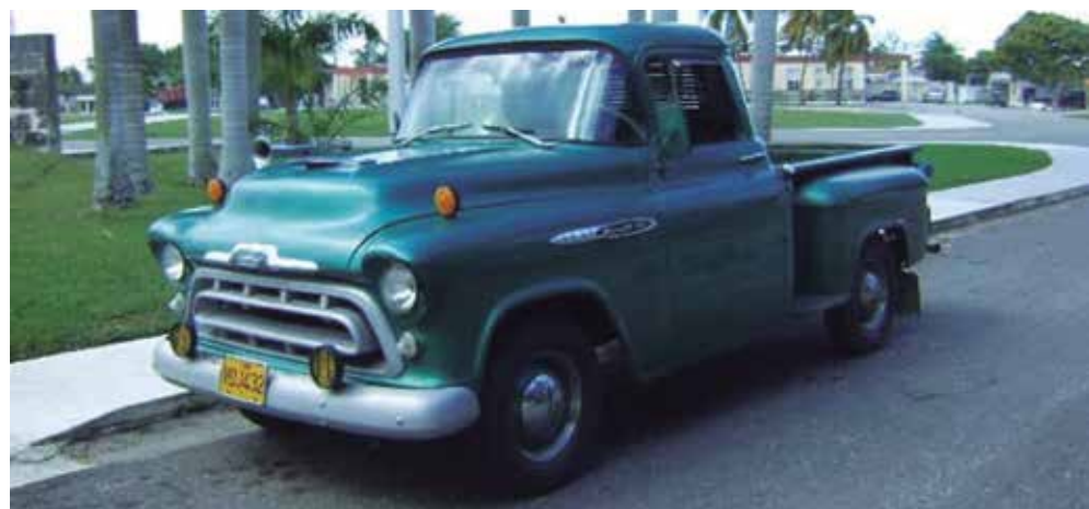
La camioneta está lista para sumarse a los exponentes exteriores.

“Todo lo que logre el museo rescatar relacionado con la historia del Frente Norte de Las Villas tiene mucho valor —expresa—, porque los exponentes dan información, transmiten enseñanza, ayudan a entender el esfuerzo que tuvieron que hacer Camilo y su tropa para lograr liberar esta zona y triunfar en la batalla de Yaguajay”.