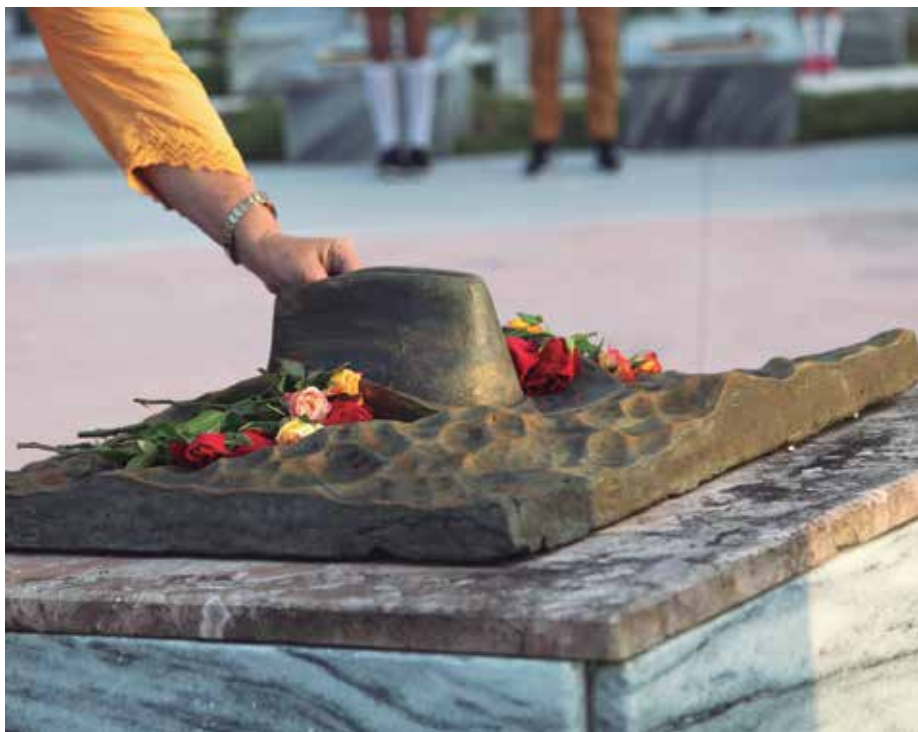
El tributo llega al Mausoleo del Frente Norte de Las Villas, de Yaguajay.