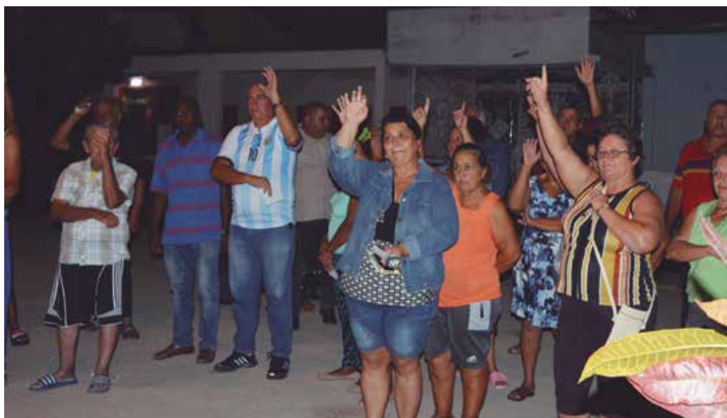
Este fue uno de los más de 2 000 encuentros de su tipo previstos en la provincia.