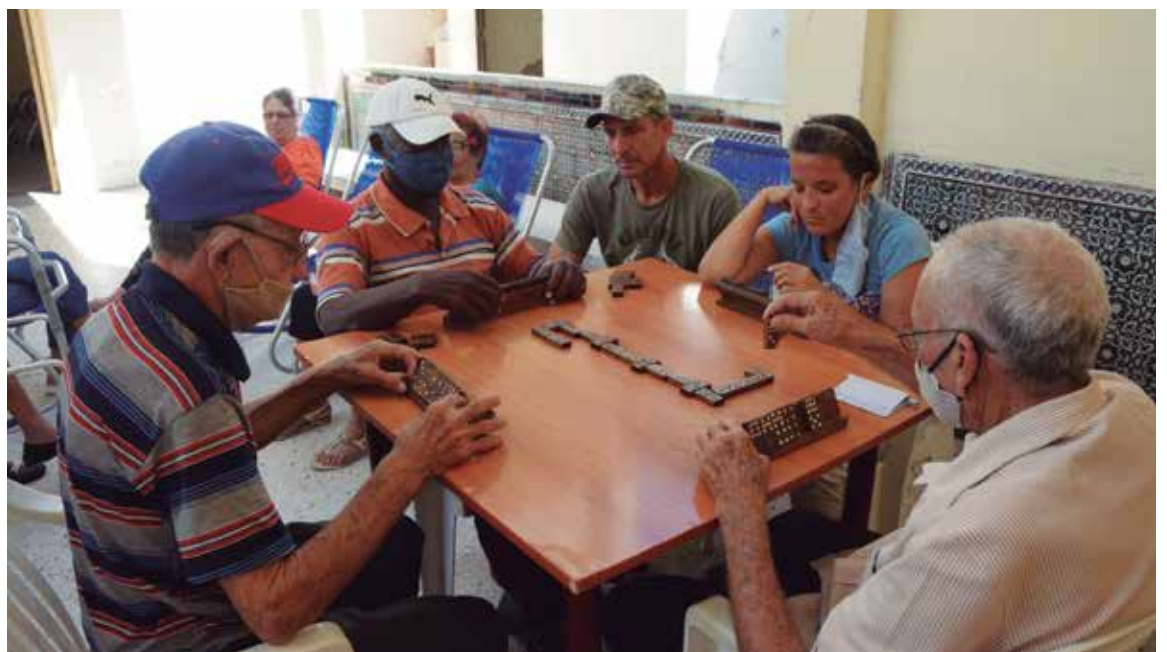
Más de 470 adultos mayores reciben atención en los hogares de ancianos y casas de abuelos de la provincia.

En general, la Asistencia Social en la provincia protege actualmente a 4 229 núcleos que reciben prestaciones económicas y de servicios por sus vulnerabilidades, para lo que cuenta con un presupuesto de 157 millones de pesos, de los cuales cerca del 80 por ciento ya se ha ejecutado.