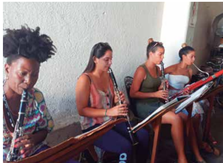
Trinidad es una tierra pródiga en músicos y jóvenes talentos que garantizan la continuidad de la banda.

Con 33 músicos y casi todos los instrumentos, la centenaria agrupación merece que se le valore como lo que es, una joya de la cultura local.