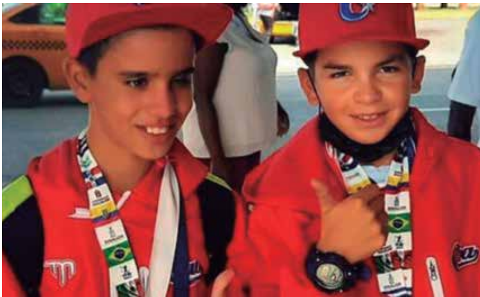
Los destinos de ambos atletas comenzaron a forjarse en la base.