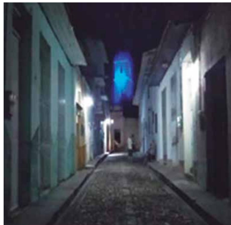
La refracción de la luz proveniente de una discoteca particular provoca este singular efecto en la torre-campanario de la Iglesia.

De cualquier manera, aunque la gama de luces intermitentes con matices llamativos no proviene desde el interior de la torre de la Mayor, el efecto que causa en ella llama la atención de los espirituanos, que lo ven como algo novedoso, por lo que siguen asociándolo a los adornos que indican la llegada de la Navidad.