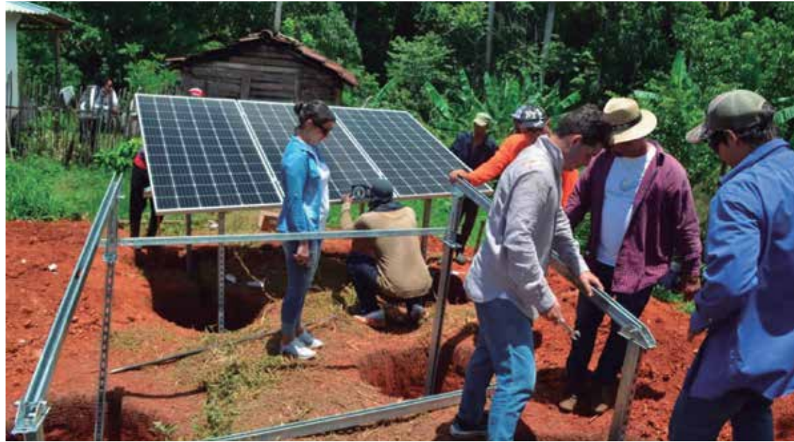
En algunas comunidades la instalación de las nuevas fuentes de energía ya es un hecho.

“Cuando la Unión Europea propone un programa de apoyo a la política energética en Cuba, el Ministerio de Energía y Minas nos designa como sus protagonistas. Estudiamos mucho porque teníamos en nuestras manos casi 8 millones de euros y era difícil llegar a tantos lugares con solo 20 y pico de