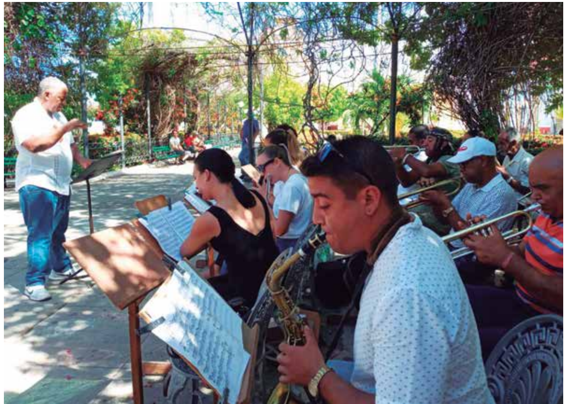
Varias generaciones de músicos confluyen en la Banda de Conciertos.