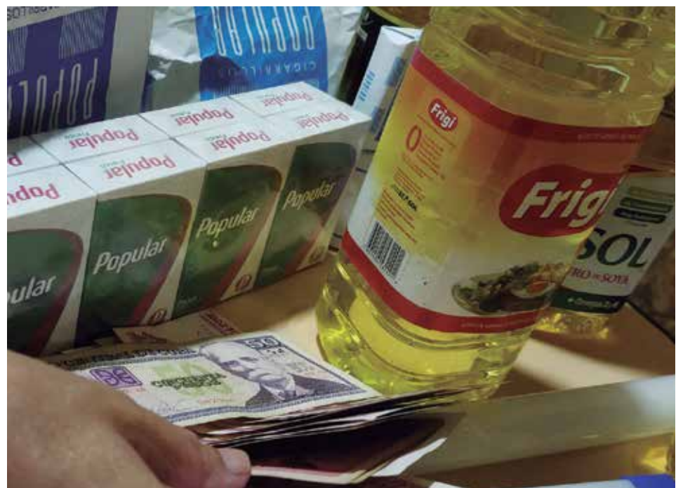
En las redes del comercio ilícito figuran productos de primera necesidad con gran demanda en la población.

En el caso del aceite de cocina, acotó, el 23 de noviembre hallaron 41 pomos sellados en un inmueble ubicado en Trinidad y un día después descubrieron igual cantidad del