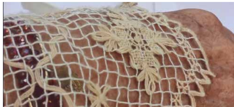
Las mejores creaciones serán premiadas por el jurado e instituciones que se suman a reconocer el valor de las propuestas.

Las piezas del XXVI Salón Provincial Create 2022 permanecerán expuestas en la galería espirituaña hasta las primeras semanas de enero. (L. G. G.)