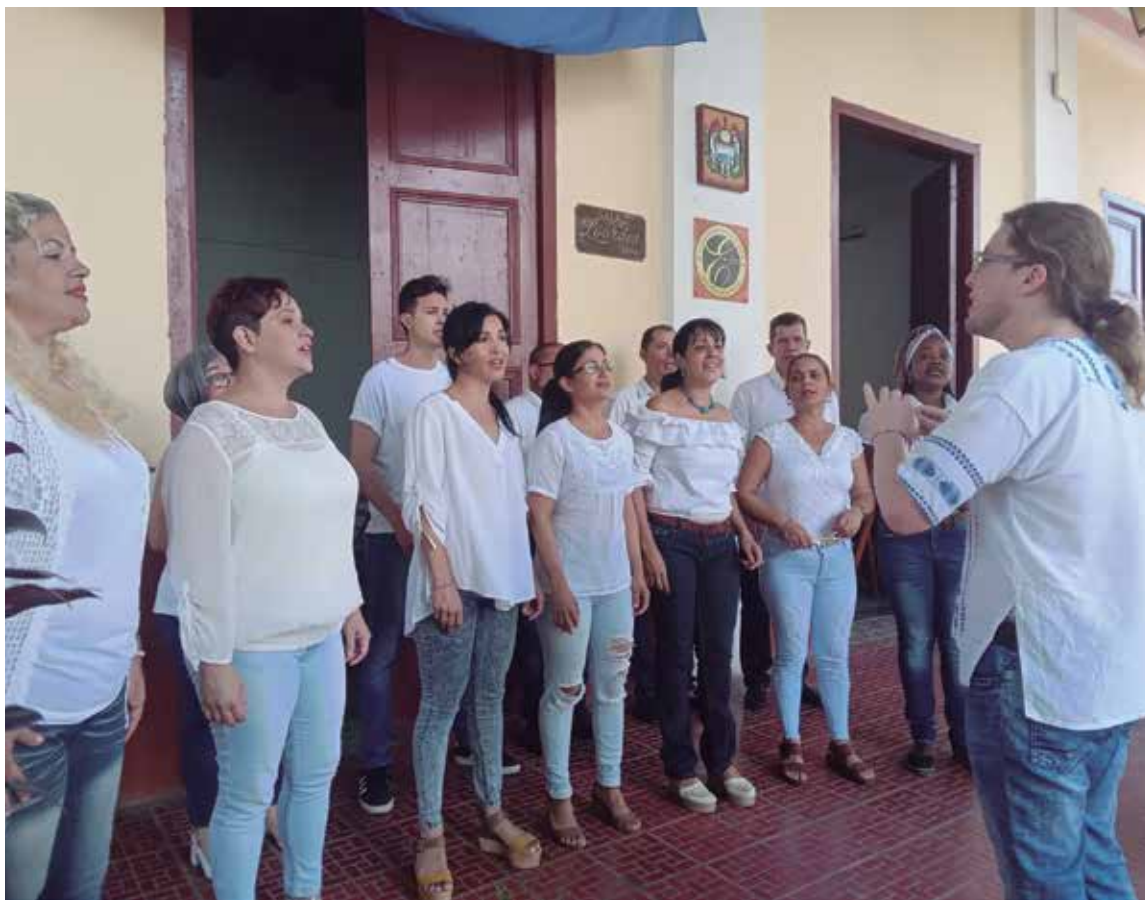
El coro Vocal Imago sonoriza Sancti Spiritus.

Justo por ese deseo de seducir más oídos, los cantores de Vocal Imago —con primer y segundo niveles— no optan por el silencio. De cara al año 30 de su existencia y su más cercana evaluación artística, incrementan su repertorio, a fin de seguir sonorizando con elegancia y estilo único la cuarta villa de Cuba.