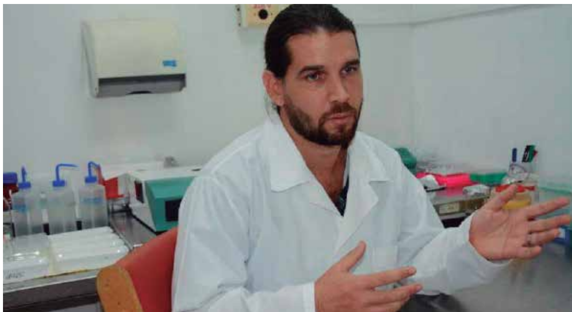
“Los jóvenes que integramos el sector de la Ciencia debemos estar siempre ávidos de conocimientos”, refiere.