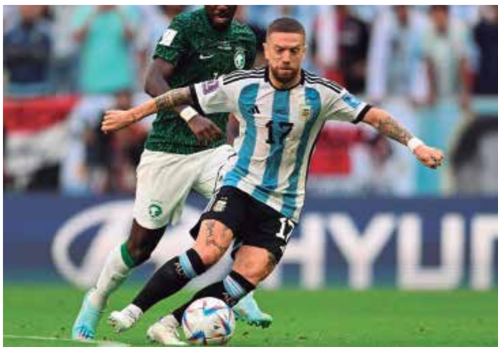
La selección de Argentina sigue luchando por conquistar su sueño.

La Liga Élite está por iniciar sus decimoterceras subseries este fin de semana. No es hora aún de tocar campanas, pero Ganaderos ni debe esperar por el repique.