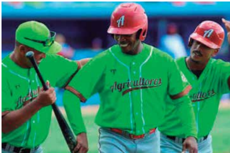
La combinación de Agricultores ha sido casi infranqueable.

Habrà que ver si, como en los dos últimos mundiales, triunfa la fórmula matemática del economista Joachim Klemen, que esta vez calculó a favor de Argentina, o la de un supuesto viajero del tiempo que vio a lo lejos la Copa en Brasil, o la de un simple mortal cubano que arriesga sus votos por el peso del equipo que lleva, simplemente, en su preferencia apasionante. (E. R. R.)