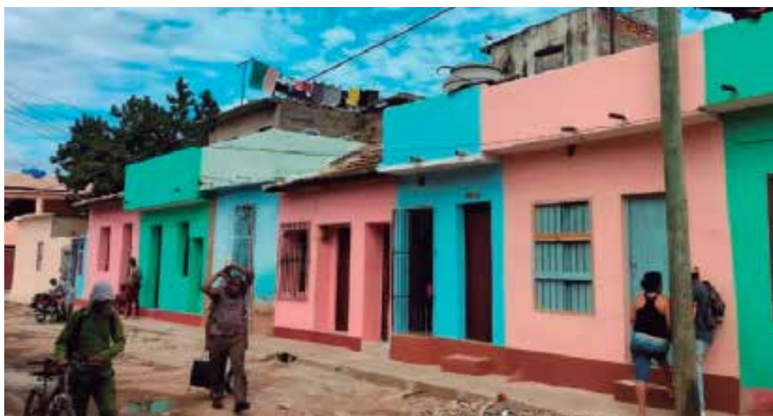
El programa incluyó la presentación del alcance de la intervención en la calle Independencia, en el barrio de Las Tres Cruces.