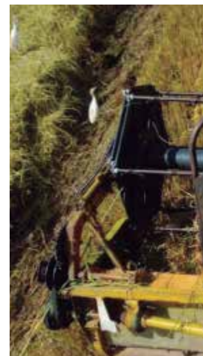
Debido a la escasez de insumos, se planifican discretos rendimientos agrícolas.

“En todas las bases se va a plantar arroz, no tenemos los recursos que necesitamos; pero aun así queremos sembrar para respaldar la fuerza de trabajo, utilizar la infraestructura y buscar economía, de lo contrario se nos va a perder la arrocera, teniendo ahora la seguridad del agua en la presa Zaza”, acotó el directivo.