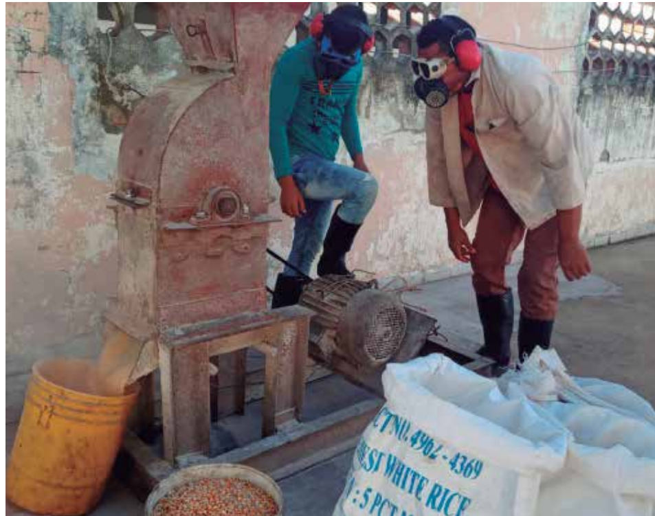
La falta de corriente trifásica constituye uno de los mayores problemas para aprovechar toda la capacidad instalada de la minindustria.