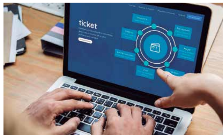
Ticket llegó a Sancti Spíritus el 3 de mayo del presente año.

La plataforma informática Ticket da sus primeros pasos en Sancti Spíritus y, de seguro, mucho tendrá que perfilar en el camino. La ubicación de todos los servicios, la confirmación oportuna de la reserva y el horario exacto para ofrecer los tickets pudieran ayudar al éxito de este recurso. (G. M. C.)