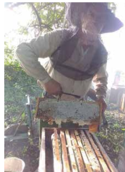
Aumentar el rendimiento por colmena será un paso clave para recuperar el atraso.

Pero, por segundo año consecutivo, la estrategia que busca sortear la falta de floraciones estables en los tradicionales emplazamientos de los apiarios se queda corta, pues ante las limitaciones con el combustible, de 5 600 colmenas previstas a desplazar, solo se movieron 3 200, situación que puede repercutir en las cerca de 180 toneladas de miel que se les estiman a las floraciones del mangle en las cotas, señaló la propia fuente.