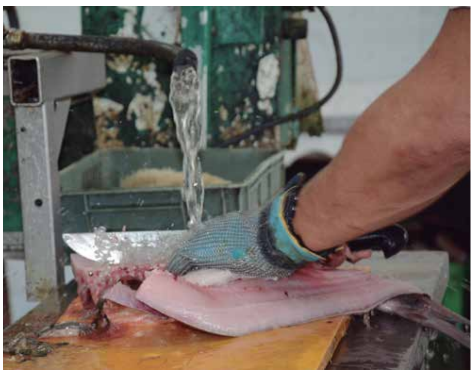
Incrementar las producciones con fines exportables continúa entre las aspiraciones del territorio.