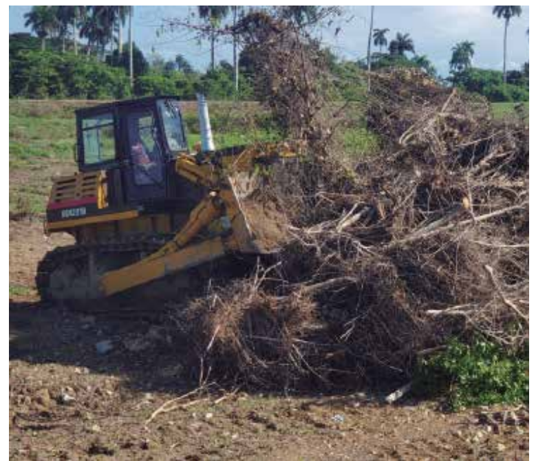
Actualmente se acometen trabajos de limpieza con el empleo de equipos pesados en los puntos más importantes para la evacuación de las aguas.