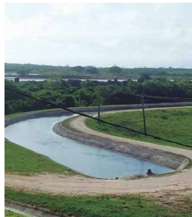
Tras permanecer en prevención hidrológica desde 1995, La Felicidad recuperó la capacidad de 57 millones de metros cúbicos.

En los días finales de mayo la provincia reportaba un acumulado de 417 millones de metros cúbicos de agua en sus embalses, equivalente al 35 por ciento de la capacidad total de llenado prevista.