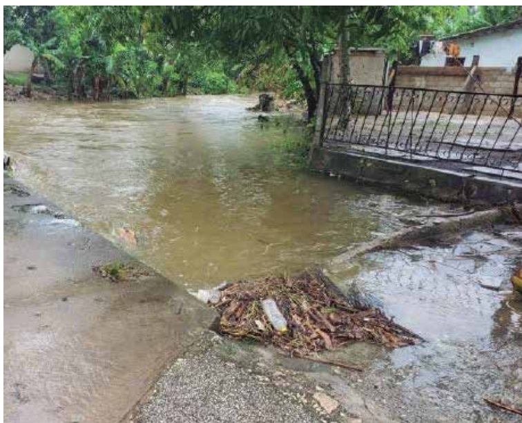
En junio del pasado año el río Máximo irrumpió nuevamente en el pueblo.

Mientras continúan los trabajos en el dique protector de Yaguajay para devolver cierta tranquilidad a sus pobladores, más de una súplica clama por que la etapa primaveral no desborde el río Máximo, cuyo cauce en algunas zonas deviene zanja pestilente, como resultado del vertimiento de aguas albañales y la indisciplina social, que favorece la acumulación de basura, escombros u otros desechos. Bien valen la pena algunas acciones en el afluente que atraviesa Yaguajay, pues la obstrucción de varios de sus puentes se convierte también en aliado de las inundaciones.