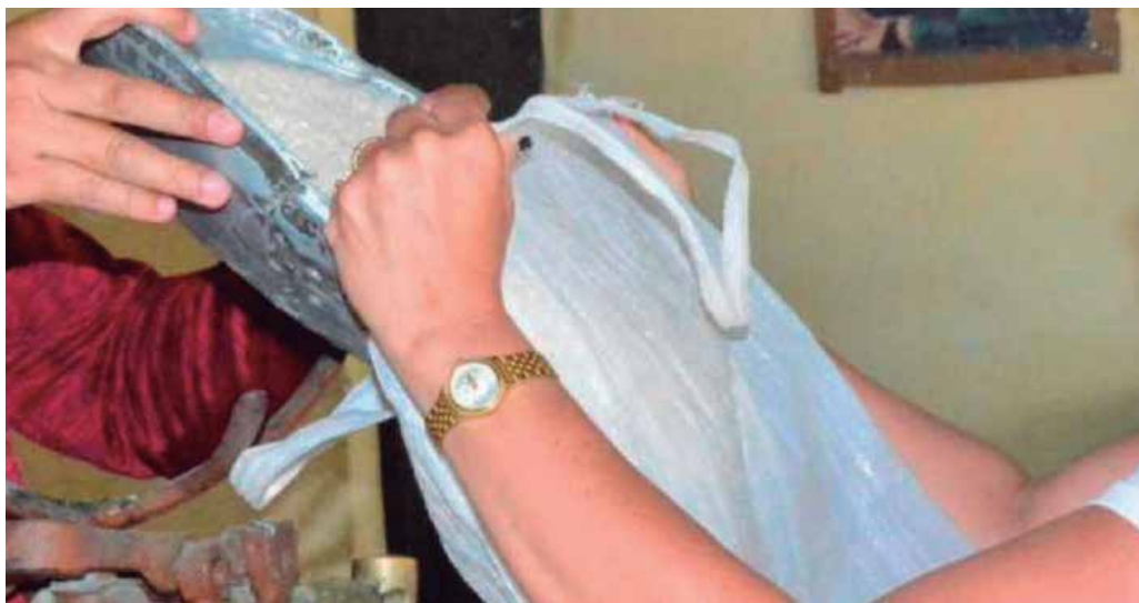
Este mes se distribuyeron inicialmente 3 libras de arroz por consumidor.