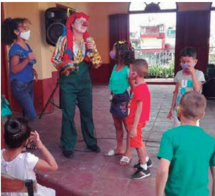
La máxima de la membresía espiritana es participar más activamente en la vida sociocultural de la provincia.

El venidero 13 de junio se realizará la Asamblea Provincial, en espera del cuarto cónclave de la organización artística juvenil