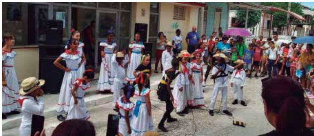
Las actividades involucraron a toda la comunidad.