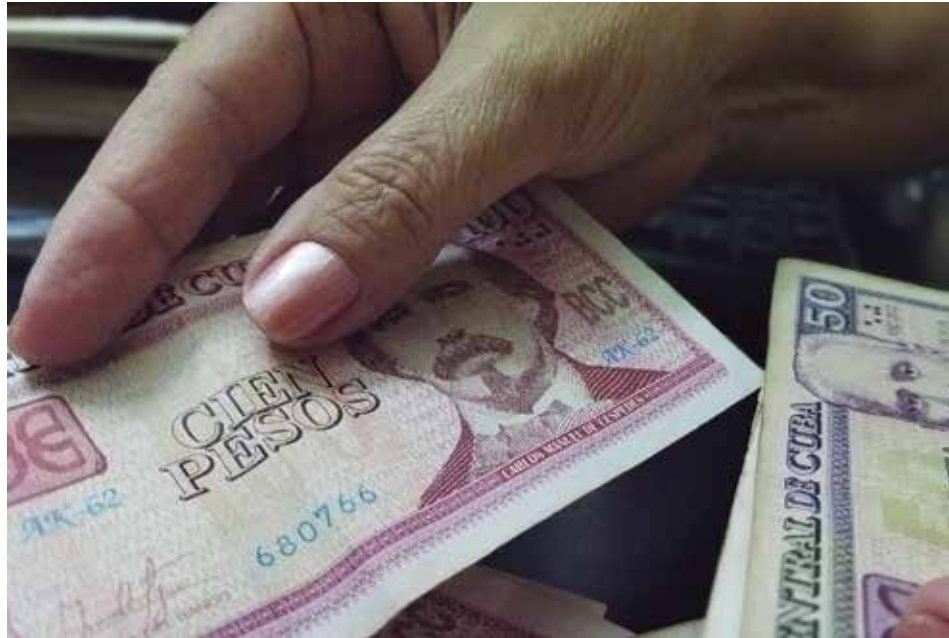
La inflación ha alcanzado cifras elevadas, lo cual incide de manera directa en la economía del país y en la de los ciudadanos.

Esto siempre implica un reto para la medición económica y se corre el riesgo de no ser completamente acertado en la medición,