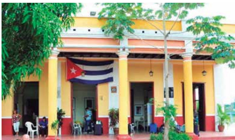
El evento sesionará en la Casa de la Guayabera.

A fin de generar el intercambio entre actores del desarrollo local a partir de las diversas formas de gestión, regresa a la tierra del Yayabo, del 19 al 21 de octubre, el VII Encuentro Vida Cultural y Desarrollo Local