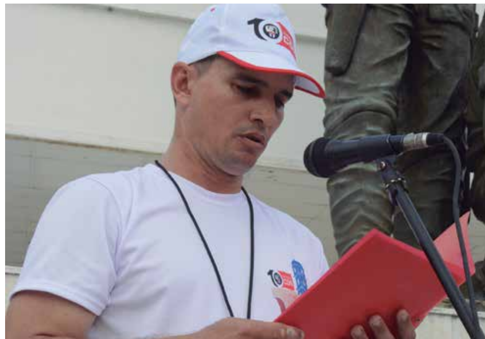
Yuniel ha sido dirigente de la organización por 10 años.

Así, entre convenios, proyectos de investigación y centenares de alumnos, transcurre el día a día de Sofía. Sus pasos repican en los largos pasillos de una de las más jóvenes universidades del país y la única que lleva el nombre del Apóstol. Quizás porque entiende el reto, ella se ha consagrado a un magisterio que importa más que la vida misma. Un magisterio de luz y sabiduría para los pinos nuevos.