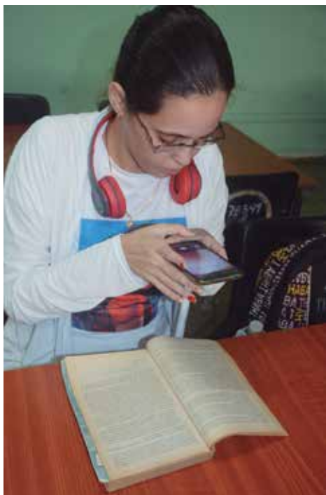
El uso de las nuevas tecnologías complementa los programas educativos.

No los defraudaré y esa confianza depositada en mí la aprovecharé para exponer ante el plenario cuánto me enorgullezco de ser parte de mi barrio y de ser un hijo más de la tierra de Serafín.