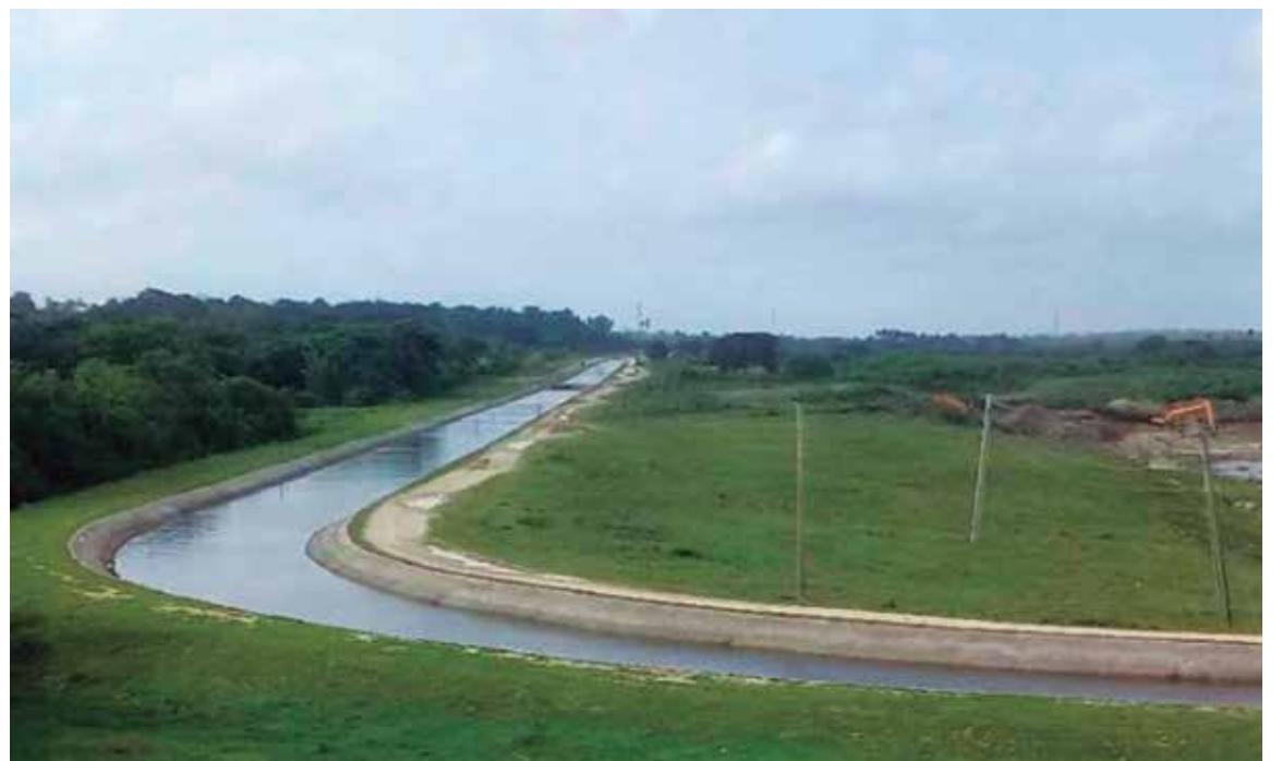
En la provincia se han llevado a cabo importantes obras hidráulicas en los últimos años.

Por su parte, en el Canal Magistral de la presa Zaza se trabaja en los puntos críticos para su cierre técnico, dentro de ellos se encuentra la obra de fábrica 91+80,