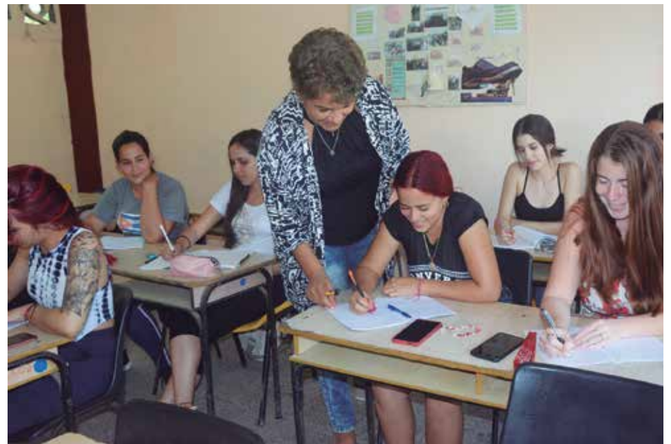
El claustro de la institución sobresale por su profesionalidad.

“Fue una etapa donde se ejecutaron tareas intensas y a la vez hermosas que estuvieron vinculadas, sobre todo, a los procesos de acreditación de programas de pregrado y posgrado de una institución que transitó por dos categorías superiores de acreditación durante ese período, lo cual fue un reto altísimo, pero también marcó un resultado importante que se ganó con