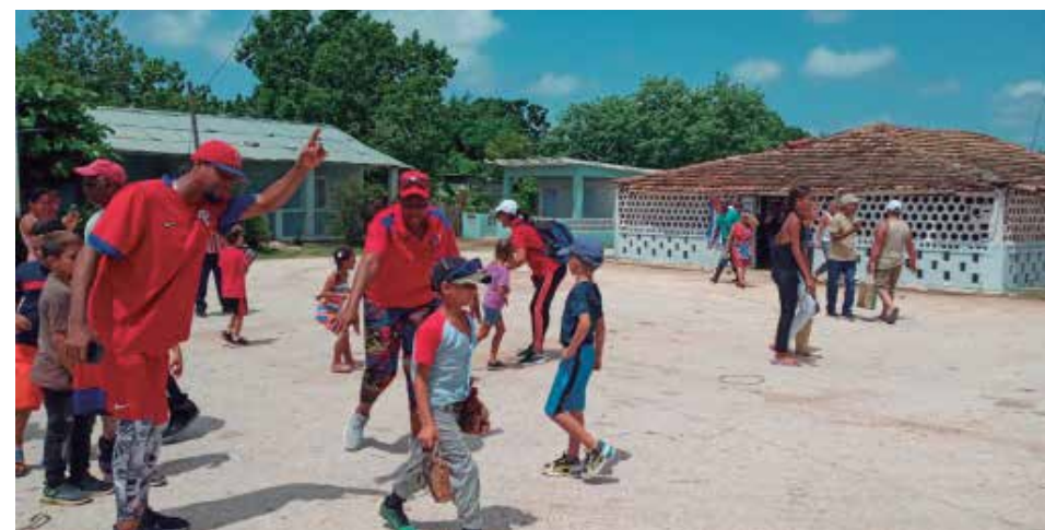
Actividades culturales y deportivas han llegado a esta comunidad trinitaria en transformación.

El trabajo colectivo y la dedicación del delegado aseguran el bienestar en esta localidad trinitaria, que tiene entre sus objetivos económicos los almacenes de la Oficina del Conservador de la Ciudad, la villa de alojamiento de la Construcción, la UBPC Frank País, dedicada a la producción de mango, y la CCS José Mendoza, cuyos campesinos se vinculan a la ganadería, lo que garantiza empleo e ingresos para los habitantes del poblado.