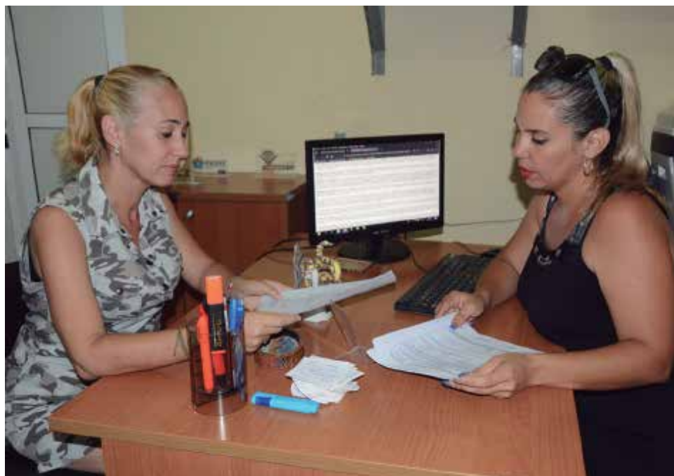
Especialistas aseguran que todavía no se puede hablar de una cultura digital porque hay mucho desconocimiento.

Es entonces cuando toca al portador del documento exigir que se reconozca la validez de esa firma digital que fue implementada y certificada por un organismo competente, de lo contrario, se viola lo establecido por el Decreto-Ley No. 370 sobre la Informatización de la Sociedad.