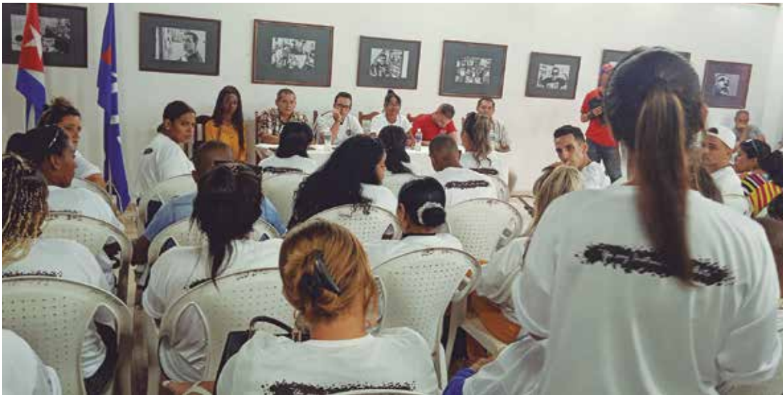
La cita abogó por el diálogo y el entendimiento.