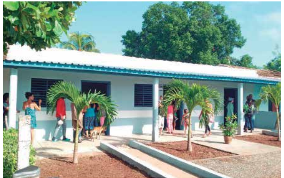
La bodega figura entre los centros remodelados, con más amplitud y confort.

“El techo estaba es muy mal estado, con una parte hundida y el local era pequeño. Ahora todo está más amplio, con un área de venta para los mandados, otra para productos de la agricultura y la del combustible, además del almacén. Esto vino como anillo