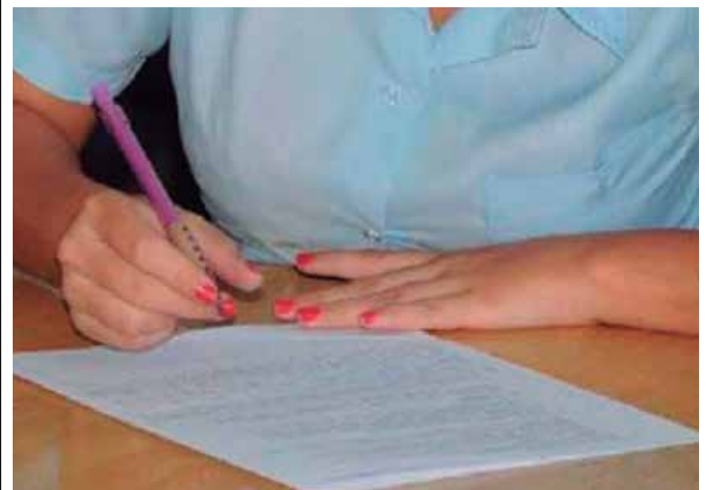
El proceso comenzará el próximo martes en todo el país.

Para los alumnos que por causas muy bien justificadas no puedan presentarse a estas pruebas, está prevista una segunda convocatoria los días 20, 22 y 24 de noviembre.