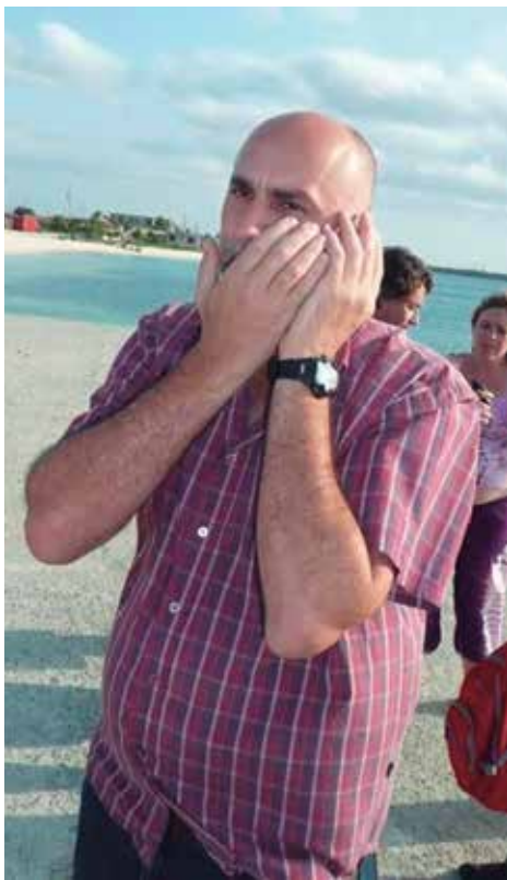
La inmediatez y la pasión por el periodismo siempre estuvieron en su orden del día.