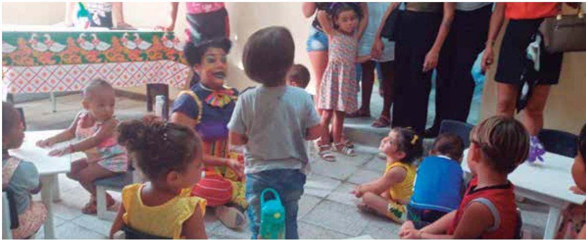
Pequeñines del Turismo es la primera casita que ese sector pone a disposición de las madres trabajadoras.