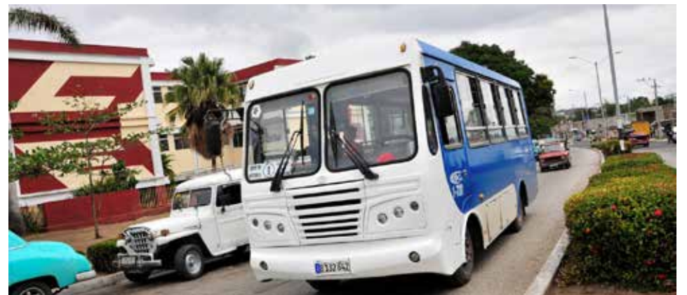
En el transporte urbano de la cabecera provincial disminuye la frecuencia de viajes.

otros territorios del país— y la transportación de profesores hacia otros centros educativos se han ido suspendiendo ante la menor disponibilidad de combustible con que está trabajando la empresa”, expresó el directivo de Transporte.