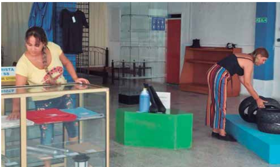
Entre las opciones que ofrece el establecimiento situado en Garaita está la venta de insumos de forma minorista a la población.