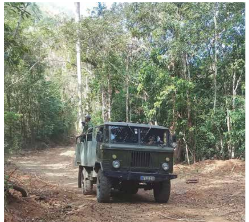
La recuperación de caminos facilita el acceso a zonas de la premontaña que están certificadas para la producción de miel orgánica.

El directivo expuso que, dada la alta exigencia técnica que requiere la colmena, existe un menor rendimiento en la miel ecológica con respecto a la convencional. “Se identifican otros probables escenarios para esta producción como Lomas de Banao, en Sancti Spíritus, zona que tiene cierta certificación; también la Sierra de Bamburanao, en Yaguajay, reúne posibilidades para este tipo de miel, muy demandada y con un valor en el mercado que triplica el de la convencional”, declaró la fuente.