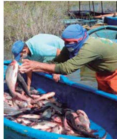
El ejercicio productivo Bastión Pesquero se desarrolla para extraer la mayor cantidad de peces del embalse Zaza.

“Este año iniciamos la repoblación de los embalses por el municipio de Jatibonico —aclaró Miriam—, donde existían presas como La Felicidad, que desde el 2017 no