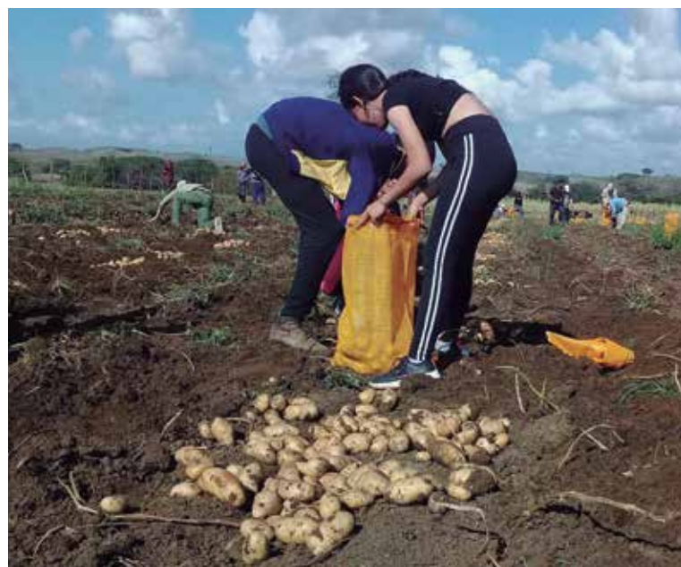
La pasada cosecha se distinguió por el buen rendimiento agrícola.