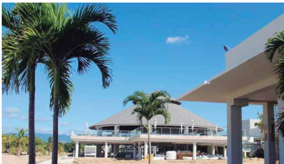
Este hotel funcionará con categoría Cinco Estrellas.