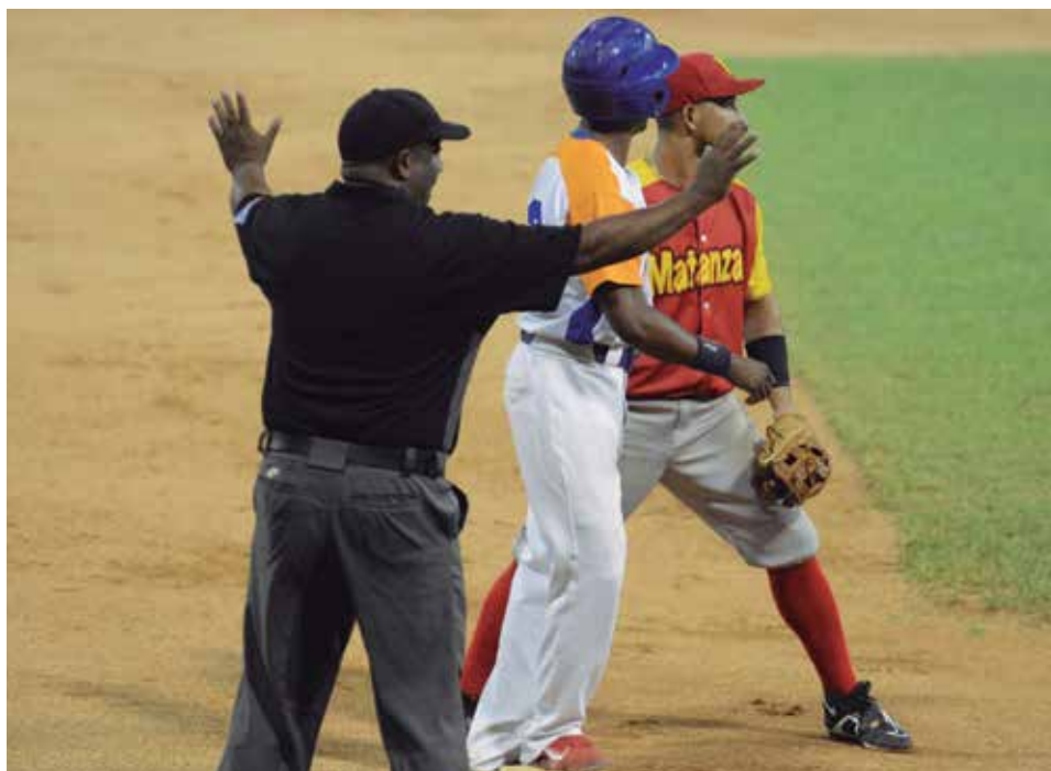
Hasta ahora, la Liga Élite ha brindado un ameno espectáculo.