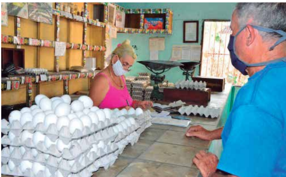
En los próximos días se efectuará la última distribución de huevos del año.