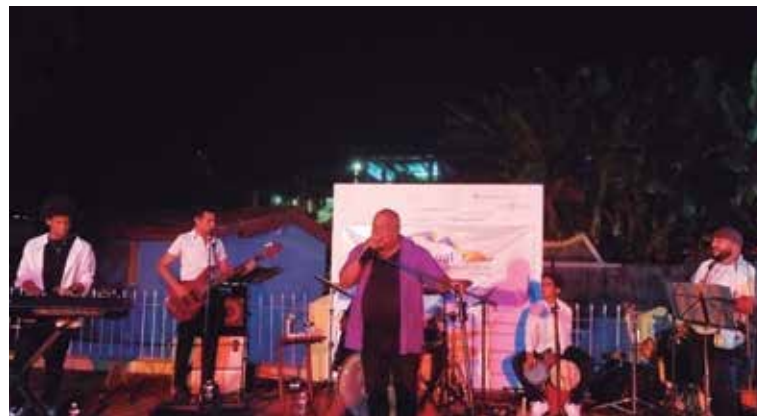
Concierto con su orquesta en la Casa de la Guayabera.

He venido varias veces a esta tierra, a cantar o no, y es una ciudad que adoro, la cual también me ha acogido con mucho cariño. A todos los espirituanos les deseo mucha salud ante todo, al igual que una gran bendición y que mantengan esta bella ciudad siempre limpia. En resumen, que se haga la dicha para que yo pueda disfrutar de ustedes al igual que ustedes de mí.