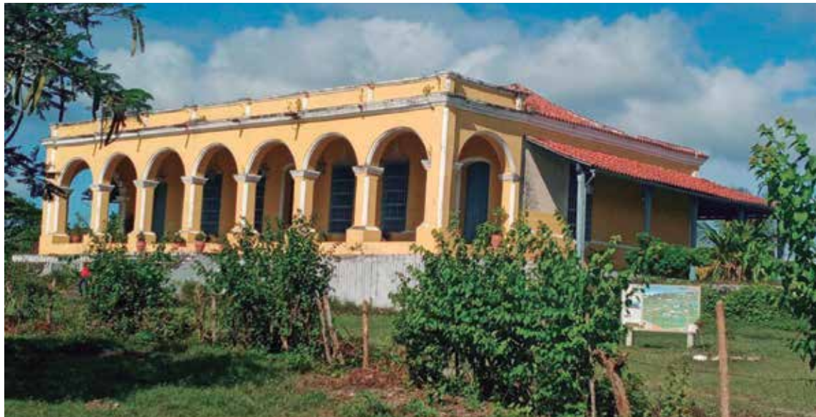
Sobre una pequeña colina se levanta la casa hacienda Guáimaro, una de las más fascinantes en el Valle de los Ingenios.

"Los cuadros representan escenas bucólicas, pastoriles, de ruinosos castillos o reproducciones de conjuntos arquitectónicos neoclásicos y los característicos saucos que se aprecian en las pinturas románticas de esa etapa", ilustra Carmen siempre con un tono de emoción en sus palabras.