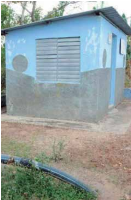
La estación de bombeo es una de las que en la provincia cambiaron su matriz energética.

Dicho proyecto se inició en febrero de este año e incluye a decenas de equipos de bombeo para agua potable, cuyos consumos