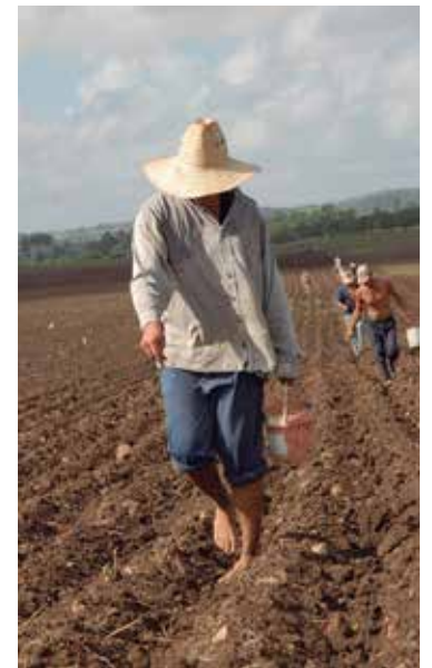
En Yaguajay se concentra buena parte de la siembra de frijol de la campaña.

De acuerdo con la fuente, a finales de octubre la contratación de semilla ronda los 2 000 quintales e involucra a unos 30 productores en varios municipios, con destaque para Yaguajay, el tradicional granero de la provincia. (J. C. A.)