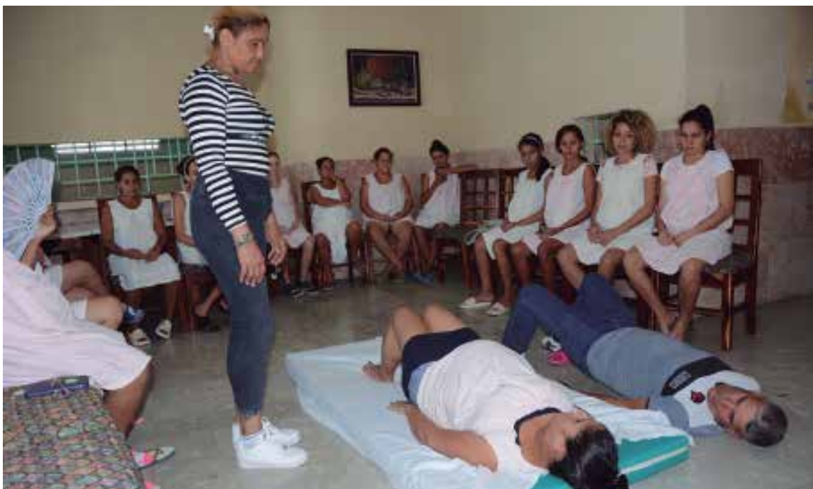
La psicoprofilaxis comprende la realización de ejercicios obstétricos, de relajación y de manejo de la respiración en la gestante.