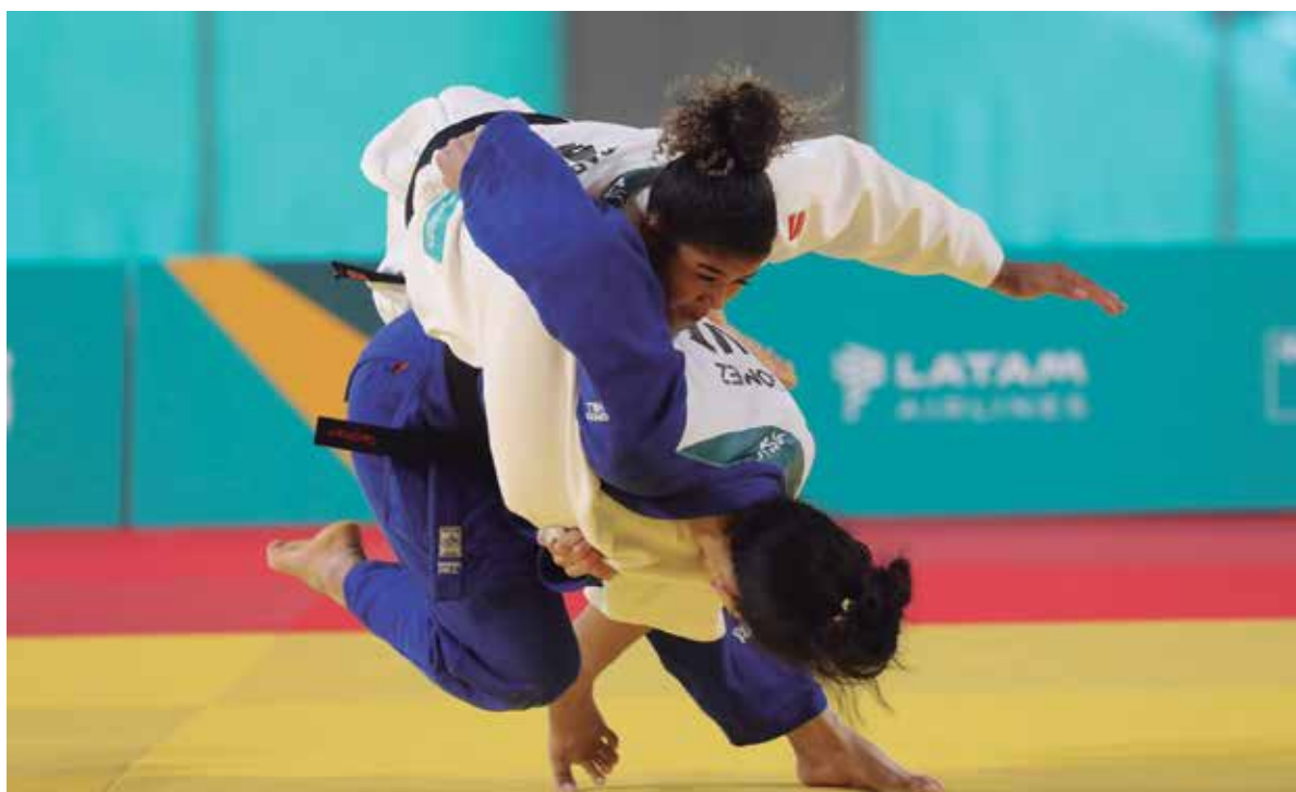
El judo fue el nuevo buque insignia de la delegación cubana.