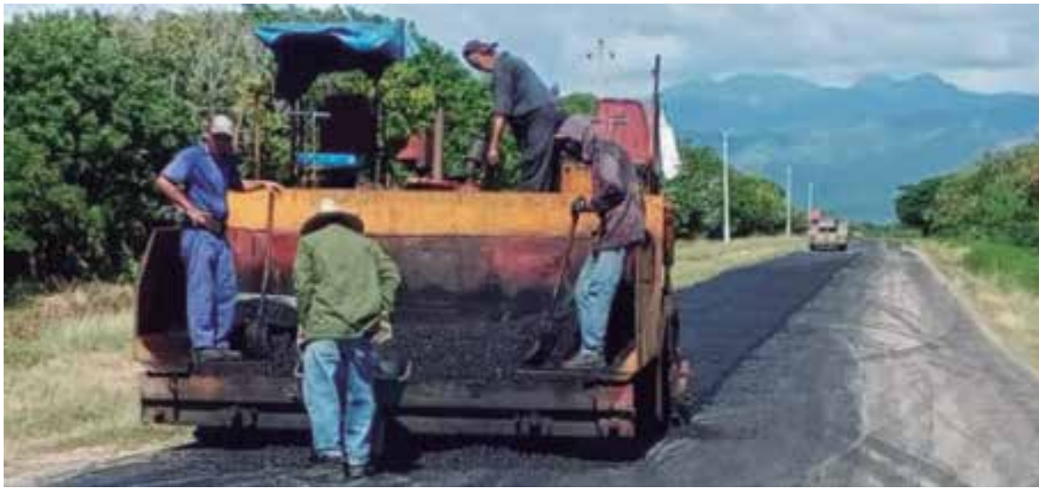
En los primeros días se vertieron más de 1 000 toneladas de asfalto.