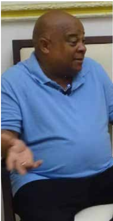
“Sancti Spiritus es una ciudad que adoro”, dice el artista.