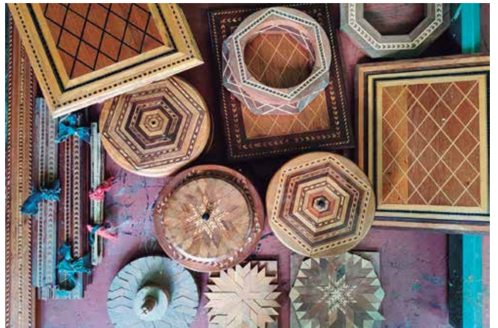
En la mesa aún tiene humidores sin terminar.

No, hombre, no. En el taller soy feliz. Si no trabajo me muero.