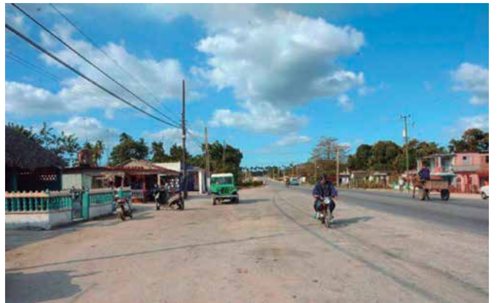
Más de 200 habitantes de la comunidad de La Aurora permanecen sin el servicio de agua potable, a pesar de existir un miniacueducto desde el año 2000.