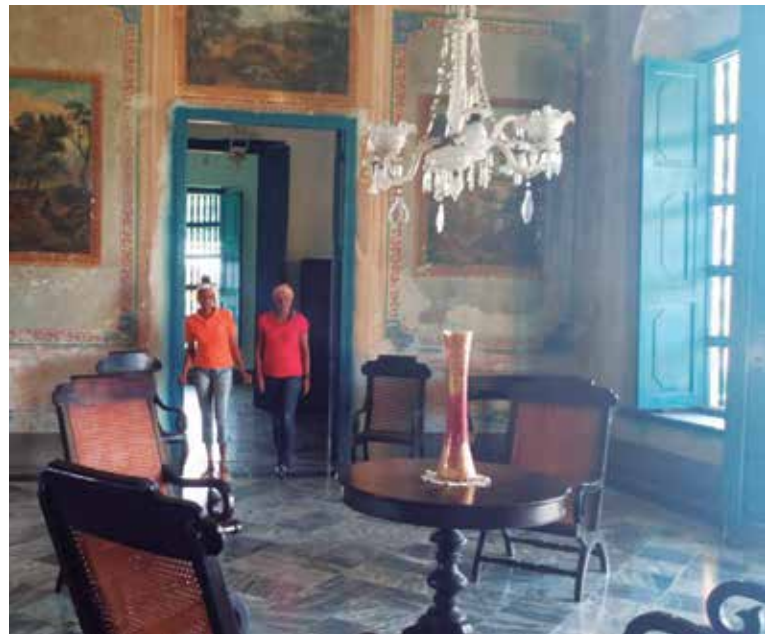
Ambas expositoras conocen los detalles de la historia del ingenio y de su propietario.