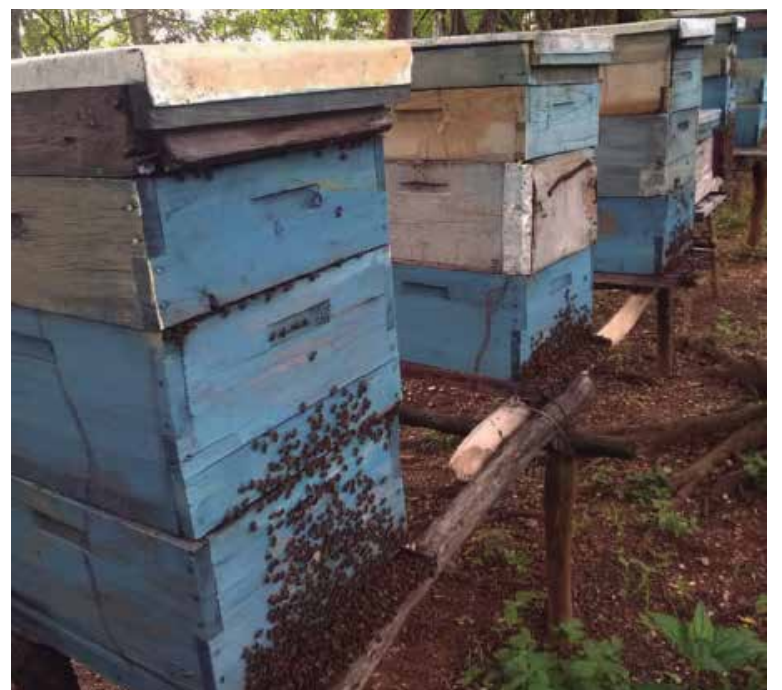
La provincia tiene colmenas fuertes y sanas.

Ante la imposibilidad material para crecer en el parque y las dotaciones, la Apicultura espirituanista está obligada a buscar mayor rendimiento por colmena.