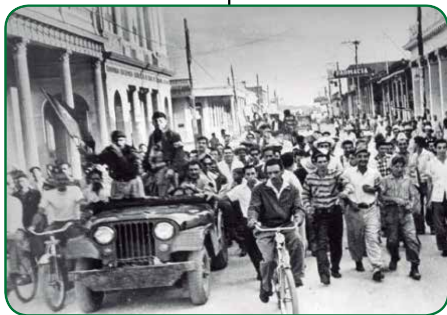
Liberación de Cabaiguán. El pueblo celebra en las calles. Infografía: Enrique Ojito y Yamilet Trelles