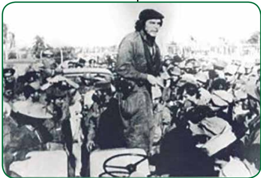
Fomento festejó junto al Che aquella tarde del 18 de diciembre de 1958