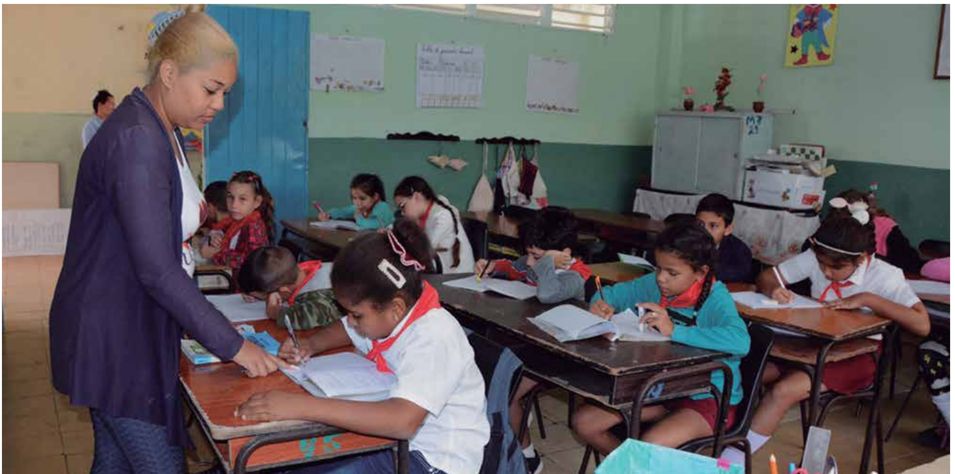
Jóvenes maestros prosiguen el legado de sus antecesores en las aulas.