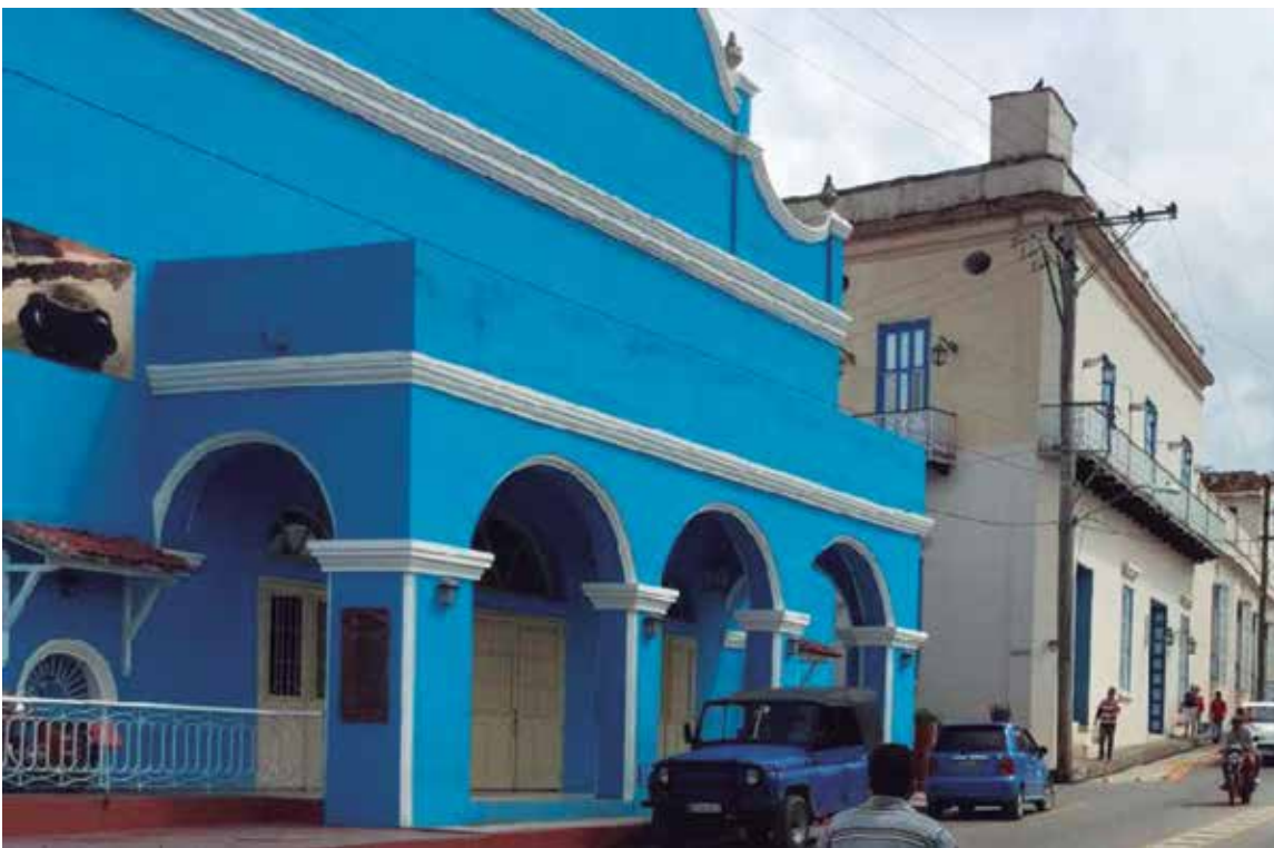
En el interior de la institución, el lunetario también presenta serios problemas.