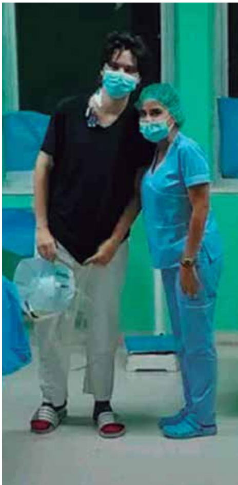
El joven trasplantado, en compañía de una de las enfermeras del hospital Hermanos Ameijeiras.

Día 5: “Ayer le pedí a una enfermera que le hiciera cosquillas en la cabeza. Las cosquillas de mamá lo curan todo, la fiebre, el dolor, los calambres. Envidio las manos que lo hacen por mí”.