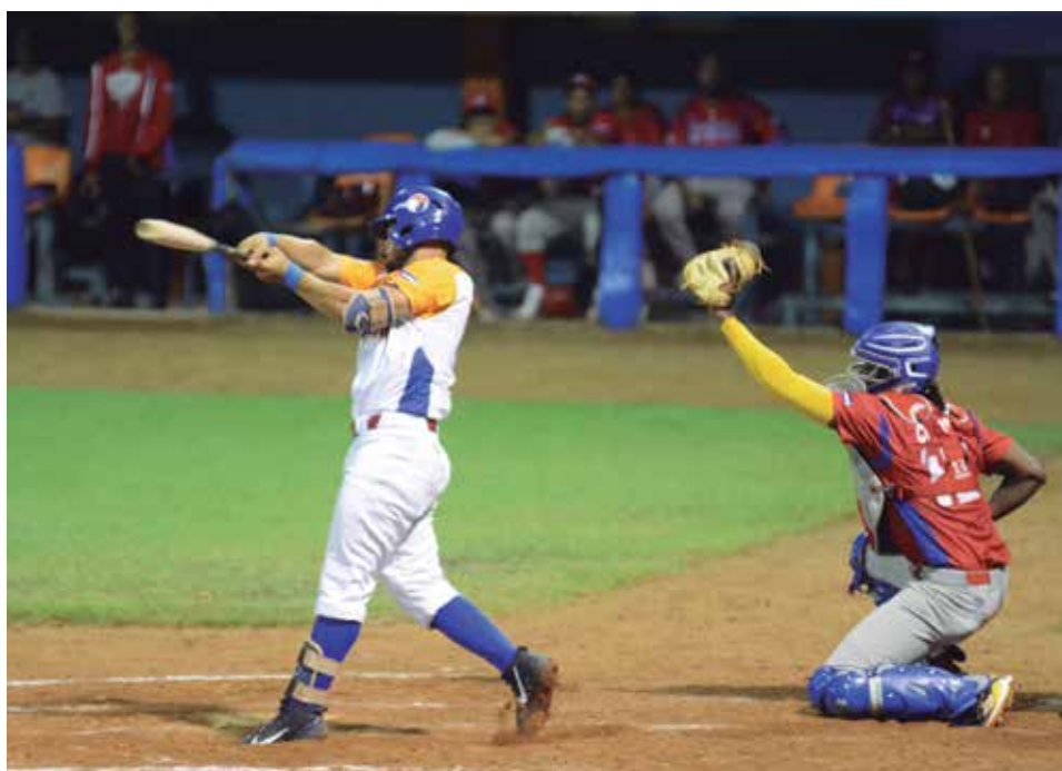
El equipo tendrá que apelar a todas sus armas.