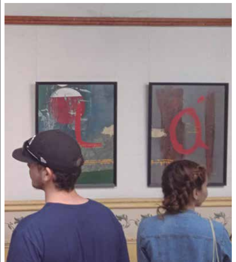
Cinco piezas que forman la palabra Ojalá integran la exposición personal.

“No es la primera vez que inauguro en ese lugar. La dirección de Islazul ha estado siempre dispuesta al apoyo e, incluso, recientemente hicimos una exposición colectiva por el cumpleaños del Taller de Artes Gráficas. Esos espacios alternativos, para llamarlos de alguna manera, son muy saludables para la promoción del arte”. (L. G. G.)