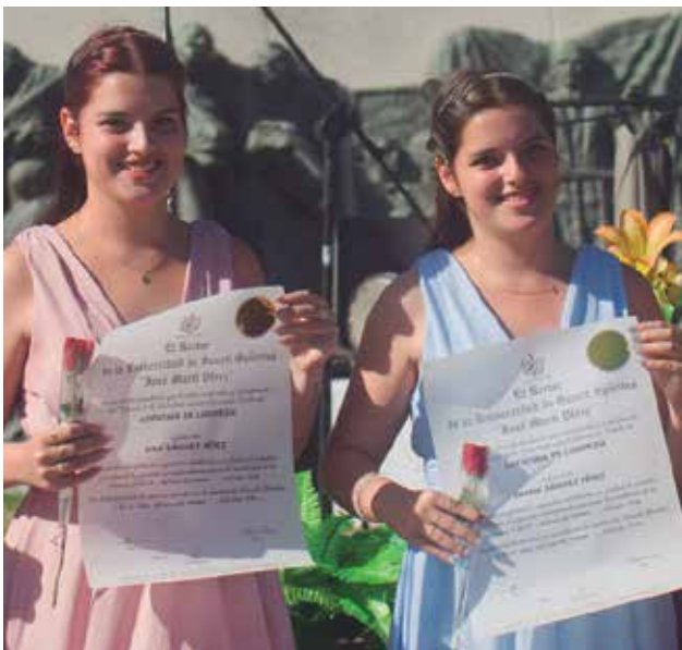
En el acto, 85 estudiantes fueron reconocidos con el Título de Oro por su excelencia docente.

“Lo cierto es —aclaró el director— que mientras existen empresas del país con deudas en la distribución de varios meses, debido a la disminución en la entrega de la masa ganadera, algo que también afecta a este territorio, y aunque la demanda es superior a la oferta, el Cárnico de Sancti Spíritus cumplió este año con lo dispuesto para la canasta familiar normada, las dietas médicas, la carne para niños, la merienda escolar y los productos pactados para otros programas. En el 2024 esperamos tener mejores posibilidades porque estamos haciendo contrataciones con ese fin”.