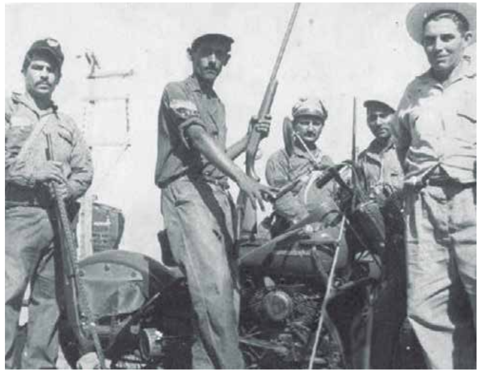
Milicianos rebeldes durante la liberación de la villa del Yayabo.

una anécdota, reiteradas veces, el propio Armando Acosta. En Placetas, el Che, que no conocía las dimensiones de la ciudad, se enteró por el propio Acosta de la toma de Sancti Spíritus y le pregunta: