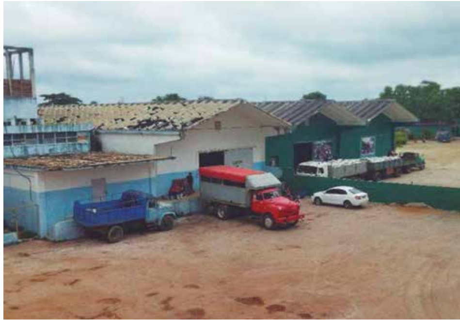
Seis individuos están siendo procesados por el robo con fuerza en el frigorífico de Sancti Spíritus.

De acuerdo con la Jefatura del Órgano de Investigación Criminal de la provincia, se