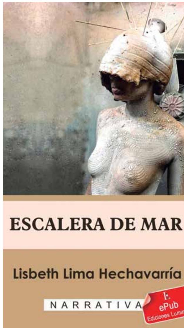
El libro, premio Casatintas 2021, es uno de los ebooks que bajo el sello de Luminaria se colocó en la tienda virtual Superfácil.

Realmente, mucho le queda por andar a Ediciones Luminaria, sobre todo si desea mantener las publicaciones en papel, aunque sea en tiradas simbólicas para utilizar en las presentaciones de los libros y servir de atractivo para el comercio digital. También le corresponderá despegar en los caminos de promoción para que los textos —cada vez con mayor calidad tanto en contenidos como imagen— tengan mayores demandas y puedan así autosustentarse. El anhelo de contar con una página web y hacer funcional el perfil de YouTube, con apenas cuatro suscriptores, pudieran ser dos de los primeros pasos en ese sentido para seguir dándole vida a un sueño que ya es realidad.