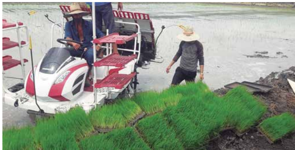
La labor de varios centros premiados tributa a la producción de alimentos.

A pesar de la falta de combustible y recursos, la EES mantuvo un trabajo estable y obtuvimos resultados como la certificación del control interno y de los estados financieros; tampoco tuvimos que lamentar la ocurrencia de accidentes mortales y la mayoría de los indicadores que miden la calidad de nuestro trabajo fueron positivos.