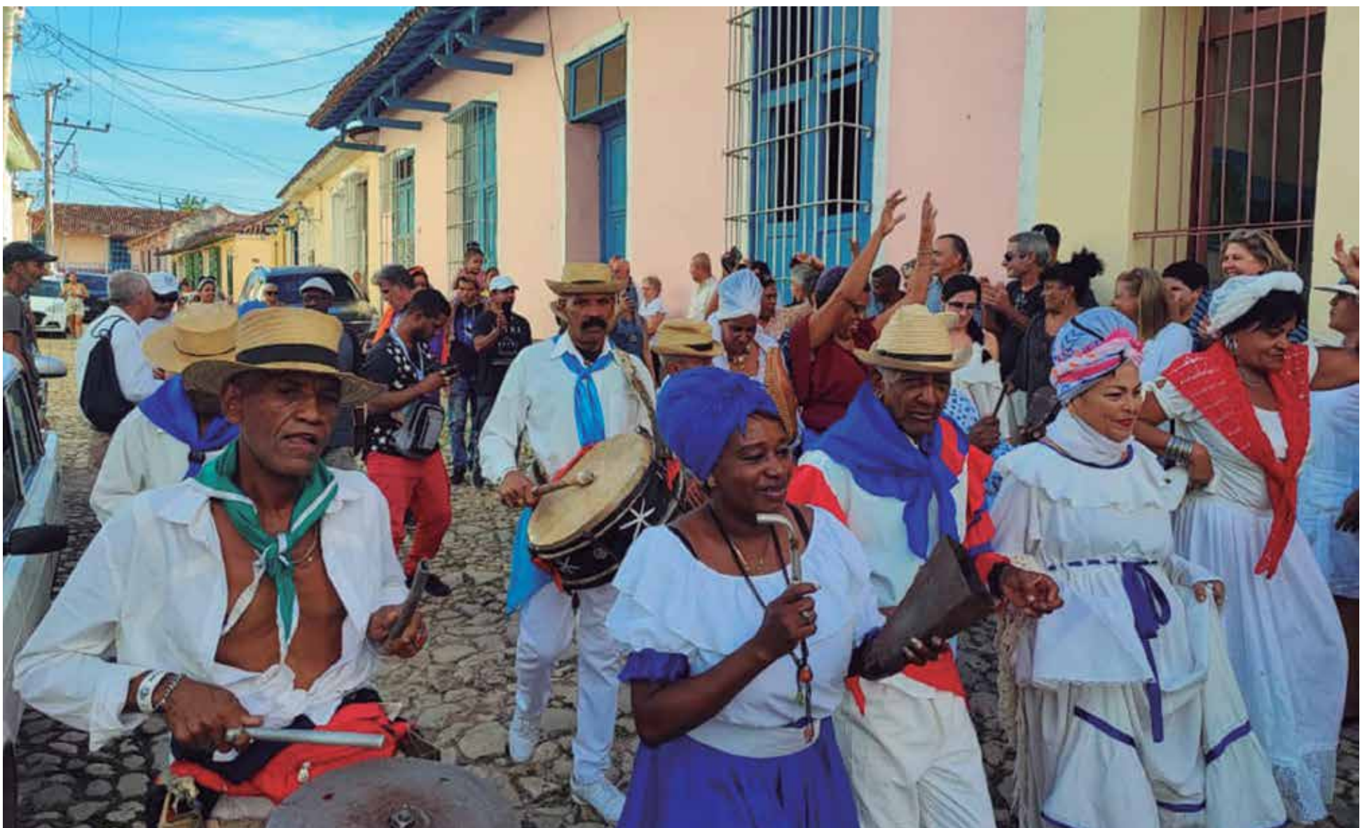
Los festejos trinitarios constituyen una muestra de acendrada identidad.