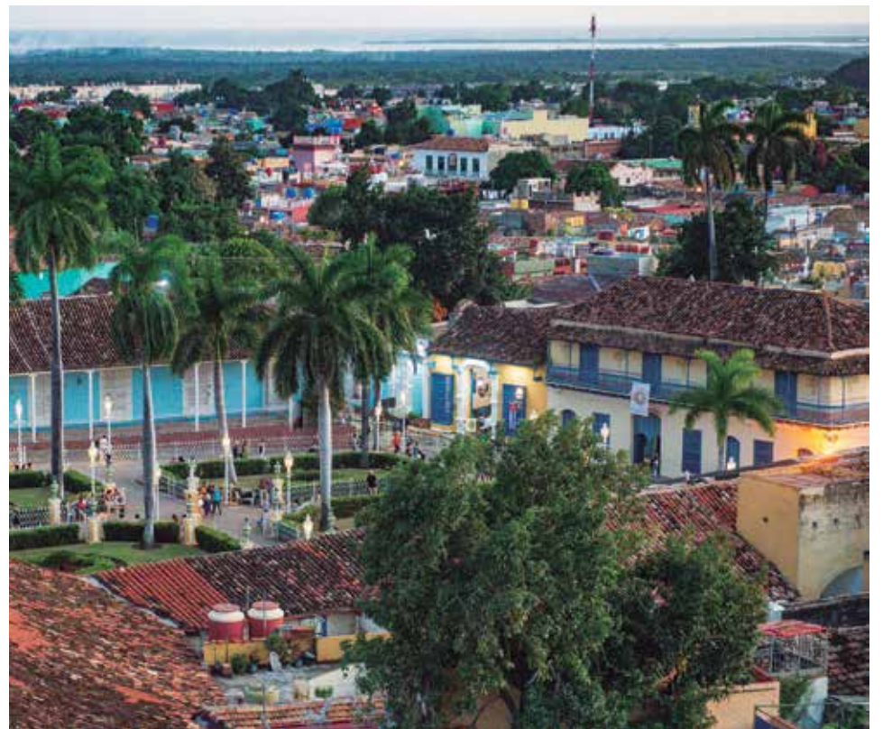
El segundo domingo de enero se celebra la fundación de la villa.

Bajo esa premisa —expone Tania Gutiérrez