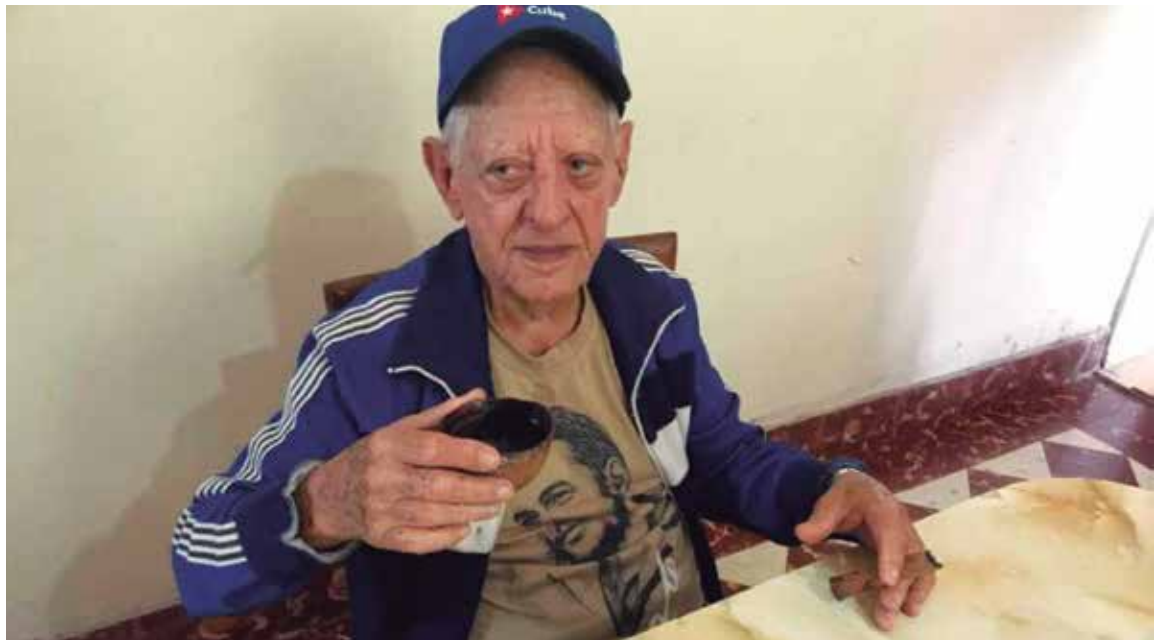
Su hoja de servicios en las instituciones armadas recoge misiones de trabajo en Vietnam, Yemen del Sur, Nicaragua, Guinea Bissau y Etiopía.

“El presidente del centro creativo me dijo que ya estaban vendidas las reservaciones y le era imposible suspender la festividad; acepté y le expresé que, al día siguiente, no debía hacerse el bailable que tradicionalmente se