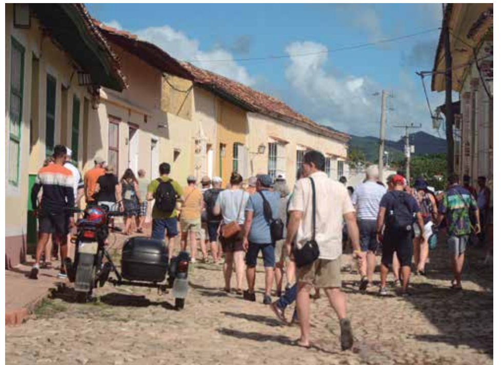
Turistas de medio mundo recorren a diario las calles empedradas de la ciudad.