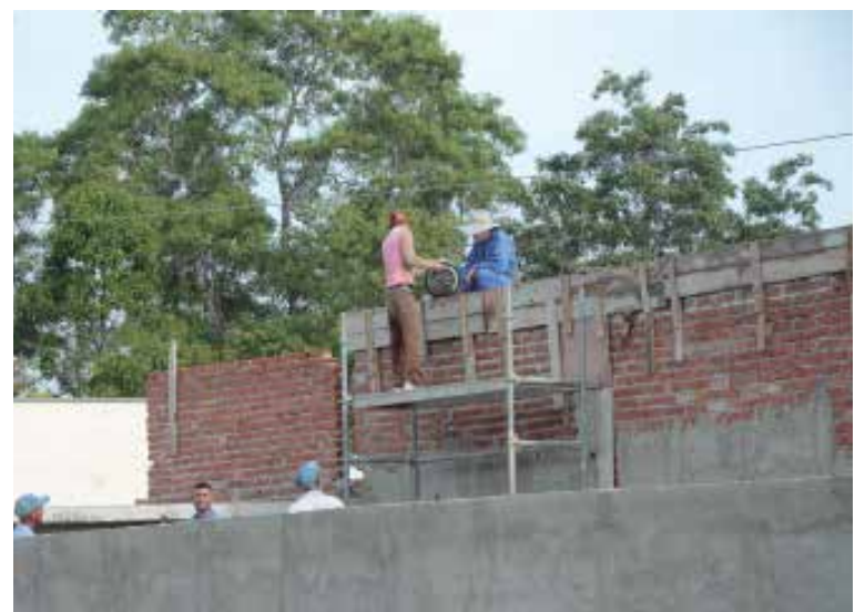
La iniciativa surgió con el propósito de revitalizar la zona, incluido el túnel peatonal.

Pero el proyecto, como aclara el directivo, no solo incluye el rescate del túnel peatonal, sino que en las áreas posteriores de este espacio también se construye un estacionamiento para los autos del Banco de Sangre y para los de Etecsa y un estacionamiento para motos,