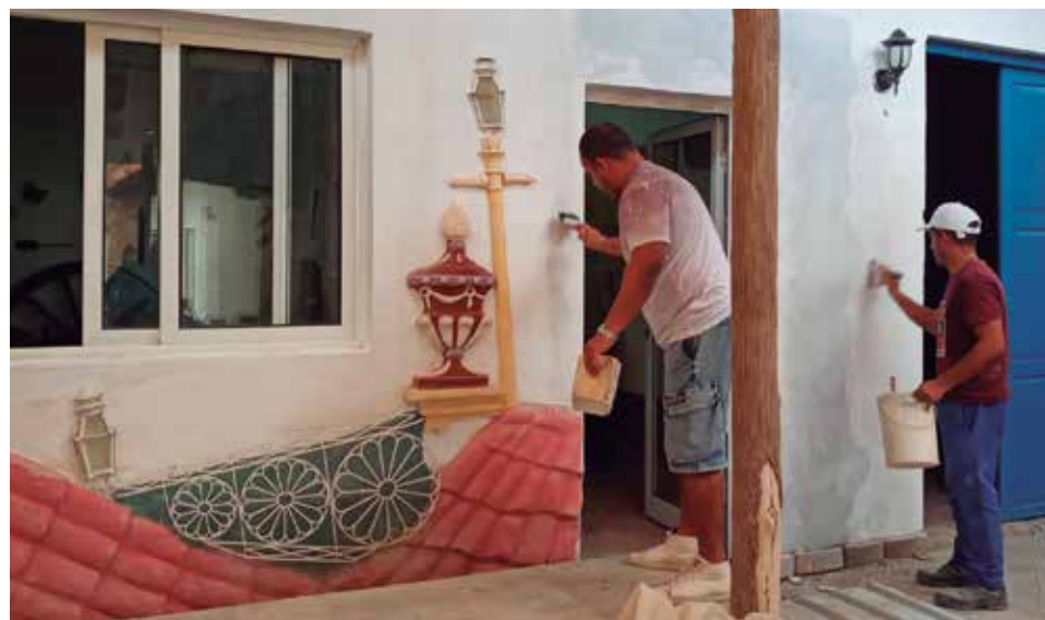
Varias de las instituciones restauradas reciben los toques finales.

reza Fontanills, presidenta de la Asamblea Municipal del Poder Popular— el programa de transformación de barrios y comunidades en situación de vulnerabilidad recibió el año recién finalizado más de 18 820 000 pesos, a lo que se sumó otro monto procedente de la contribución territorial.