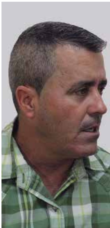
En Sancti Spiritus cerca de 3 000 consumidores sobrepasan los 500 kWh, apunta el director de la Empresa Eléctrica.

“Desde el punto de vista médico y científico tratamos de que esto no suceda, y hacia ello está encaminado todo el programa de rehabilitación e intervención, extendido hasta el cuidador y el familiar”, añadió la especialista.