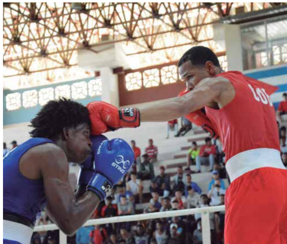
Jóvenes talentos y consagrados han medido sus puños en esta edición del Playa Girón.

que el futuro está garantizado, tuvimos que hacer una renovación muy grande en el primer evento de 2023, que fue el campeonato mundial: de 13 hombres, para siete. Era la primera vez que participaban en un torneo internacional y de ellos, tres lograron plata y uno, bronce. Muy pocos países tuvieron ese saldo con atletas de 19, 20 y 21 años; quedamos en tercer lugar y estamos acostumbrados a que el boxeo cubano sea el primer lugar en todos los eventos del mundo”.