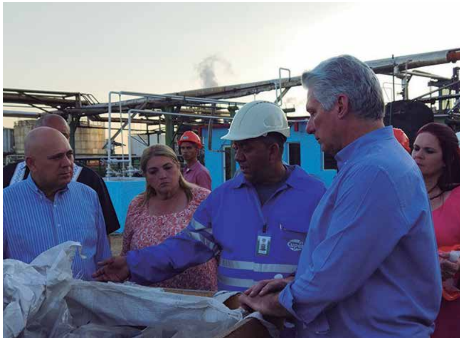
En la Refinería Sergio Soto, el mandatario reconoció las proyecciones de incrementar los renglones exportables.

Más adelante, en diálogo con los trabajadores, el Primer Secretario del Comité Central del Partido confirmó el espíritu de laboriosidad y consagración que se respira