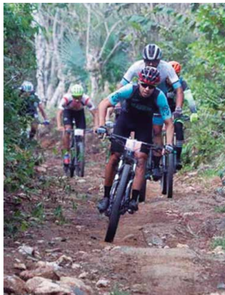
El evento contempla esta vez cuatro etapas con recorrido de unos 200 kilómetros.