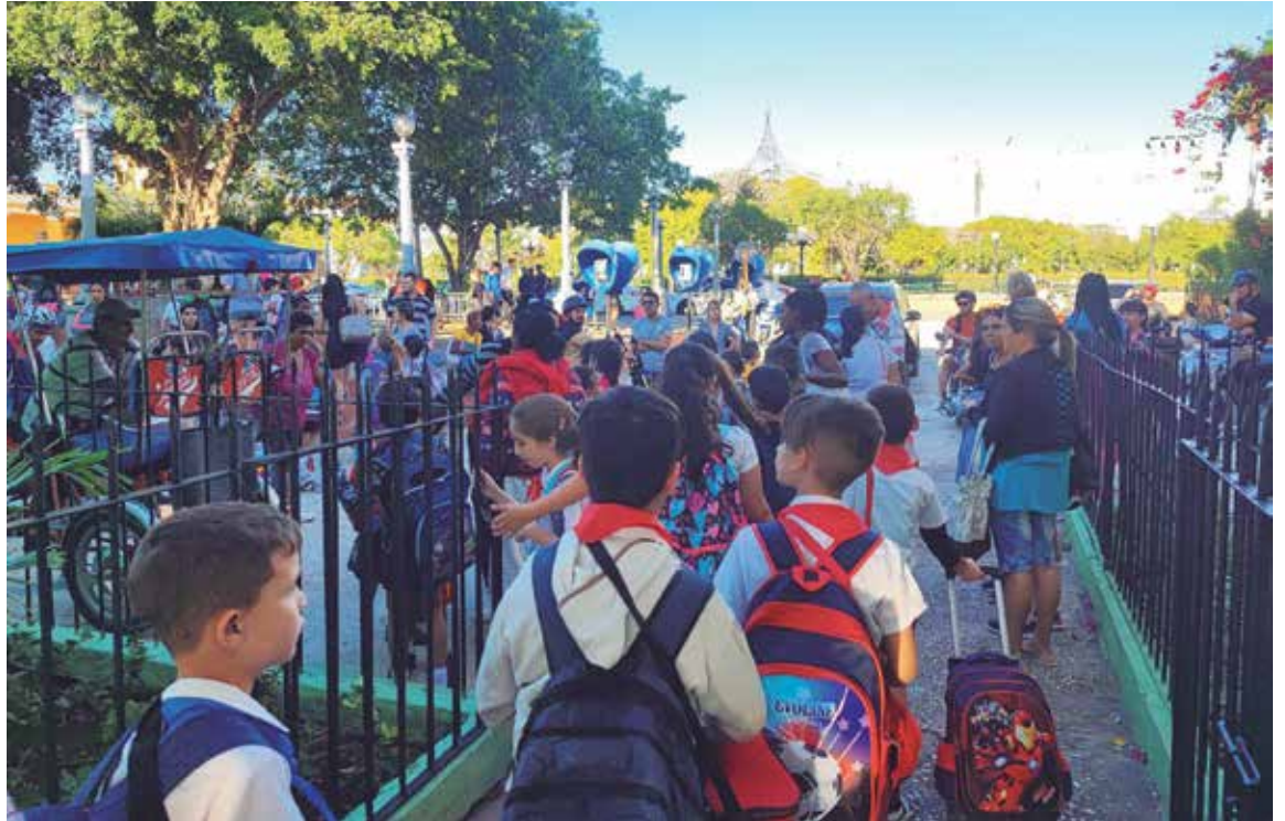
Asistir diariamente a la escuela y de forma puntual es el primer deber de todo estudiante.

Si bien existen factores que transversalizan este problema, como las dificultades con el transporte o experiencias puntuales que ciertamente pueden demorar la llegada de los menores a la institución, diversas opiniones advierten otros matices.