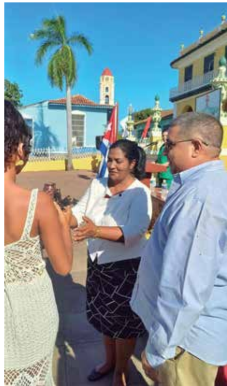
El Premio Único de las Artes fue conferido en ocasión del aniversario 510 de Trinidad.

“Me conquistó porque es una urbe mágica. Lo dijo Carpentier: es la ciudad de las columnas, de los portales... Es la ciudad de la cultura en cualquier momento, etapa mejor o peor. Además, te confieso que añoro el mar y eso de estar en una ciudad como Trinidad entre el mar y la montaña me gusta, pero es que en La Habana no solo ves el mar como nos pasa a los trinitarios, sino que lo hueles, lo sientes, lo tocas, lo padeces cuando estás caminando distraídamente por el malecón y una ola te moja. Me considero