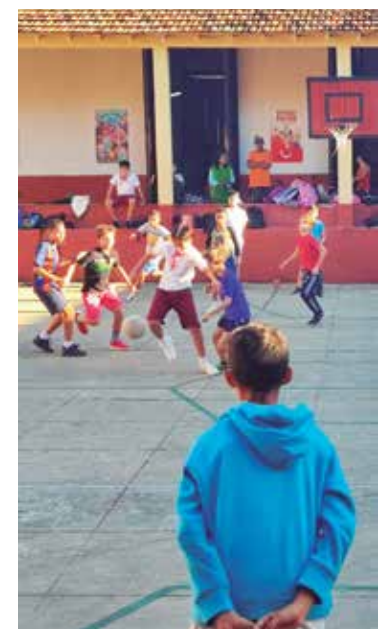
Son muchos los centros educativos que respetan el horario docente.

Docentes, padres y alumnos deben tener muy presente que estas pautas, establecidas en todos los niveles educativos, son preceptos ideados para fomentar el correcto desempeño del proceso de enseñanza-aprendizaje y deben cumplirse cabalmente.