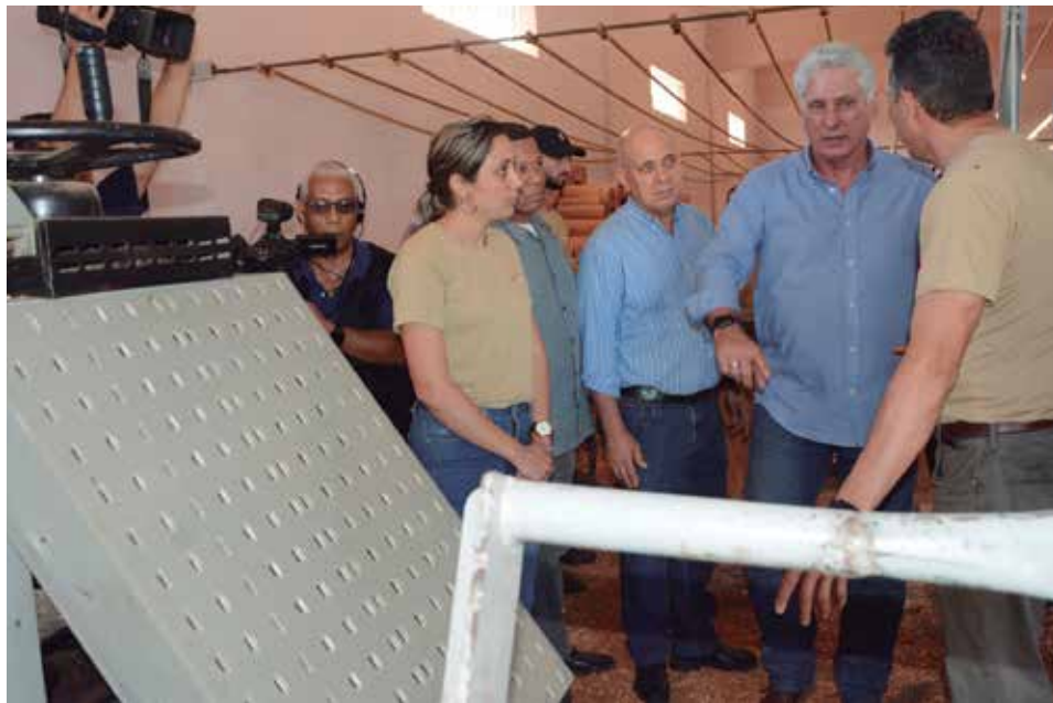
La mipyme Laminados Concepción se inserta en los proyectos de desarrollo local.