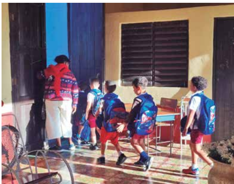
Existen algunos padres que apoyan y hasta justifican que sus hijos lleguen tarde a la escuela o no asistan en el horario de la tarde.