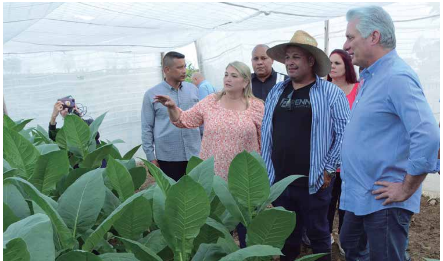
Díaz-Canel destacó los resultados del territorio en la producción tabacalera.

“Encontraron la manera de producir estos laminados, eso el país lo importa,