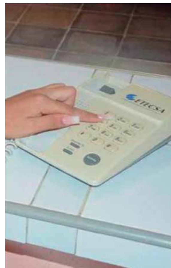
A inicios de año Etecsa ampliará los servicios de telefonía fija en la barriada de Colón.

Actualmente, el centro de telecomunicaciones de Sancti Spíritus cuenta con unos 80 trabajadores encargados de ejecutar la operación y el mantenimiento del sistema en el municipio, así como la atención comercial de los clientes en las diferentes unidades del territorio.