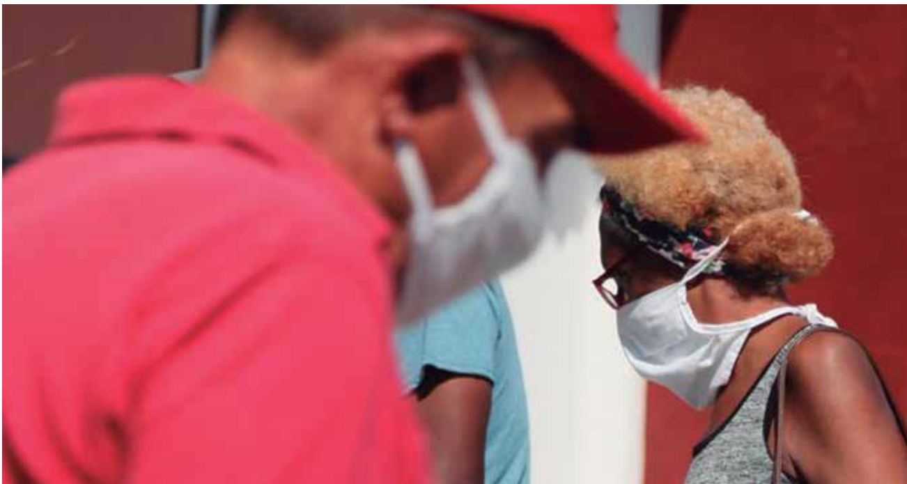
Muchos espirituanos han acudido al uso del nasobuco como medida preventiva.