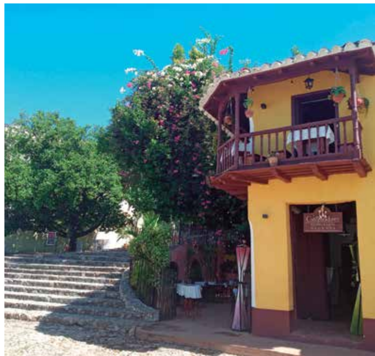
El estudio propone un moderno modelo de gestión del recurso forestal, lo cual constituye uno de sus más valiosos aciertos.

La propuesta investigativa aborda un tema de gran interés y evidencia la necesidad de integrar soluciones a favor de la gestión ambiental que permitan restituir el verde a la Ciudad Museo del Caribe.