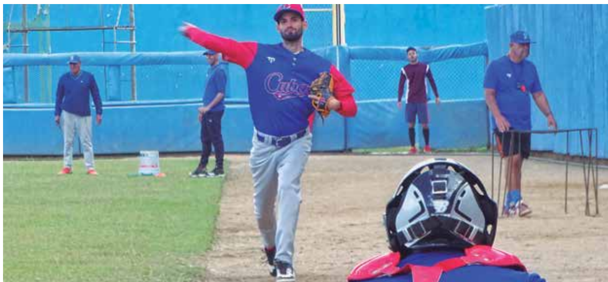
El conjunto ya arrancó la preparación de cara al clásico nacional.