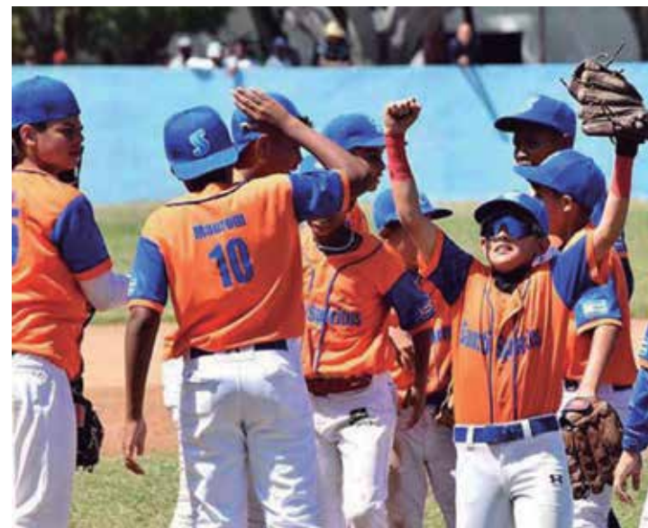
Los pequeños espirituanos, campeones de la zona oriental, llegan invictos a la final.

El triunfador deberá ganar dos de tres partidos (dos el sábado y uno el domingo). Así representará a Cuba en la Serie Mundial en Williamsport, Pensilvania, Estados Unidos, en agosto próximo. Por ahora algo más está en juego: el honor inigualable de estos niños gigantes. Pero de eso hablaremos después. (E. R. R.)