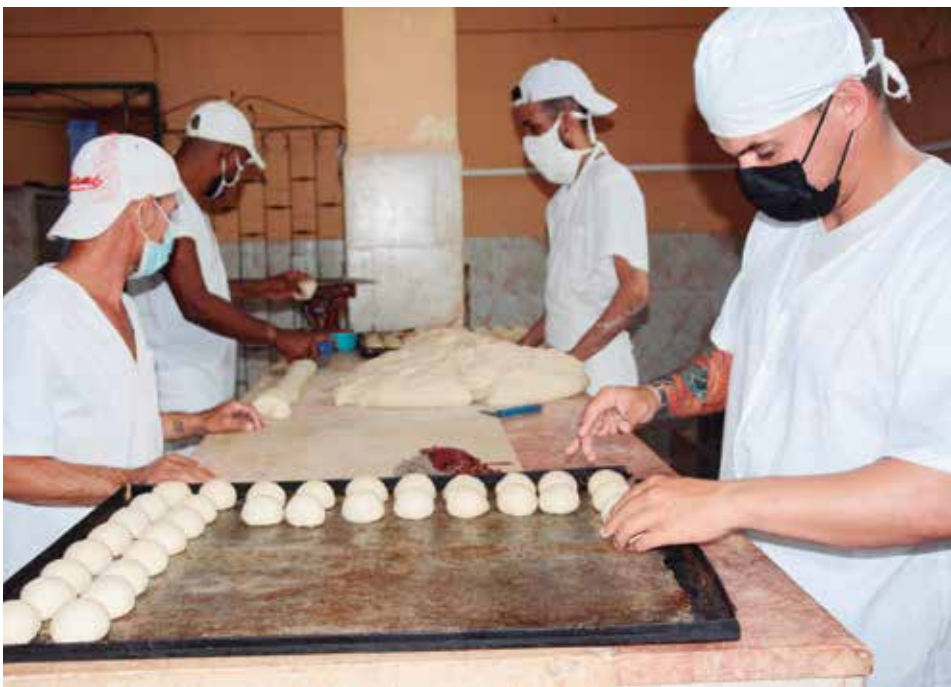
En el municipio de Sancti Spíritus se venderá pan normado los martes, jueves y sábados.