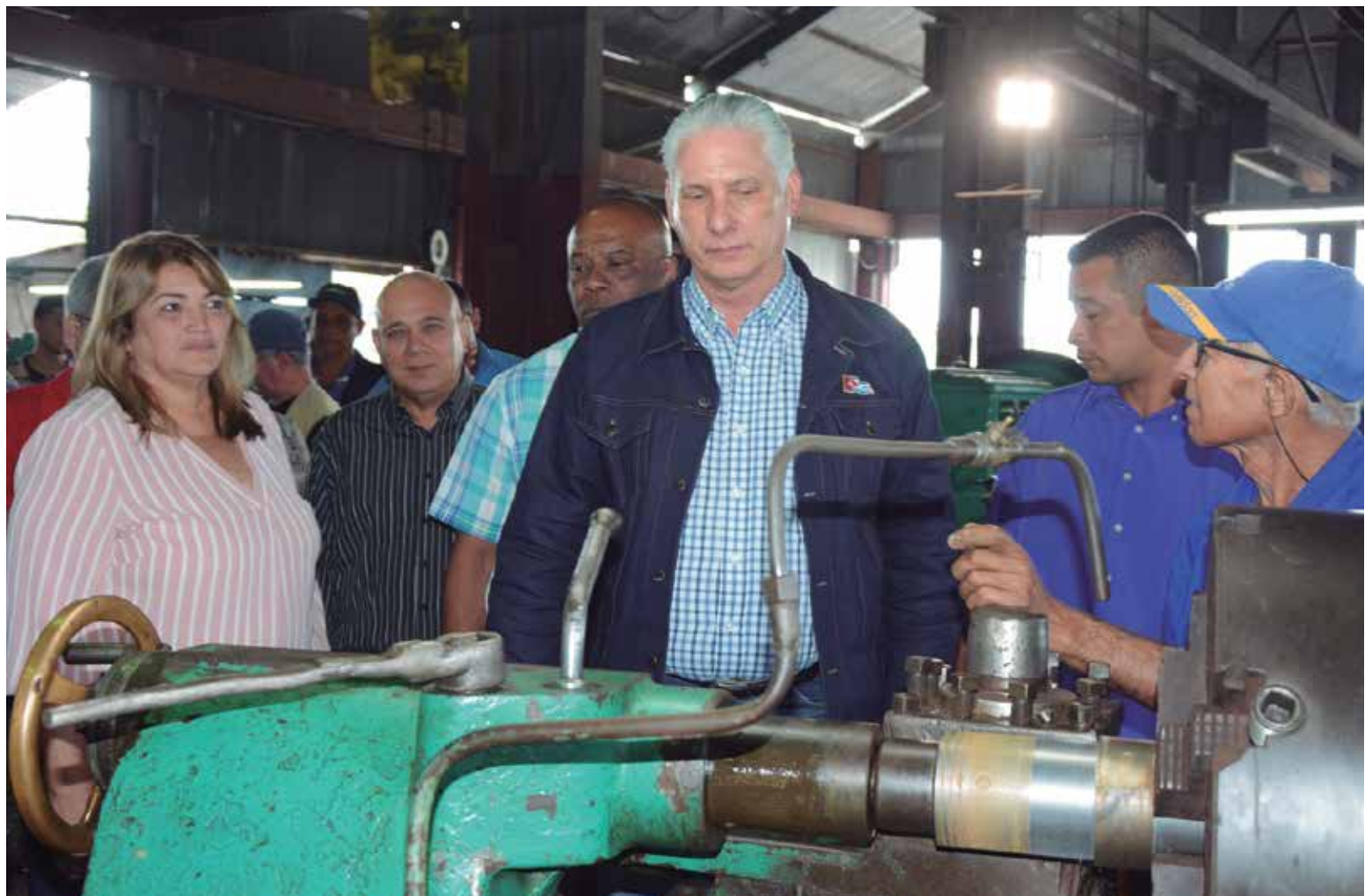
Díaz-Canel visita por segunda vez el central Uruguay en su condición de Presidente de la República.

Insistió en que en Jatibonico hay tierra suficiente para producir alimentos, impulsar los autoconsumos estatales y satisfacer las demandas de los comedores. “Los precios van a estar altos mientras