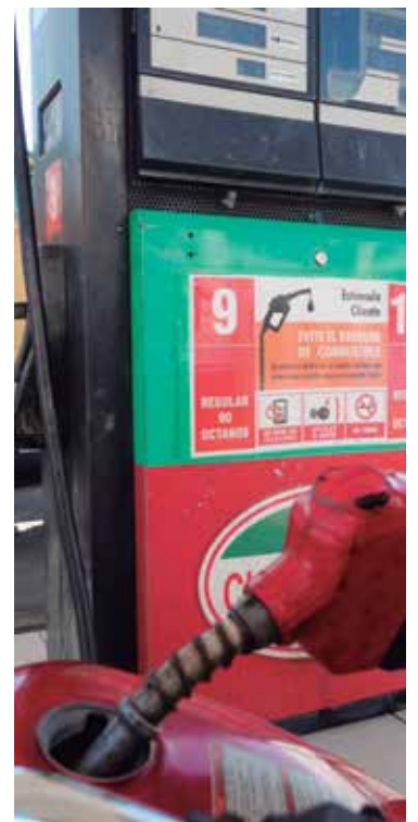
Por el momento, en la provincia solo se va a comercializar gasolina en divisas en dos servicentros.

En este grupo se incluye a quienes excedan los 500 kWh, que representan el 2.7 por ciento del total de los clientes del país; y la decisión de aumentar el 25 por ciento de su tarifa se ha argumentado con el fin de que disminuyan sus consumos y contribuyan al ahorro.