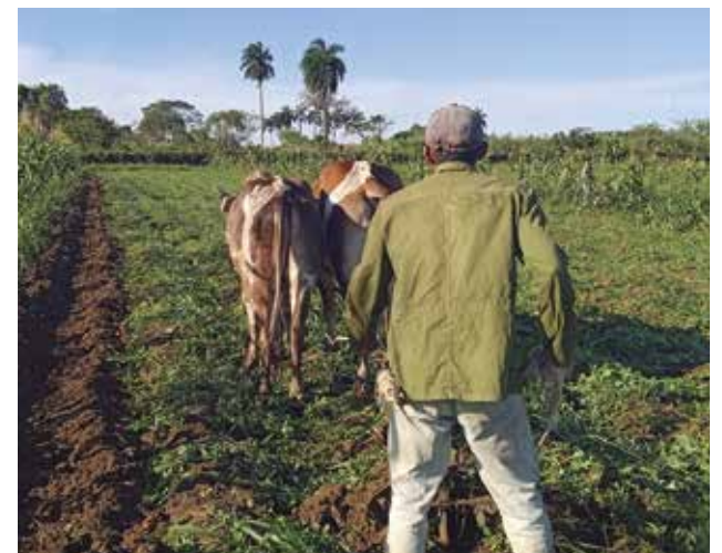
El ejercicio revisará el uso del suelo según el destino definido.

Adelantó López Cabello que el proceso contempla revisar las bases productivas estatales, cooperativas y propietarios individuales que tienen ganado. “No se mirará solo la cantidad de ganado que tiene un propietario contra el listado del registro pecuario, también incluye