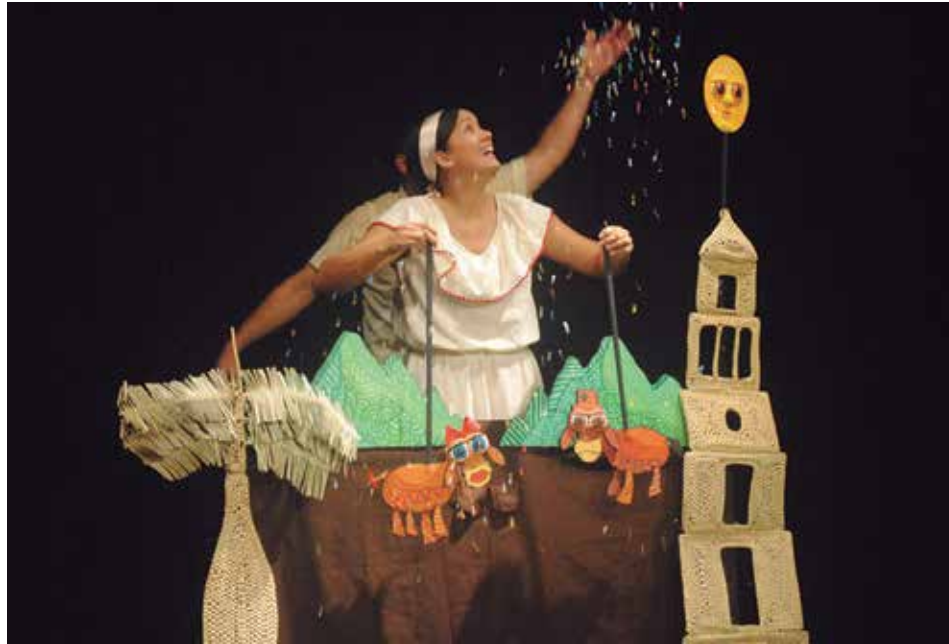
Dador Teatro sostiene producciones y sede con las arcas de sus integrantes.

“Nuestra suerte es que la familia nos apoya con elementos que tienen, pero ya ni de los escaparates se puede sacar cuando una muda de ropa puede costar casi 10 000 pesos. Además, para la sede jamás nos han dado un peso. La chapea del área verde, las tres luces, el tablet con que se reproduce la música y el mantenimiento del local corren por nuestra cuenta”.