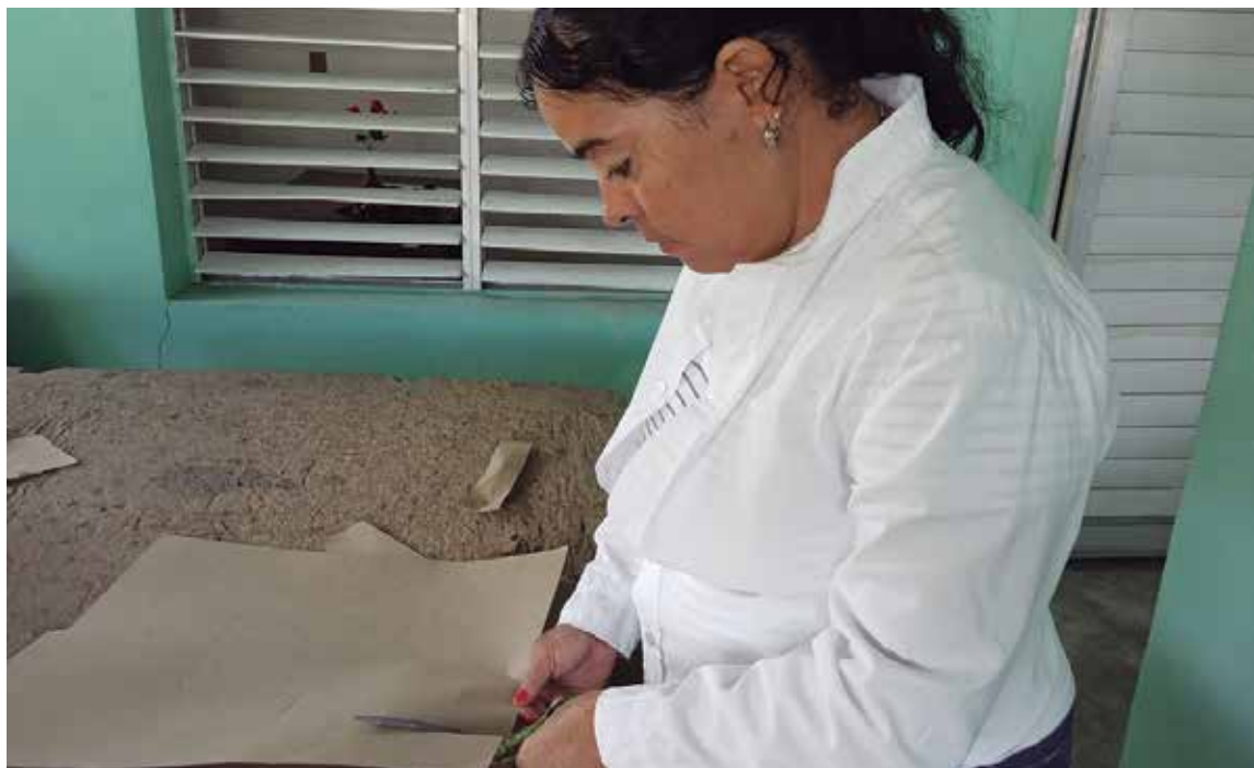
Personas con diferentes discapacidades se insertan en labores donde se sienten útiles a la sociedad.