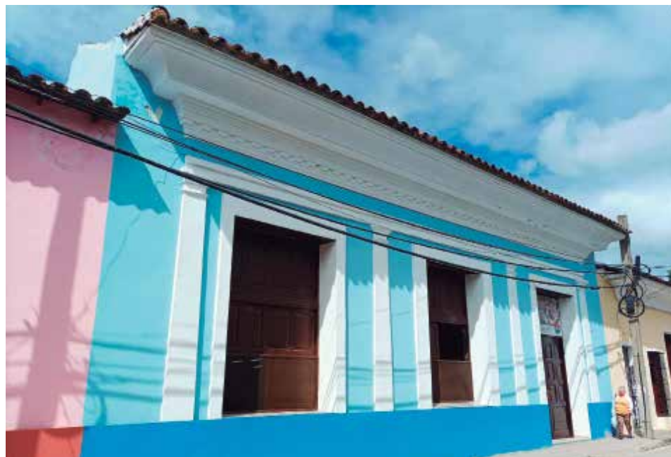
Algunas casonas coloniales espiritanas guardan también los encantos de los mitos.

Para el año 1873 cambió su ubicación y fue trasladado al sitio actual, pues las personas comenzaron a ver destellos en la oscuridad que provenían de allí, y creían eran almas en pena. Luego se descubrió que los causantes del cambio fueron los conocidos fuegos fatuos (un fenómeno que se produce cuando ciertas materias como el fósforo y metano se inflaman y elevan de