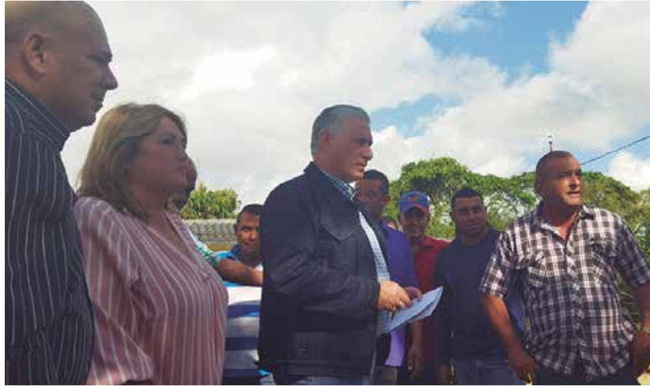
Díaz-Canel se interesó por las causas del incumplimiento de la producción cañera en la UBPC El Meso.

“Con los nuevos precios de la caña tenemos el equivalente a 34 millones de pesos que no hemos podido cortar este año, pero si el clima mejora, estoy seguro de que podremos hacerlo. Hay que agregar que los lubricantes, han tenido una seria limitación, incluso nuestro pelotón tuvo una máquina inactiva por más de 20 días debido a esta