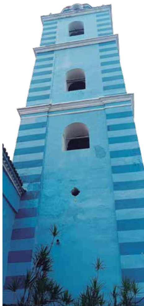
Una de las leyendas más conocidas de la ciudad se asocia a la icónica Iglesia Mayor.