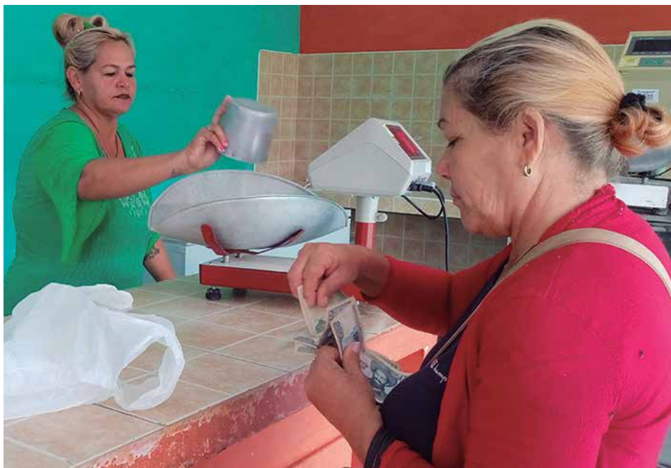
En el mercado La Casiguaya se buscan variantes para mantener las ofertas.

Una mirada al resto de los mercados de este tipo existentes en la ciudad cabecera provincial nos indica que en La Naviera, El Convenio y en El Campesino la realidad es similar; la autogestión lidera la oferta y la ausencia de elaboraciones de entidades estatales del territorio sigue siendo una asignatura pendiente.