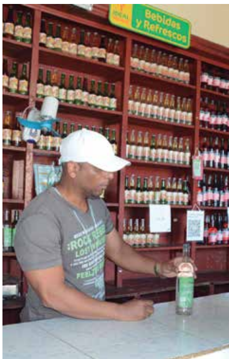
La autogestión es la principal vía para garantizar los surtidos.

Para quienes tienen la responsabilidad de llevar las riendas de algunos de estos mercados resulta muy difícil llenar los estantes que permanecen prácticamente vacíos, con surtidos que salen casi en su totalidad de la autogestión.