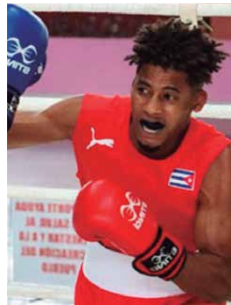
Ambos atletas continuarán su preparación con miras a los Juegos Olímpicos.