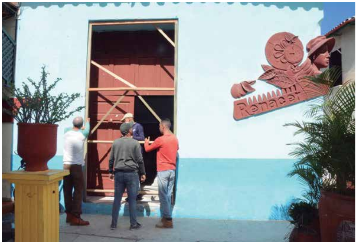
Vista exterior actual del salón de belleza Renacer.

“Se repararon todas las paredes; se dejaron en ladrillo pelado y se resanaron; se hizo el alcantarillado nuevo; la plomería y la electricidad completas de paquete; ya se terminaron la cafetería, la barra; se enchapó todo el patio con yeso y se