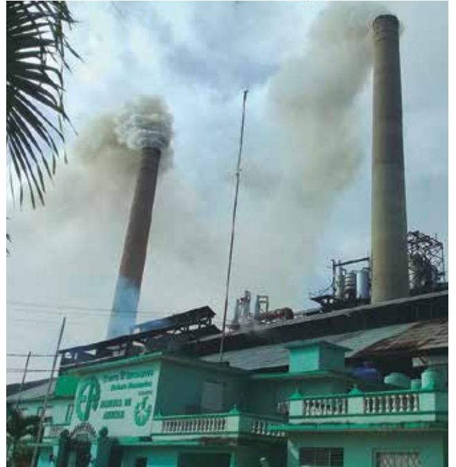
A pesar de los tropiezos, el Melanio Hernández no renuncia al cumplimiento del plan.

En tal sentido, el directivo identifica dos incidencias principales: el mayor tiempo perdido reportado en la industria es por causa de las lluvias en varios momentos, que siempre pararon la cosecha, al menos por una jornada, y la humedad que dejó otras huellas negativas: