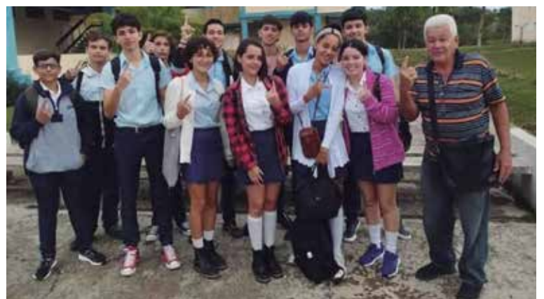
La asignatura de Química figuró entre las más distinguidas.

“Nuestro mayor cúmulo de concursantes provino del Instituto Preuniversitario Vocacional de Ciencias Exactas (IPVCE), el cual aportó 66 alumnos, mientras otros 24 fueron de los municipios. El propio centro formador de talentos recibió la mayor cantidad de medallas (28); le siguieron Cabaiguán con seis, Jatibonico y Trinidad con dos y Taguasco y Yaguajay con una”, agregó el directivo.