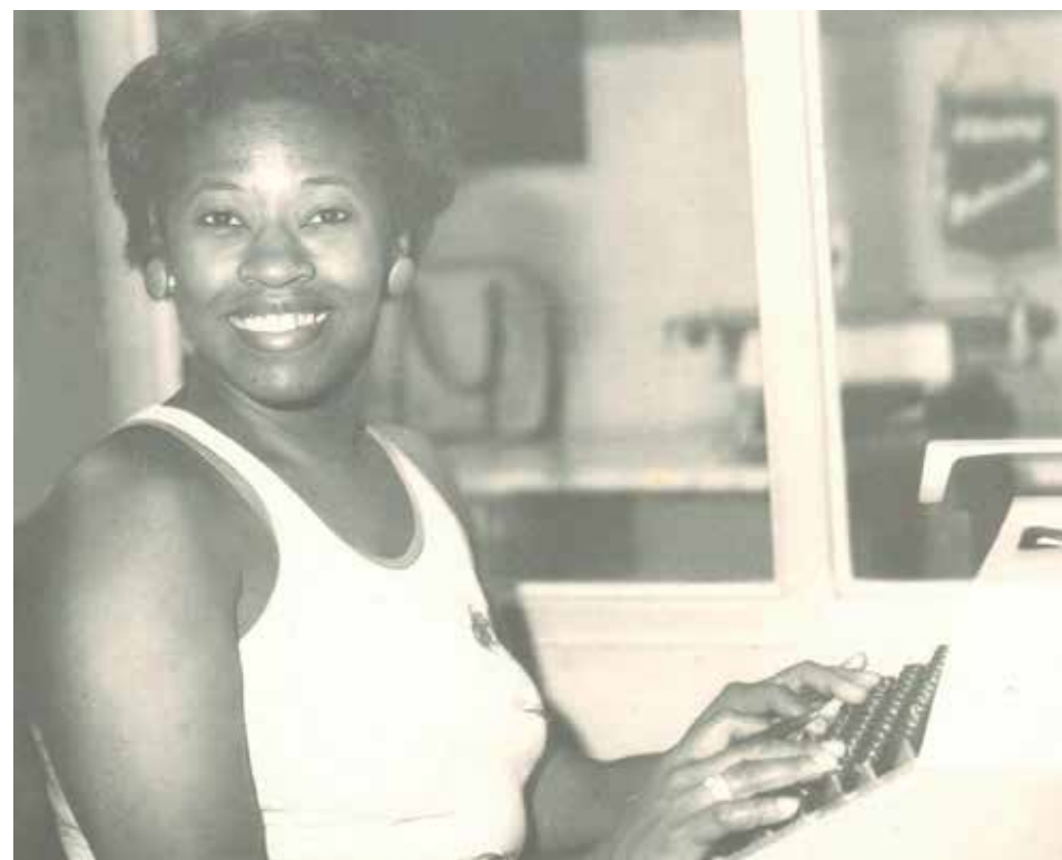
Llegó a Escambray con 22 años y un montón de sueños.