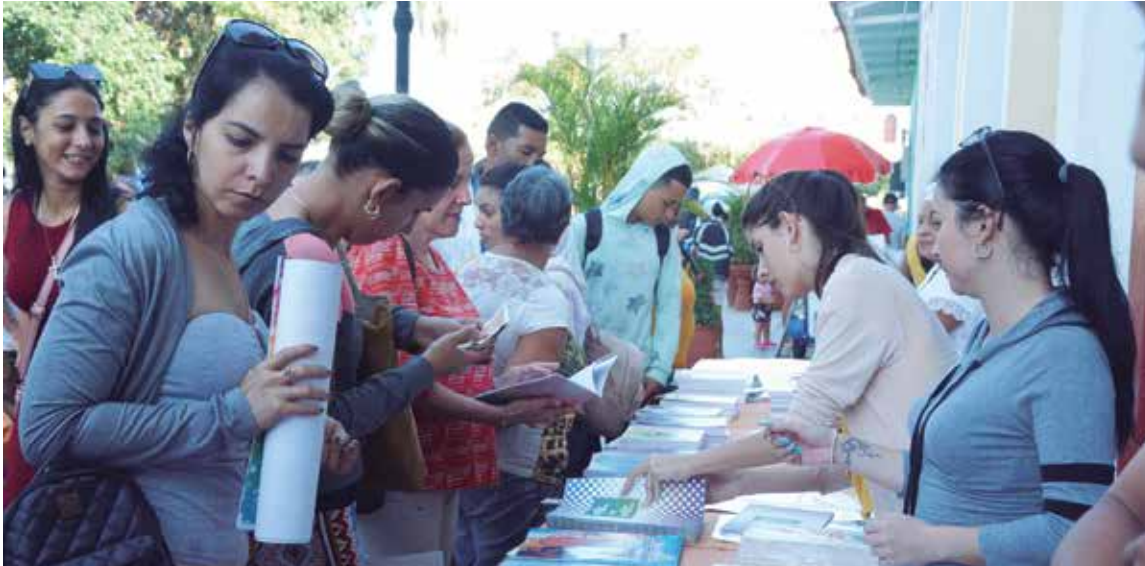
Aunque más limitadas, las ventas de textos y materiales didácticos atraen la asistencia del público.

Hasta este domingo, Sancti Spiritus vive con diversas opciones la XXXII Feria del Libro