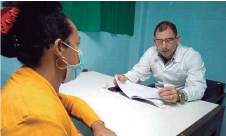
El servicio brinda una atención integral a mujeres y hombres con afecciones que conducen a la infertilidad.