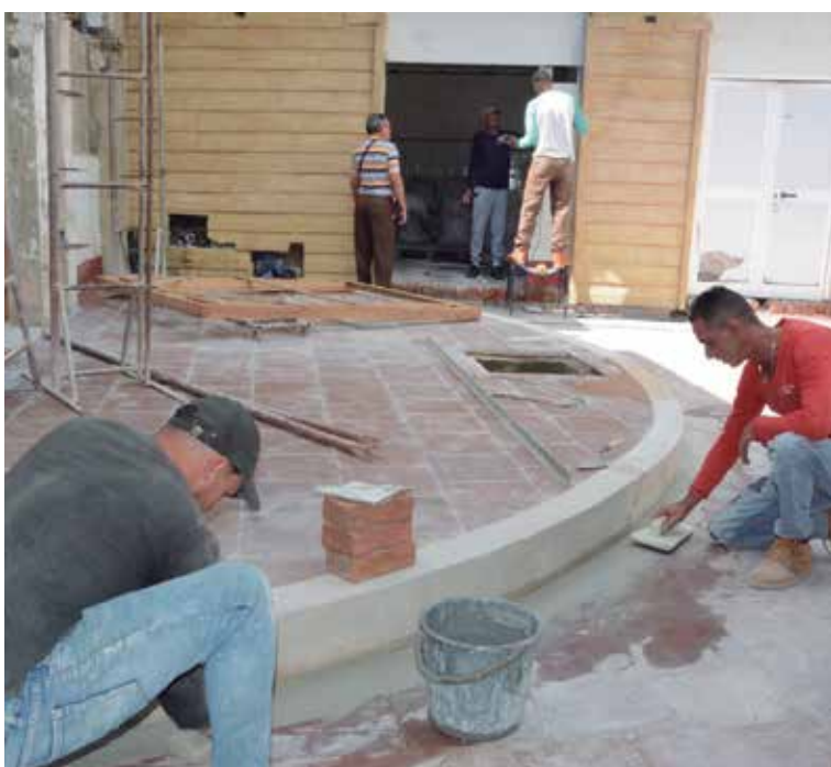
Aún se trabaja en detalles de terminación en el piso del patio.

Y remata a modo de conclusión: “No queremos utilizar el reguetón ni la música alta, sino agradable para el oído. Tenemos muchas personas buenas apoyándonos, capacitándonos y trabajando con nosotros del Gobierno, del Banco. Tenemos fe de que todo va a salir bien”.