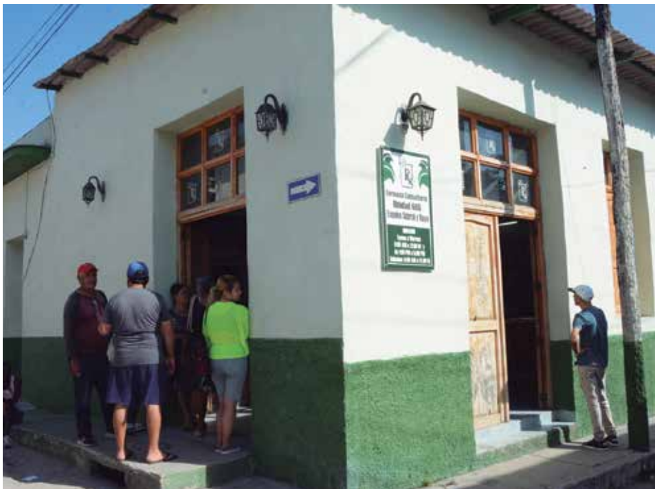
La carencia de medicamentos, incluso los controlados por tarjetón, propicia las colas frecuentes.

Inquestionablemente, los laberintos del mercado informal, también llamado negro, se volvieron más turbios desde la entrada en vigor de una normativa del Ministerio de Finanzas y Precios, a mediados de junio de 2021 y