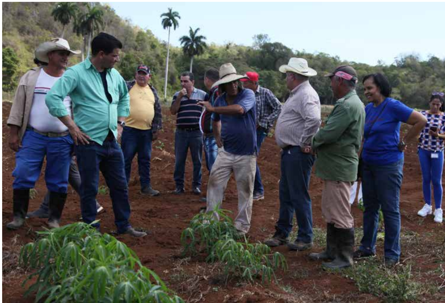
En los recorridos se apreciaron las estrategias para impulsar la producción de alimentos en el territorio.

Además, los visitantes se han ocupado del seguimiento a las directivas para el enfrentamiento al delito, las ilegalidades y las indisciplinas sociales, problemática que aún no logra estabilizarse; así como a valorar el desarrollo del proceso para