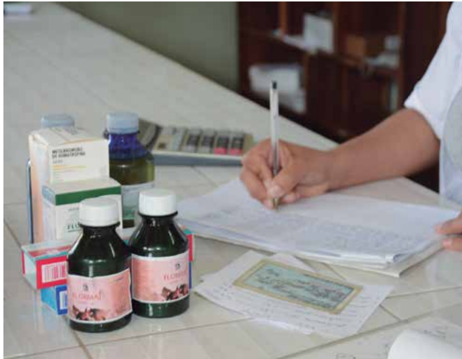
Las recetas vencen al mes de ser emitidas y son controladas por las farmacias.

Desde el punto de vista organizativo, pocos discreparían de este sistema, cuya efectividad