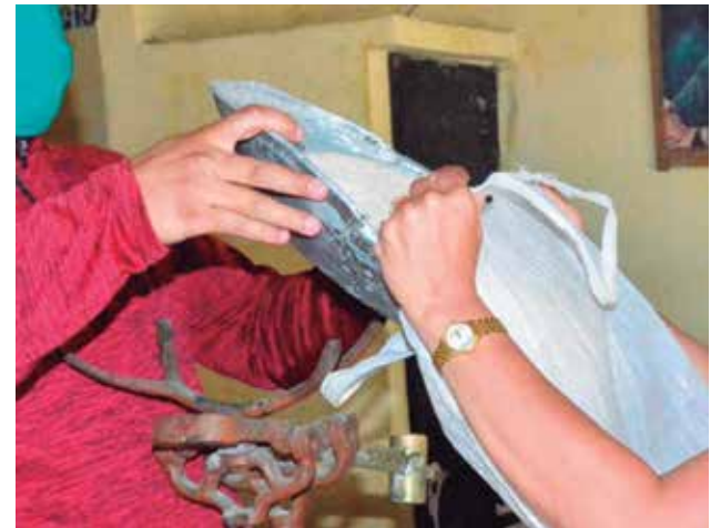
La cuota de arroz para el mes está garantizada.

Según la información del Grupo Empresarial de Comercio en Sancti Spíritus, este mes se prevé continuar vendiendo las dos vueltas de frijoles (febrero y marzo), así como el chícharo de