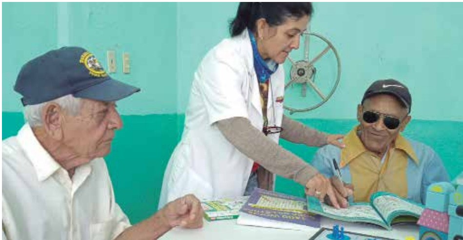
La provincia cuenta con 17 instituciones dedicadas a la atención al adulto mayor.