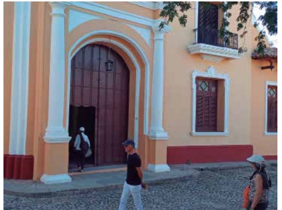
El Museo Nacional de la Lucha Contra Bandidos muestra una imagen totalmente renovada gracias al PDL San Francisco.

Las nuevas dinámicas de la museografía y de la museología —sostiene la directora— implican una relación estrecha entre