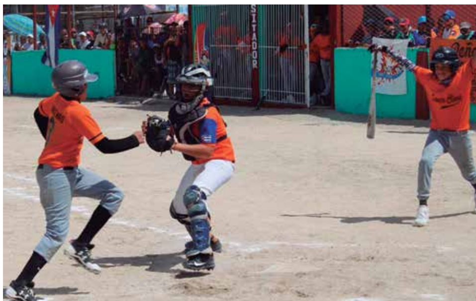
Los finalistas de las Pequeñas Ligas ofrecieron un gran espectáculo.