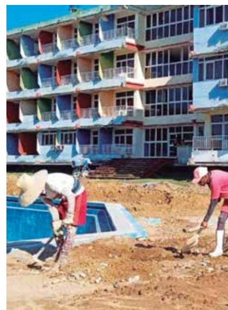
La reparación del hotel Zaza es una aspiración que se concreta.