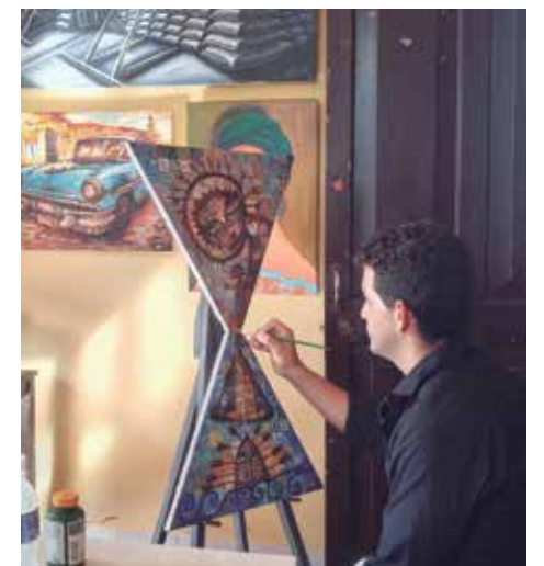
Los artistas visuales tienen un espacio para la creación y el intercambio con los visitantes.