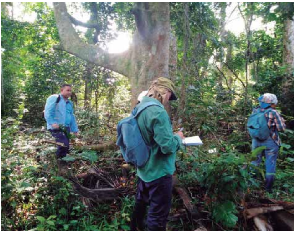
Cobimas inició sus acciones en la provincia en el 2019.