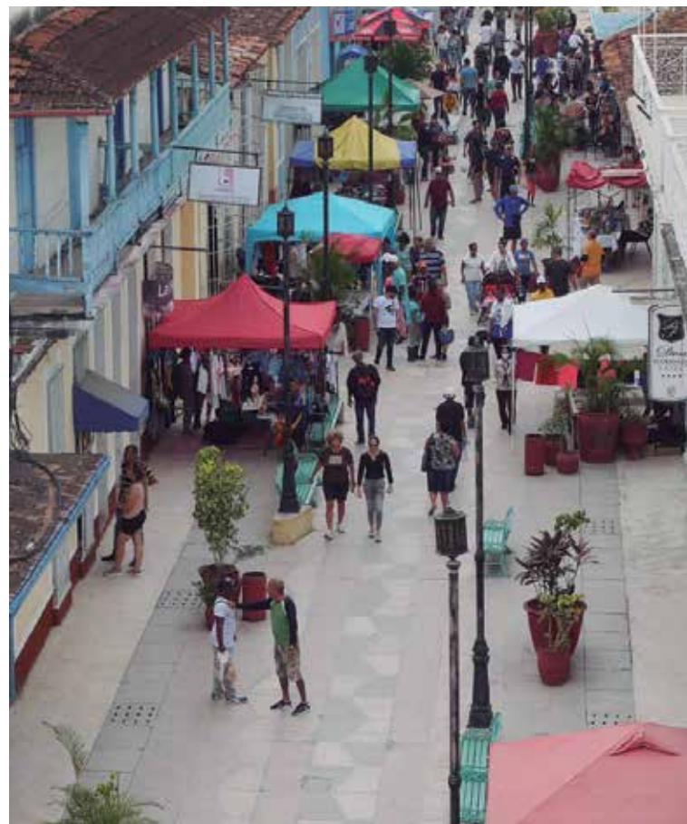
En cada territorio existen dinámicas demográficas propias.

Cuba es el país más envejecido de América Latina y el Caribe y Sancti Spíritus es una de las provincias más envejecidas del país, que pierde población por la movilidad de las personas; entonces, la atención integral al adulto mayor en el territorio debe estar dirigida a potenciar estructuras como el hogar de ancianos provincial y el del municipio de Sancti Spíritus; recargados porque hay otros muni-