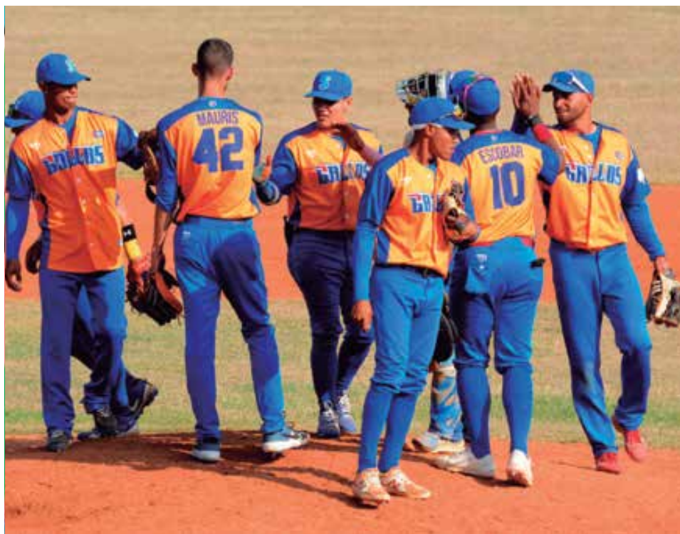
El equipo espirituario necesita estabilizar sus estrategias de juego.