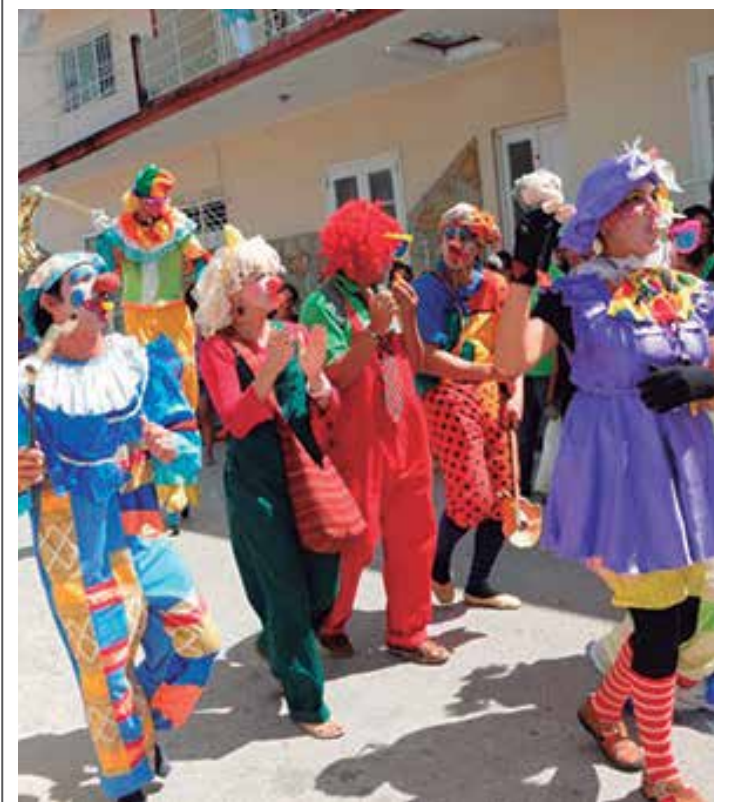
Esta edición se dedica a Teatro Garabato.

El Festival de Teatro Por los Caminos de Cañambrú toma como símbolo a un controvertido personaje de esa localidad: Teodoro San Gil, Cañambrú o El Rojo, como se le conocía. (L. G. G.)