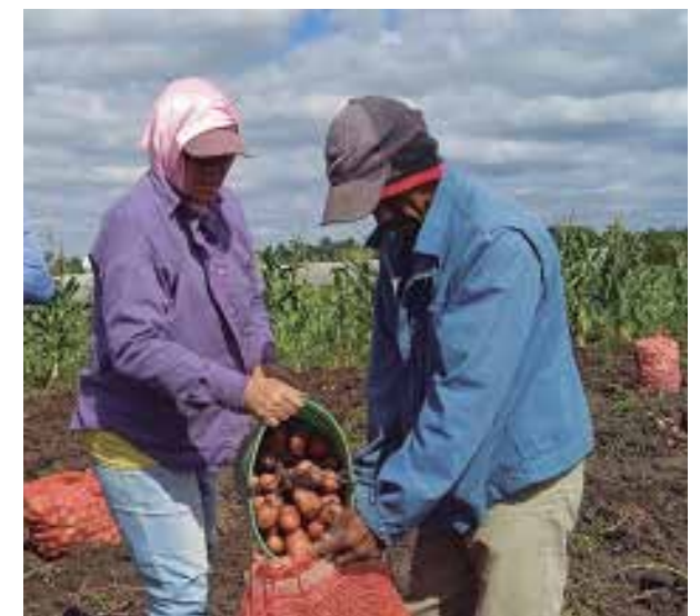
La papa agroecológica se distribuye en las localidades del municipio donde se produce.

Al decir del especialista, el destino de la papa agroecológica es para distribuir en las localidades del propio municipio. “Como programa ha crecido, lo que no da respuesta para que la producción llegue a todos los espirituanos. Esta papa no es la del balance nacional que se distribuye por estos días; la provincia no va a abandonar el programa, ni es el criterio de los productores, pero necesariamente se requiere de semilla importada y refrescar la que guardamos o estaremos corriendo el riesgo de repetir la mala cosecha y la merma del rendimiento”, señaló.