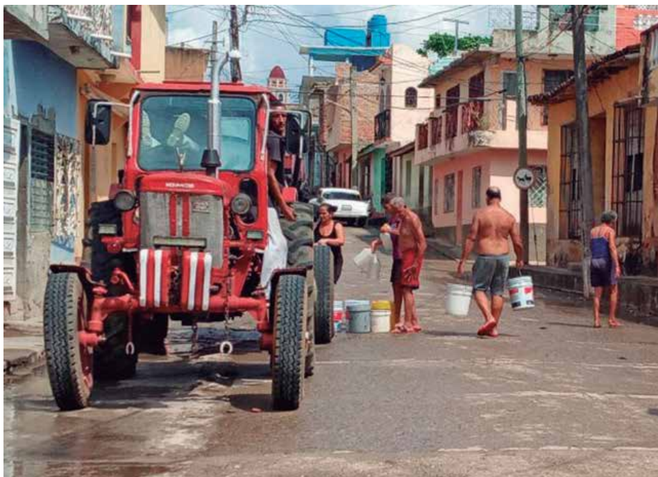
La mayoría de las áreas urbanas no recibe el agua a través de las redes a causa de la sequía y la rotura de los equipos de bombeo.

Quejas similares llueven a diario en la oficina de Atención a la Población en la UEB