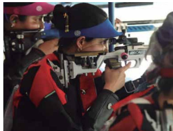
La tiradora continúa preparándose para la cita estival.

piada, pero uno siempre quiere hacer lo mejor y sé que con esas tiradas no podría entrar a la final, por eso quiero superar esas marcas y eso te crea una presión adicional, aunque no quieras, por eso tengo que prepararme mejor. Ahora en mayo estaremos en las Copas del Mundo de Bakú y Mu-