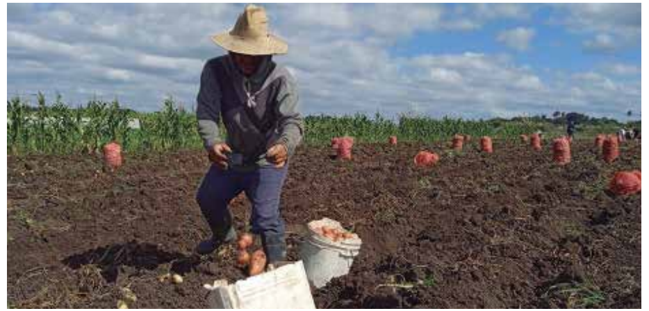
Con una semilla que no reunía la mejor calidad, algunos productores lograron mejores rendimientos.

No obstante, el principal objeto social de Mathisa es la obtención de almohadillas sanitarias para cubrir la distribución desde Matanzas hasta Camagüey, aunque su accionar sigue signado por las limitaciones de algunas materias primas importadas.