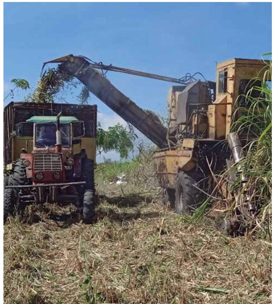
Los colectivos involucrados en la cosecha luchan a brazo partido para sacar adelante la tarea diaria.

Subrayó Viamontes Perdomo que las 8 400 toneladas que restan por producir —hasta el 4 de abril—, se vuelven un compromiso tenso dado el contexto que acompaña la cosecha. “Si el tiempo nos lo permite, en mayo vamos por el cumplimiento del plan de azúcar; hoy lo que están dando el estimado y los números es que la caña que hace falta para completar el plan existe, el problema es poderla cortar a partir de la disponibilidad de recursos y el comportamiento del tiempo; no vamos a renunciar a ese compromiso y seguimos contando con el esfuerzo descomunal que están haciendo todos los colectivos involucrados en la campaña”, destacó.