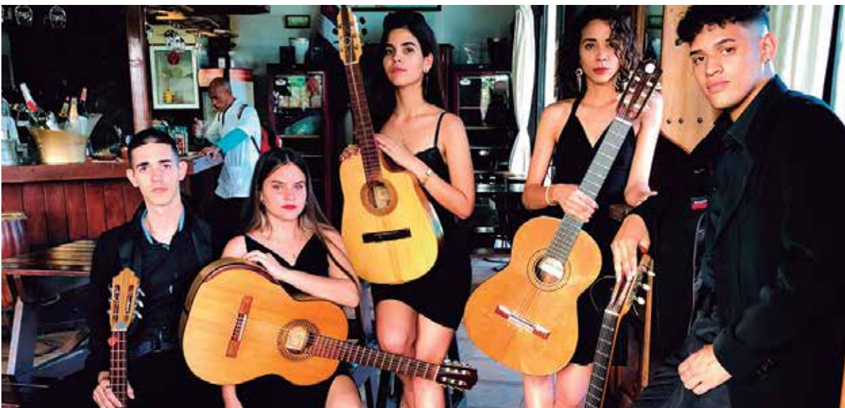
Cuerdas del alma tiene la esencia del arte joven cubano.