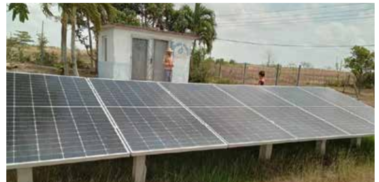
El cambio de matriz energética traerá considerables beneficios para los pobladores del territorio.

proceso contribuirá a dar solución a determinadas comunidades que no cuentan con bombas o se encuentran rotas. Dicha alternativa posibilitará que el Consejo Popular Seibabo se beneficie con la reubicación de estos equipos.