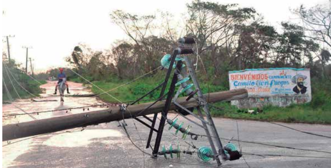
Los huracanes dejan a su paso destrucción y angustia.

“Se van a conjugar varios factores, primero, como se sabe, hasta el mes pasado estuvimos bajo la influencia del evento El Niño que crea condiciones desfavorables para los ciclones, pero este ya cesó. Ahora estamos en un período neutro y se espera que en los próximos meses se desarrolle el evento La Niña, que crea condiciones favorables para la actividad ciclónica.