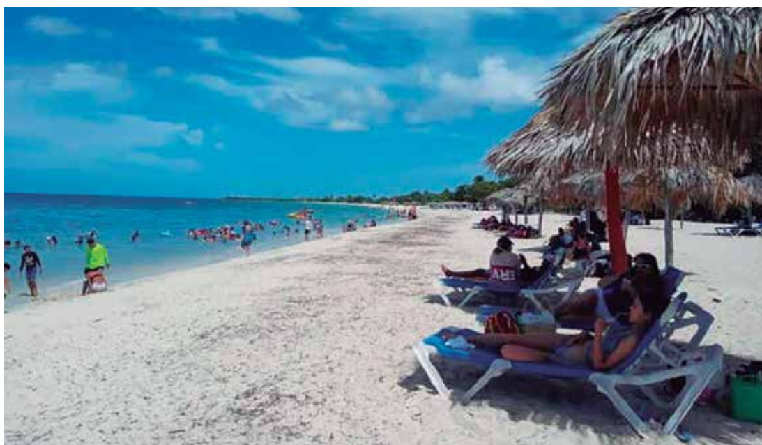
Las áreas de playa se animarán durante la etapa estival en la provincia.