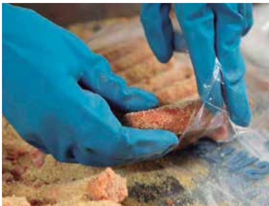
La Planta de Conformados incrementará los surtidos con destino a la población.