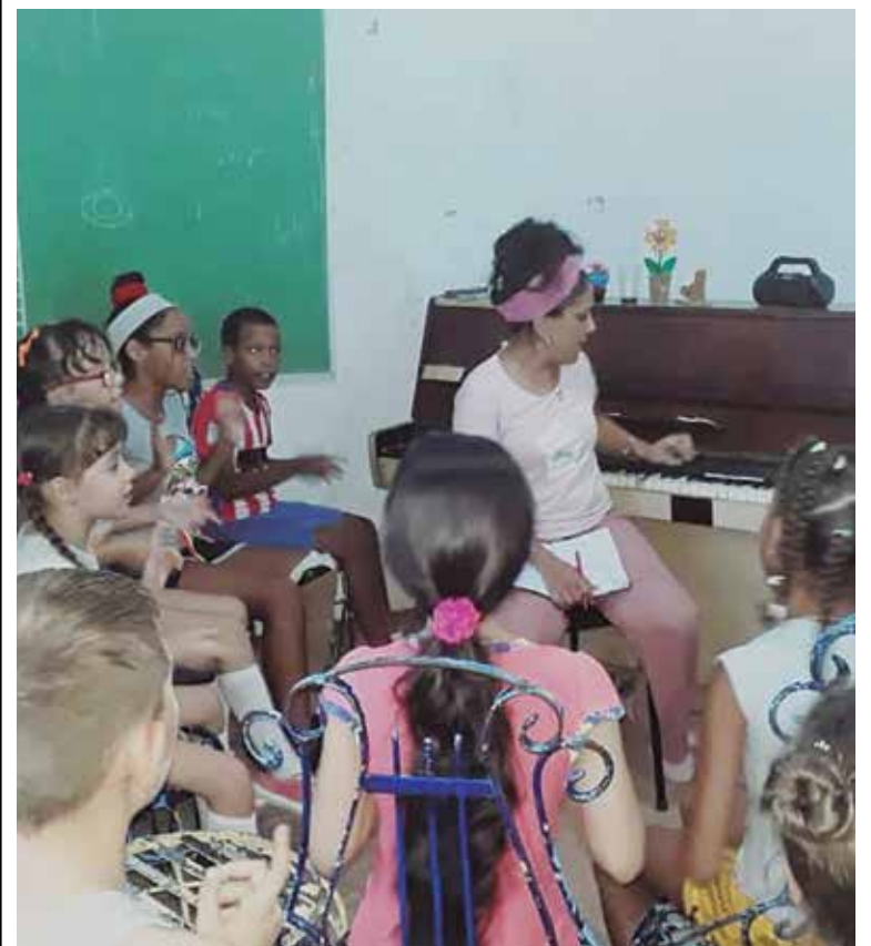
El piano es uno de los instrumentos a los que se podrán acercar quienes se matriculen en los talleres de verano.

Cada una de las propuestas del sistema de Casas de Cultura de Sancti Spiritus, tanto en el interior de sus sedes como en otros espacios será conducida por instructores de arte, programadores e integrantes de la Brigada de Instructores de Arte José Martí. (L. G. G.)