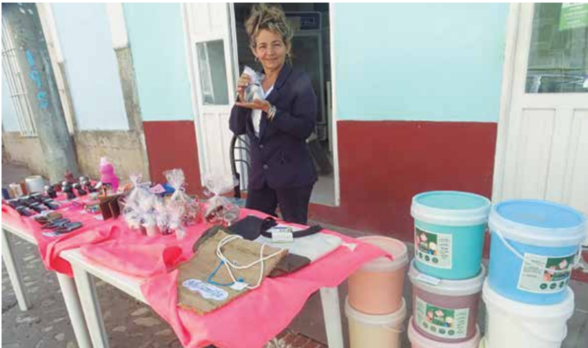
Los productos que hoy expende Artex son resultado del encadenamiento con formas de gestión no estatal y la compra a empresas.