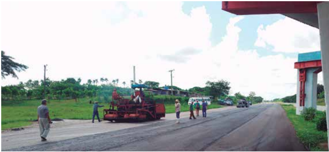
El tramo espirituario de la Autopista Nacional recibe los beneficios de la pavimentación.