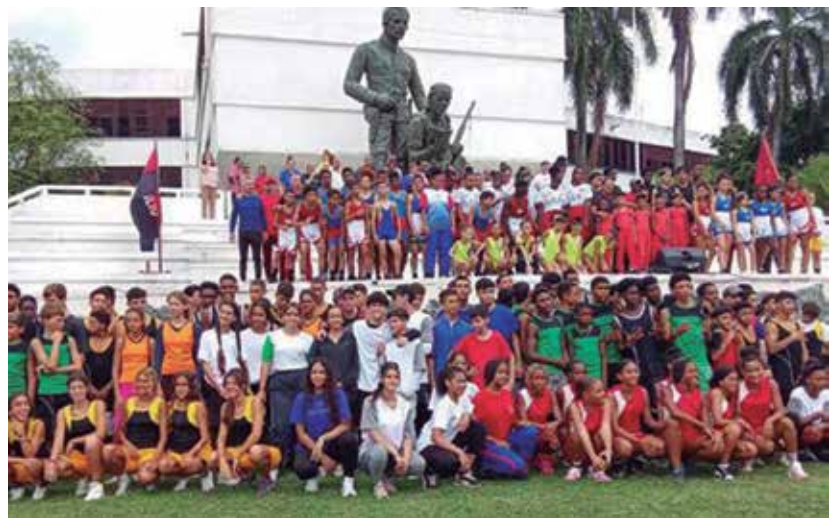
Más de 270 atletas espirituanos competirán en la edición 60 de estas citas.

Los Juegos Escolares Nacionales y Juveniles inician este fin de semana. En medio de un complejo escenario económico y financiero, Cuba ha defendido convocar su pequeña olimpiada. Es ese el mejor de los homenajes al padre mayor, a Fidel, quien vislumbró lo que seis décadas después distingue a Cuba en el mundo: “Y de entre ustedes, entre los que han demostrado vocación por el deporte, firmeza con el deporte (...), de entre ustedes, jóvenes hoy, saldrán el día de mañana campeones que defenderán con orgullo la bandera de la patria revolucionaria en las competencias internacionales”. (E. R. R.)