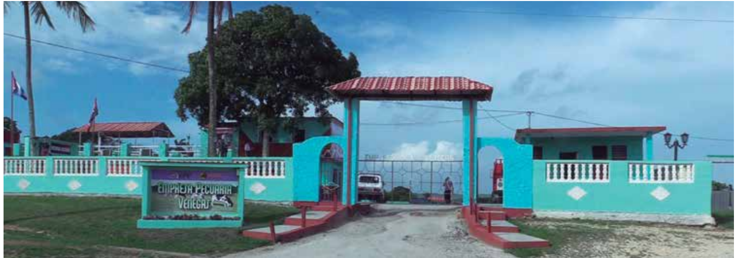
La Empresa Pecuaria Venegas constituye una referencia en el país.

ganadero agradece tener una casa confortable para el bienestar de la familia. “Cuando llegué aquí, la vivienda era un almacén. Hoy por hoy es un chalet y estoy orgulloso de lo que han hecho la Revolución y la dirección de la empresa, porque de verdad tenemos un director que ha logrado para nosotros lo que no se había alcanzado nunca antes”, cuenta con gratitud.