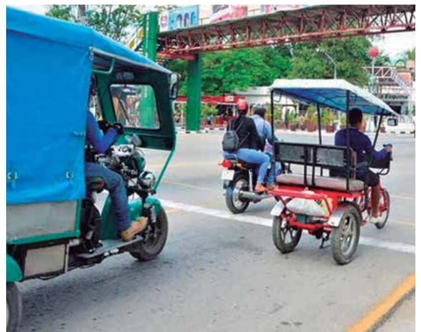
La legalización de vehículos va a contribuir a la transportación de personas en momentos en que tanto se necesita.

Informó el especialista que la revisión técnica se programará a partir de septiembre, previas citación a las personas, y será de forma presencial en los municipios, para los medios que no requieren pasar por la planta de revisión técnica —somatón—. También adelantó que para este paso se dispondrá de dos oportunidades.