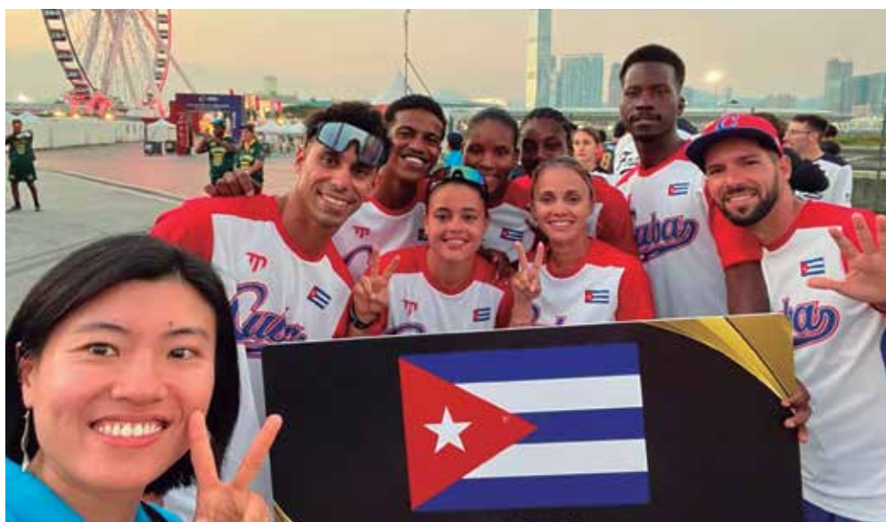
La espirituaña (delante, a la derecha) es un puntal defensivo en el equipo que celebra su triunfo.