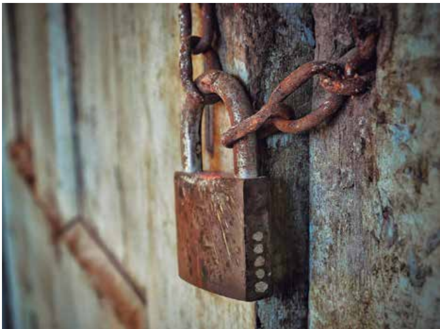
Con el candado definitivo, el deterioro se acomodó a sus anchas.

La banda es el himno; es la añoranza; es el terruño querido; la banda, nuestra banda, es también un canto a la patria.