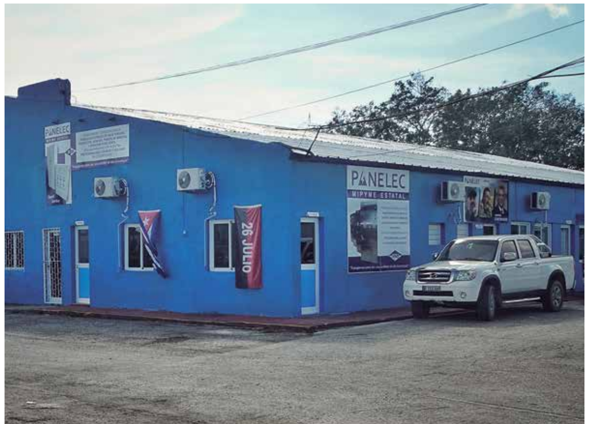
Ya aprobada como mipyme, Panelec podrá ampliar su objeto social.

Además, se sigue trabajando en el cambio de la matriz energética del bombeo de agua a la población, a partir de la entrada a la isla de 722 equipos distribuidos por varias provincias; 99 en Sancti Spíritus, de los cuales ya presta servicio el 92 por ciento.