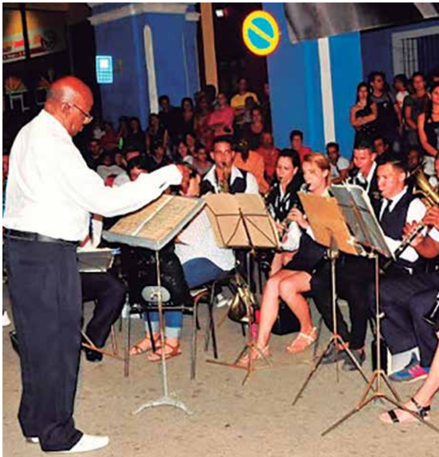
Durante generaciones, la Banda de Música ha mantenido sus esencias.