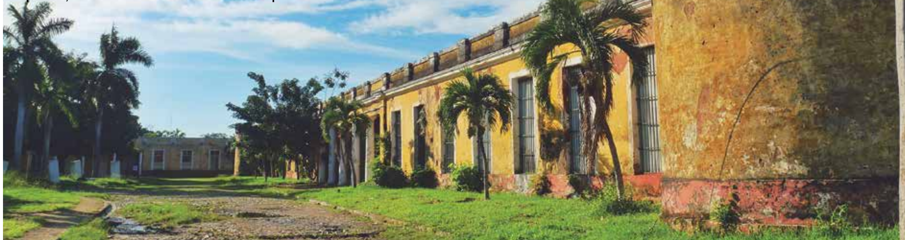
El Cuartel de Dragones es valorado hoy como ruina arqueológica.

Con el cierre de la Academia de Artes Plásticas, de Trinidad, el inmueble —único de su tipo en el país— ha quedado a la deriva, sin objeto social. En sus ruinas se muestran las huellas profundas de la desidia, el olvido y la cada vez más lejana posibilidad de materializar un proyecto que, poco a poco, le devuelva sus valores patrimoniales