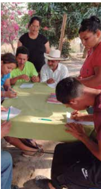
En Honduras se lleva a cabo un proyecto de alfabetización mediante el método cubano Yo sí puedo.

“En estos momentos se imparten cursos de preparación a los profesionales que prevén salir de misión hacia lugares de habla inglesa”, añadió finalmente Sosa Ramírez.