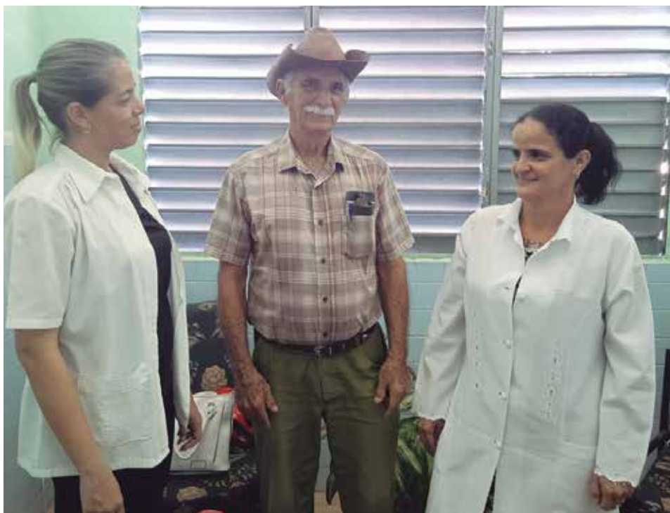
El presidente del Consejo Popular de Meneses indaga sobre el quehacer del policlínico Sergio del Valle.

El tiempo solo le había alcanzado para hablar sobre su trayectoria como representante de pueblo y saludar a algún que otro elector. El día no podía terminar sin revisar los últimos planteamientos. Por tanto, no demoró la despedida. Espetó el saludo cordial de siempre y siguió en busca del diálogo con su gente, esa que por más de dos décadas lo ha encumbrado como el alma y la voz de esta comunidad.