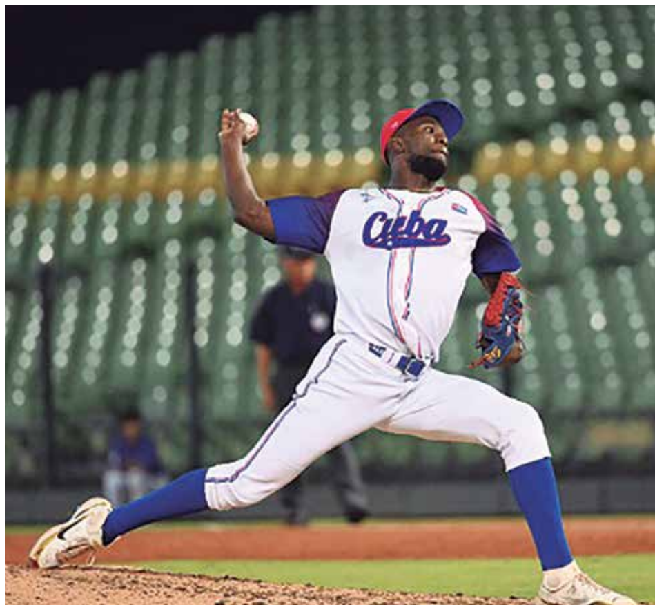
El equipo comienza a enfrentar a sus rivales de grupo a partir del 13 de noviembre.

Pero ya sabemos que ese no es el punto, aunque por este tipo de selección el equipo no se logre armar como lo que es hasta casi la hora de competencia, ya que algunos como los que se desempeñan en la liga japonesa llegaron bola y corredor; pero a favor de estos habría que decir que deben haber llegado en