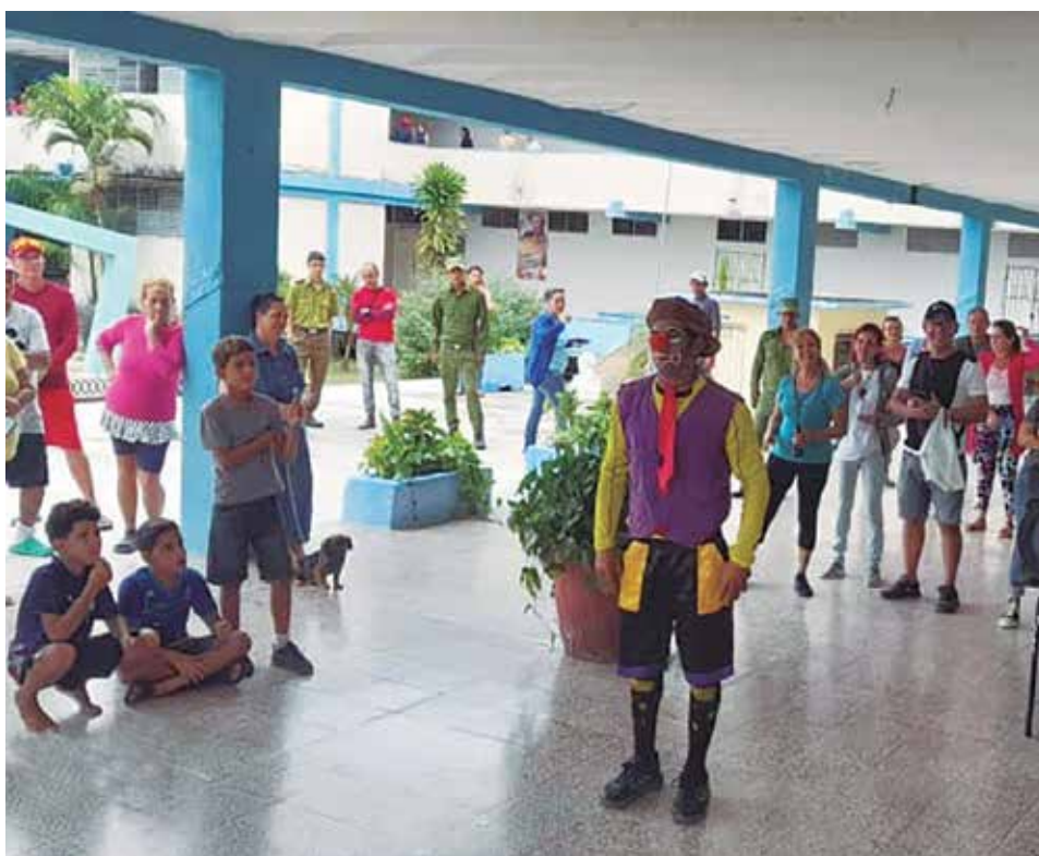
Brigadas culturales animaron la estancia de los evacuados en la ciudad espirituaña.

Un gran número de familias fueron acogidas por manos solidarias de familiares y amigos, y el resto, en los centros activados con ese propósito