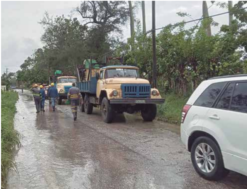
Los linieros espirituanos estarán en La Habana el tiempo que sea necesario.