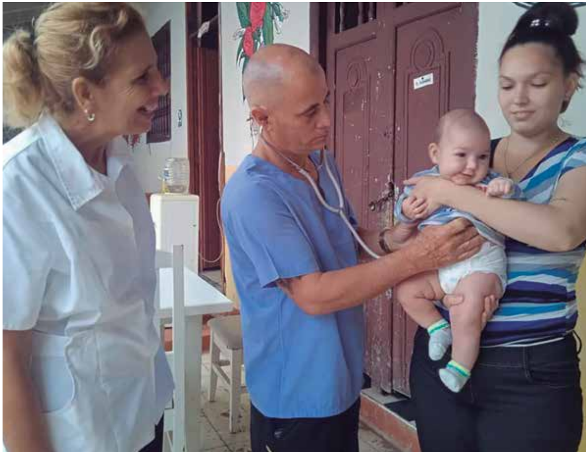
Niños menores de un año recibieron atención médica.