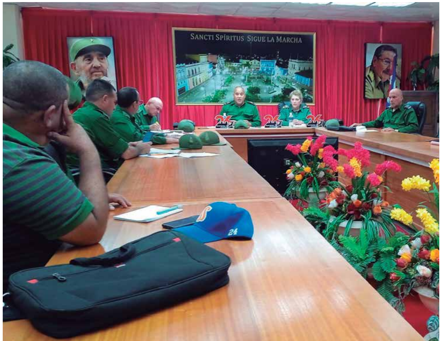
En la provincia se adoptaron las medidas pertinentes para cada fase.

Como siempre en momentos de espera ante el paso de un huracán, que esta vez se avizoraba potente incluso antes de estar estructurado, se aseguraron las disponibilidades de combustible para grupos electrógenos de centros vitales: hospitales, estaciones de bombeo de agua, centros de elaboración de alimentos; se enfrentaron los mecanismos