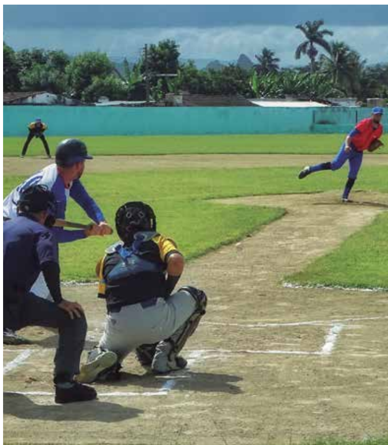
El próximo sábado se disputarán cuatro subseries en la continuidad de la Serie Provincial.

También destacó la labor de quienes en varios sitios de la geografía espirituaña apoyaron la evacuación de personas, sobre todo en zonas rurales de Trinidad, así como las acciones para proteger las diferentes instalaciones, centros de trabajo y de estudio. (E. R. R.)