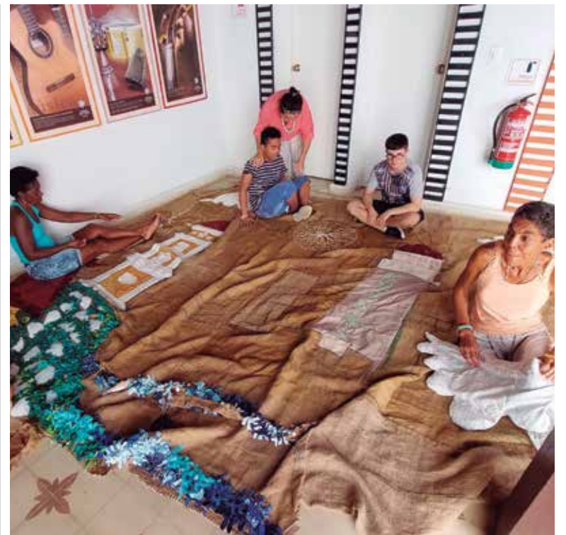
El tapiz tiene un carácter inclusivo, gracias a la fusión de muchas manos.