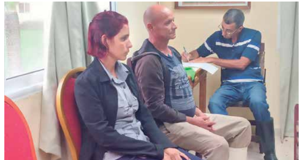
Durante estos días estuvo al tanto de los más de 100 evacuados.