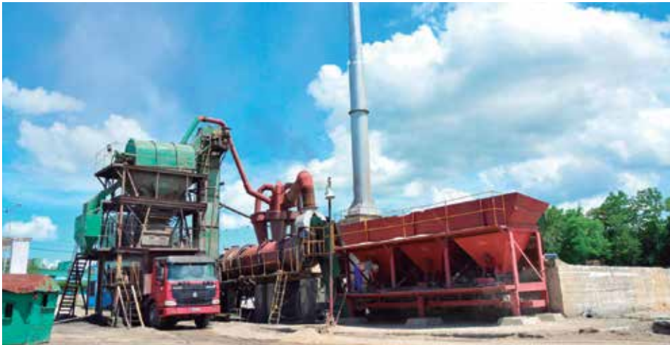
El peso de la producción de hormigón asfáltico caliente recaerá en la planta ubicada en el municipio de Sancti Spíritus.