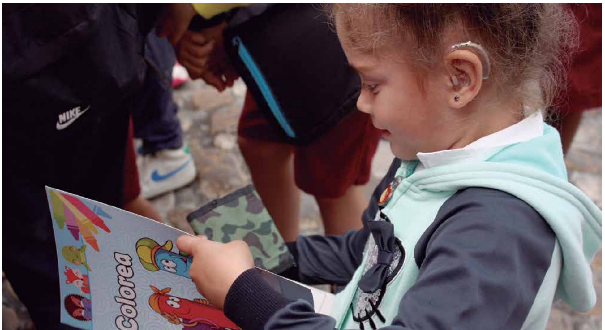
Las opciones para el público infantil siempre acaparan la atención de la Feria.