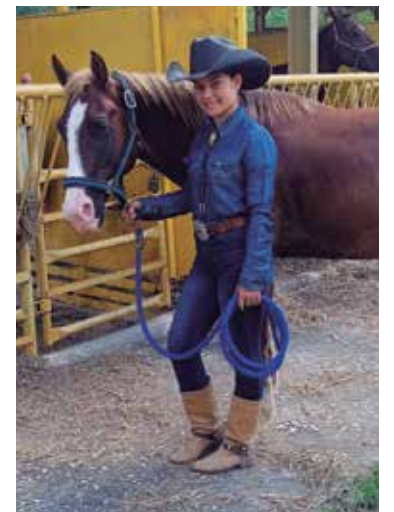
“El amor que siento por los caballos fue determinante”, asegura.

Luego de concluir la ceremonia de apertura, la joven vuelve a transitar por el área, se lleva consigo a los atletas que enarbolan banderas bicolores y entra en los cepos donde se alista para salir a realizar su carrera alrededor de los barriles. Pero antes, en el propio terreno, respira profundo, controla los nervios y acaricia a Mariachi para que la acompañe en esta prueba sin cometer errores.