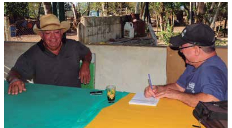
En Escambray también lideró importantes momentos del complejo proceso de gestión de contenidos.

“Estoy más endeudado con la profesión y con los lectores que lo que les he aportado. Tenemos la deuda eterna de ser los cronistas de estos tiempos, de dejar la memoria de este contexto de apagones, escasez, de gente guapeando, de explicar por qué vivimos así... Igual, también reconozco que ser periodista hoy es un desafío. Seguimos siendo una figura salarialmente muy devaluada en Cuba. Los que estamos aún es por compromiso y por ética. De ahí que resulta importante asumir el ejercicio desde la humildad, la sencillez, el conocimiento y el sentido común. Es escribir viéndote tú en la calle, en la cola de la farmacia y que no alcances el medicamento, en la espera de una guagua que jamás llega... Es hacer periodismo terrenal y no el que te diga un funcionario”.