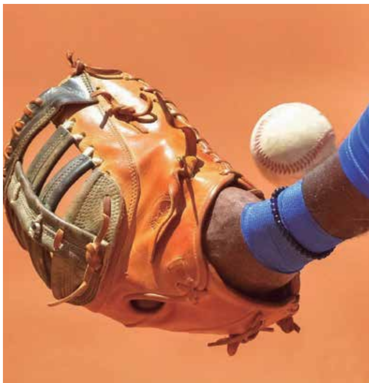
Levantar el espectáculo del béisbol es una asignatura pendiente.