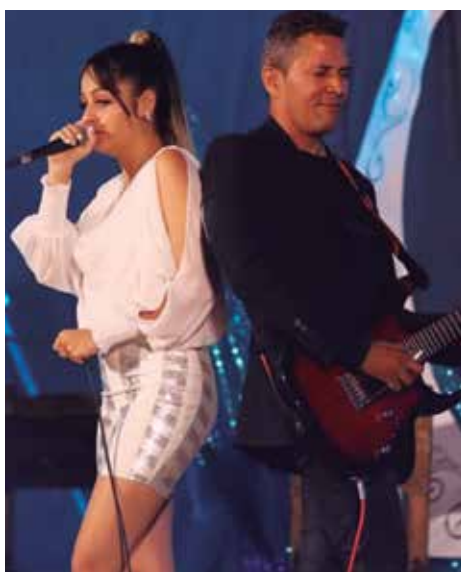
Compositores e intérpretes de la región central del país competirán por los lauros que confiere el certamen.