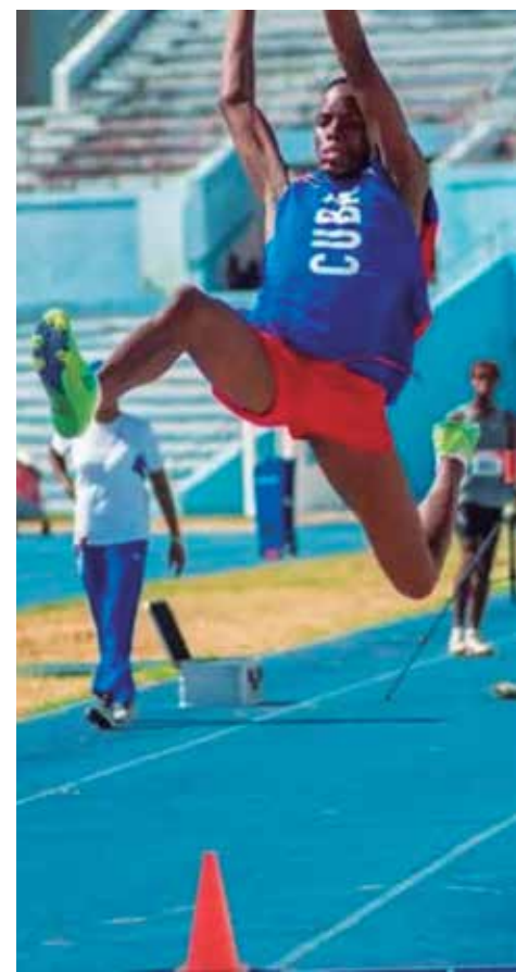
Odelín ostenta el segundo lugar del ranking mundial de su categoría Sub-18.

Desde la distancia prudencial de sus 17 años, mira los ocho metros y trata de contener esa intranquilidad casi natural. “Son metas, pero tampoco es que tenga tanto apuro, que llegue cuando tenga que llegar. Gané, pero no estuve conforme, porque eso es lo malo que tenemos la gente del centro: que se conforman con las cosas, pero yo no soy así, siempre quiero más y más”. (E. R. R.)