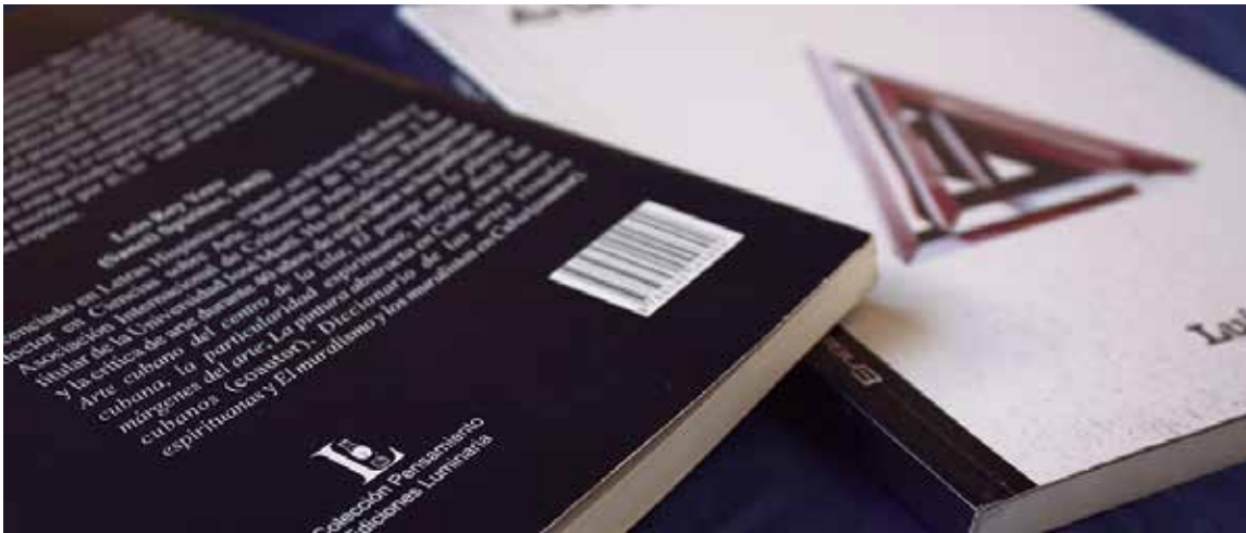
Diversas presentaciones de títulos de la casa editorial espirituaña tuvieron lugar.