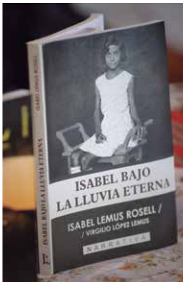
En su pueblo natal presentó el libro que le rinde homenaje.

“Ojalá, algún día alguien rememore que una persona donó aquí la Réplica del Machete del Generalísimo Máximo Gómez, que las Fuerzas Armadas Revolucionarias tuvieron a bien entregarme el año pasado. Ojalá también que mi obra fructifique y que sea útil para otros escritores”.