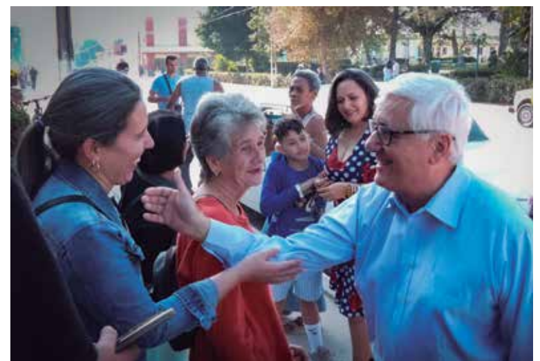
El reconocido intelectual es admirado y querido por muchas generaciones.