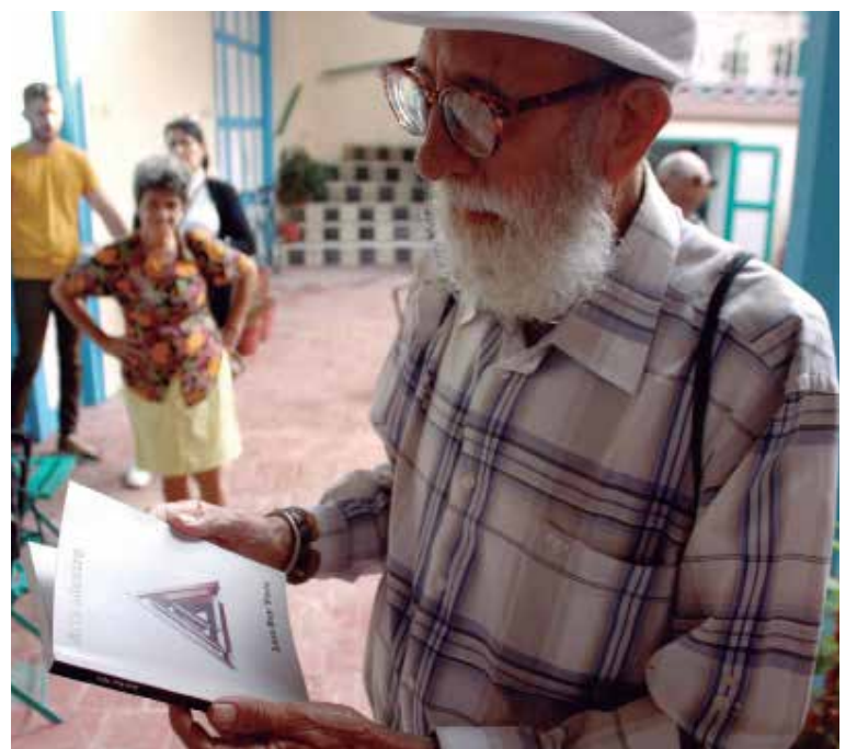
Tras siete años de espera, hoy los lectores pueden hojear el texto que ubica las artes visuales en su justo lugar.

“Va de lo más epidérmico de lo visual hasta llegar a lo más profundo del alma”, concluyó su autor. (L. G. G.)