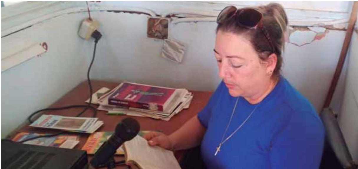
“Es mi fábrica y tengo un gran sentido de pertenencia hacia ella”, afirma.