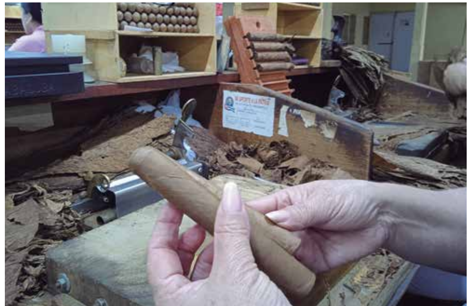
El aporte del tabaco torcido como renglón exportable a la economía espirituana alcanza una alta significación en los últimos tiempos.

cados con centros dedicados al beneficio de los productos, una mini industria para la producción de alimentos en conservas, una casa para el cultivo de posturas, un taller de maquinado, equipos automotores destinados a la comercialización y la preparación de las tierras, y más de diez sistemas de riego eficientes.