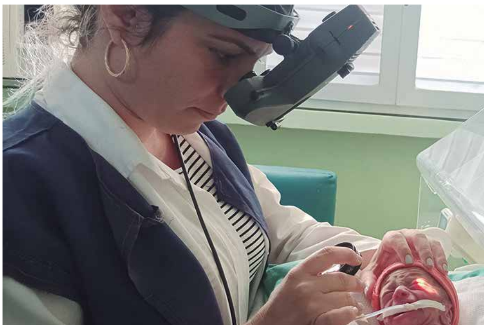
El pesquiasaje activo de los bebés prematuros ha sido clave en la detección precoz de la retinopatía de la prematuridad.

Desde el 2005 y hasta la fecha, 31 niños de la provincia han sido salvados de la ceguera gracias a la detección y tratamiento precoz de esta enfermedad