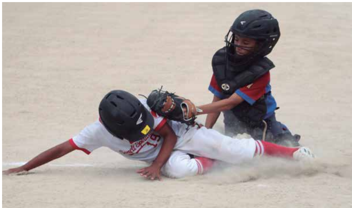
Los jugadores de Sancti Spiritus llegan a esta etapa con la adrenalina mostrada en la semifinal.