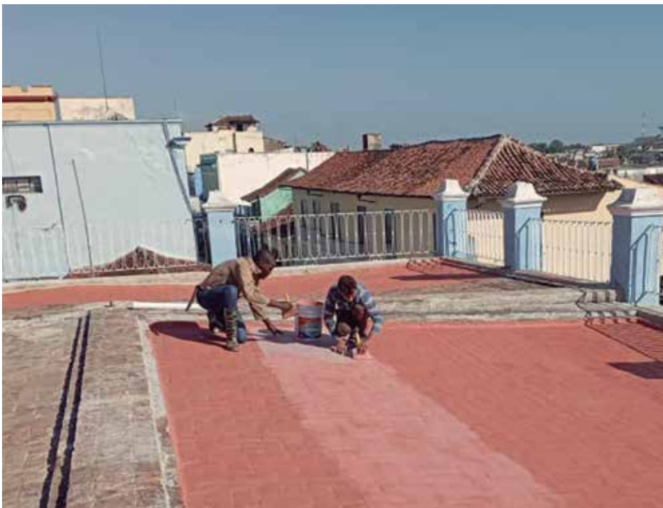
En el edificio conocido como El Rubí se han borrado las huellas del deterioro.