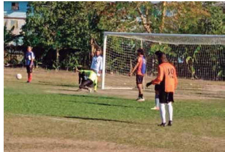
Este sábado los espirituanos encararán el tercer desafío ante el once de Las Tunas.

Se jugará a cuatro vueltas, todos contra todos, en dos partidos de ida y dos de vuelta. (E. R. R.)