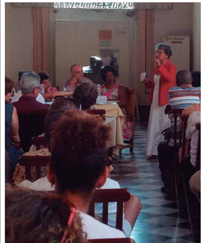
La reconocida artesana realizó una indagación minuciosa en torno a las labores artesanales caladas sobre textiles en la tercera villa de Cuba, durante el periodo de 1990 hasta 2023.