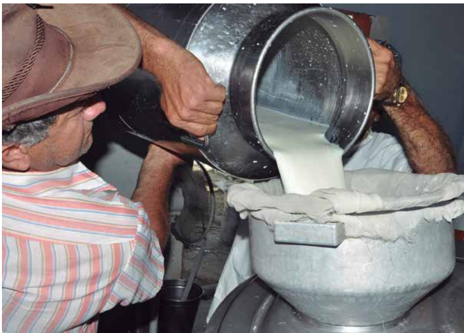
La economía de los campesinos y de las empresas se afecta notablemente por las deudas en los pagos a sus producciones.