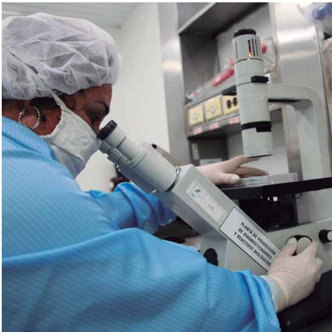
Durante largas jornadas los trabajadores de este colectivo concretan su aporte a la ciencia.

Los anticuerpos obtenidos en el CIGB de Sancti Spíritus actualmente resultan imprescindibles para importantes proyectos como el desarrollo de vacunas y nuevos