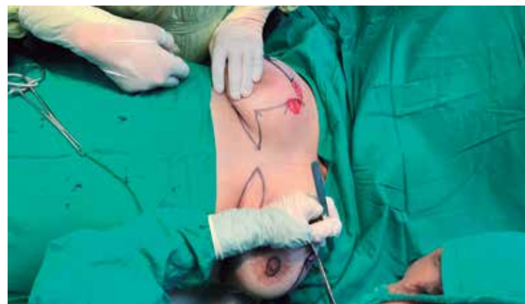
La cirugía oncoplástica ha permitido mejorar la calidad de vida de las pacientes.

“Ahora puedo decir que me siento tranquila, contenta, psicológica y físicamente bien, como una mujer enamorada de mí misma porque con todas mis cicatrices, mis arreglos, siento que he salido a flote de esta enfermedad que ha cobrado muchas vidas. No todo el mundo tiene esta posibilidad”.