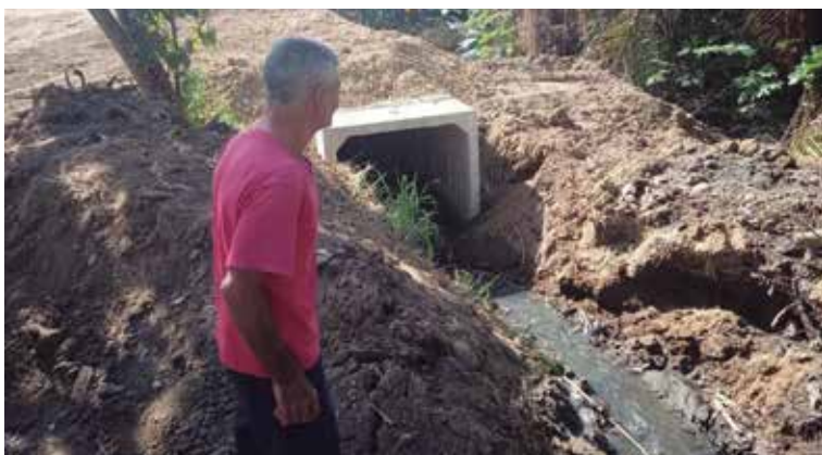
Durante el primer trimestre del 2025 se comenzaron algunas de las obras que forman parte de este plan de inversiones.

La entidad cuenta con poco más de 321 millones de pesos para la ejecución de varios proyectos, divididos en diferentes programas priorizados para satisfacer necesidades de la población