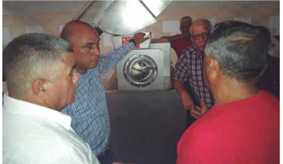
Sancti Spíritus tendrá la única línea de producción de este tipo en el país.

Igualmente, sugirió hacer alianzas con industrias de otras provincias vecinas, pues la incorporación de esta novedosa tecnología en Sancti Spíritus favorece el desempeño, al estar geográficamente en el centro de la isla. “Se trata de buscar eficiencia en todo lo que hagamos y con el aporte de materias primas provenientes