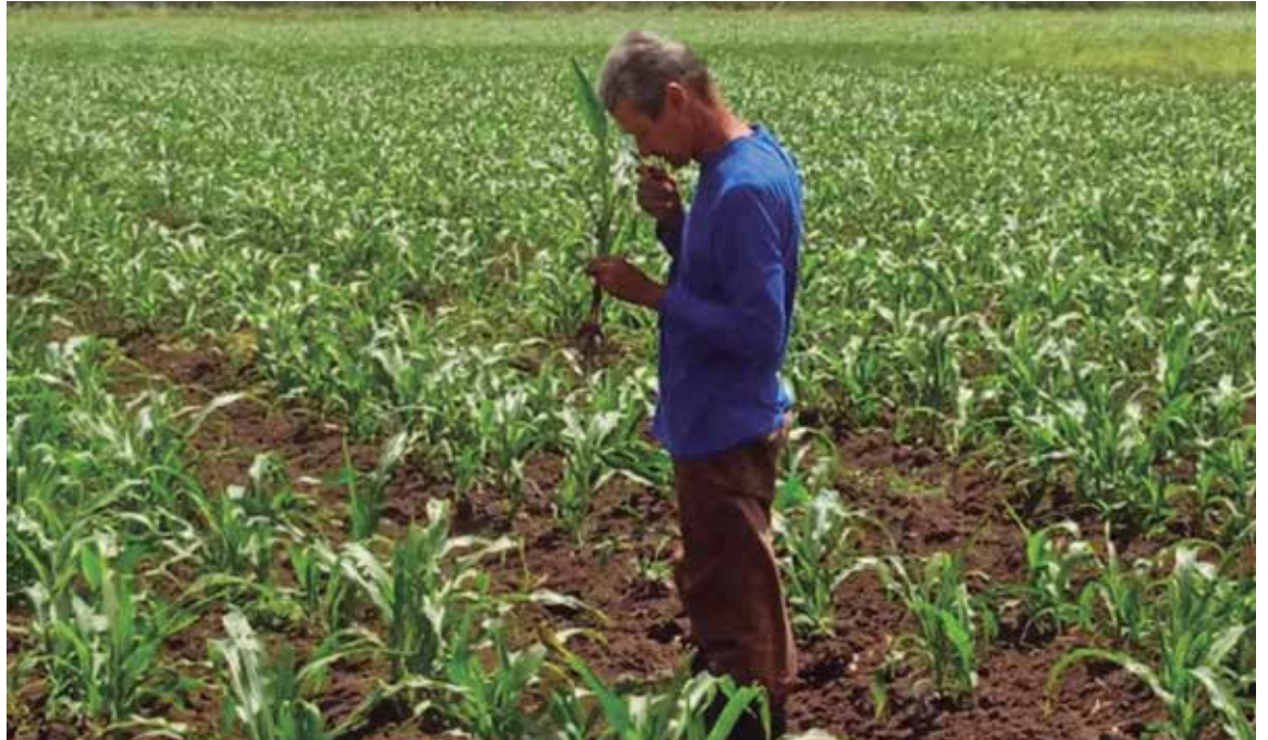
El especialista en Protección de Plantas monitorea los diversos cultivos del territorio.

la protección de plantas, función en la que debe asegurar “la prevención, monitoreo y control para la erradicación oportuna de todas las plagas en los cultivos, con el propósito de alcanzar un impacto favorable en el hombre, los animales y el medio ambiente”, destaca el especialista.