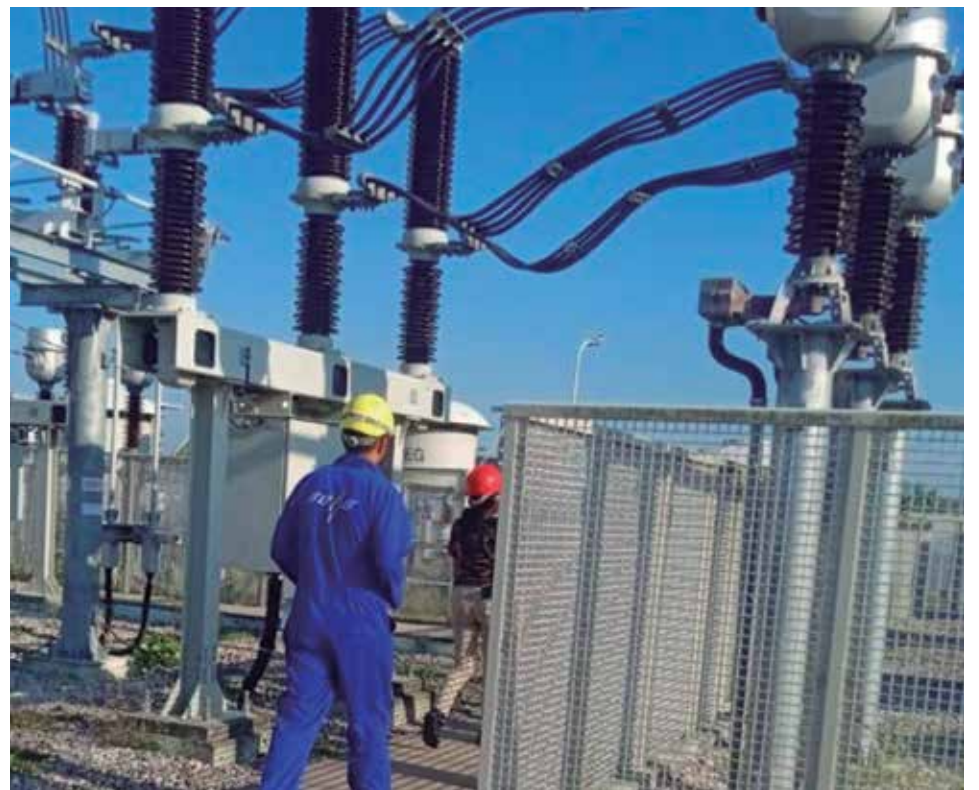
La subestación de 220 kilovoltios, ubicada en Tuinucú, sincronizó con el SEN hace cerca de una década.

“El cliente puede percibir lo necesario que resulta porque se evita el pestañeo que ocurre a veces. Cuando se cayó el Sistema Eléctrico Nacional recientemente, una de las