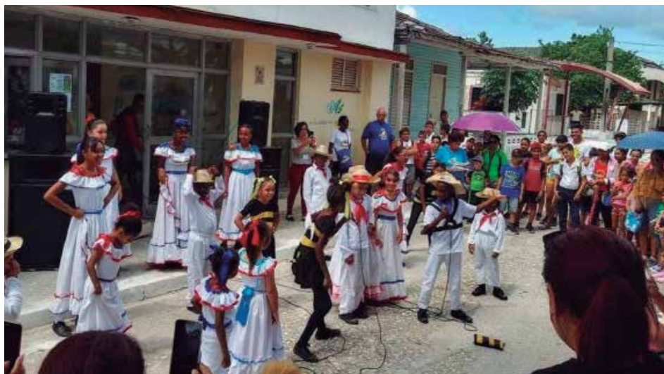
El evento convocaba lo mejor de las artes en Jarahuca.

Desde ese entonces la convocatoria revolucionó a Jarahuca. El pueblo abrió las puertas de sus casas para que los asistentes, tanto extranjeros como nacionales, se hospedaran como una familia más. De esos días de bienal todavía persisten relaciones de amistad entre pobladores y personas de otras regiones del país que llegaban para disfrutar y traer de vuelta distintas facetas de la vida de Ada. Ello sin contar que de este evento emergieron el