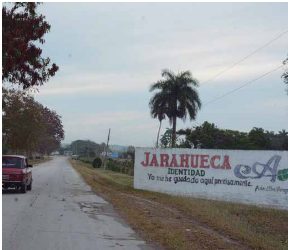
La huella de Ada Elba Pérez, una de sus hijas ilustres, perdura en el poblado.

Pero, a más de un siglo de existencia, el pueblo, de ascendencia campesina y una población de más de 2 900 habitantes, continúa siendo identificado por el laboreo de sus tierras fértiles, distribuidas en fincas que lo rodean y por el protagonismo alcanzado desde hace años en la producción lechera y de granos de alta calidad como el frijol, el maíz y el sorgo, al punto de trascender con