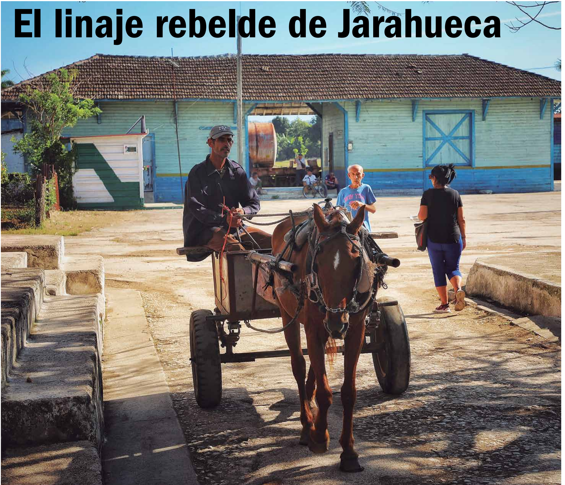
La Estación de Ferrocarriles es uno de los sitios emblemáticos del poblado.