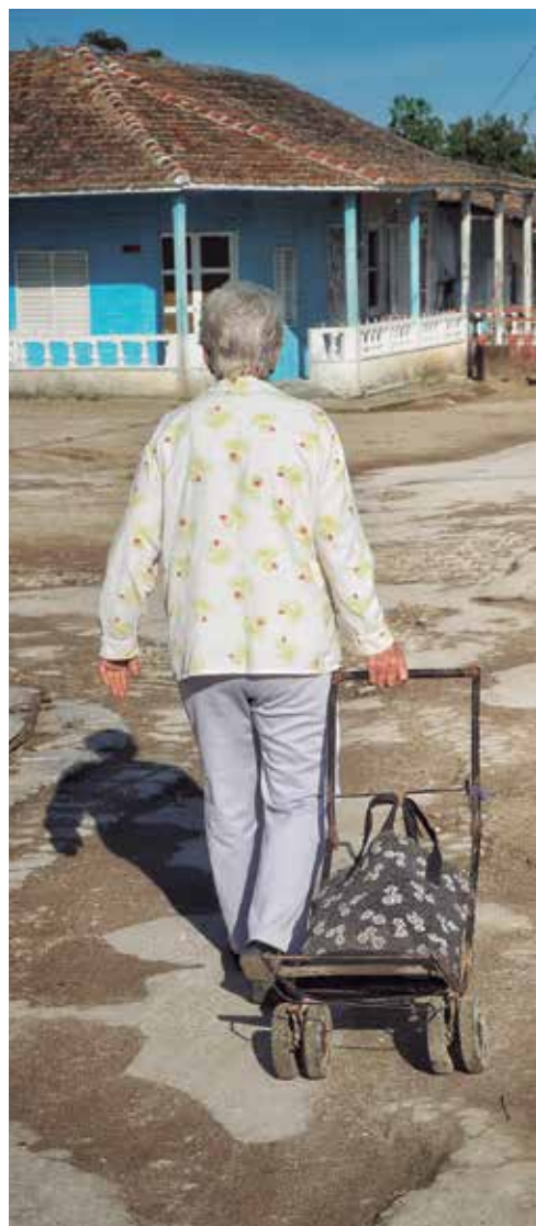
Algunas calles se encuentran en muy mal estado.

En la biblioteca y la Casa de la Cultura se atesoran vivencias que no solo definen la idiosincrasia de su gente, sino la leyenda de lo que fueron los inicios del lugar, sus cultivos y sus fiestas, en el sitio donde dos palabras se fundieron en una: Jarahueca.