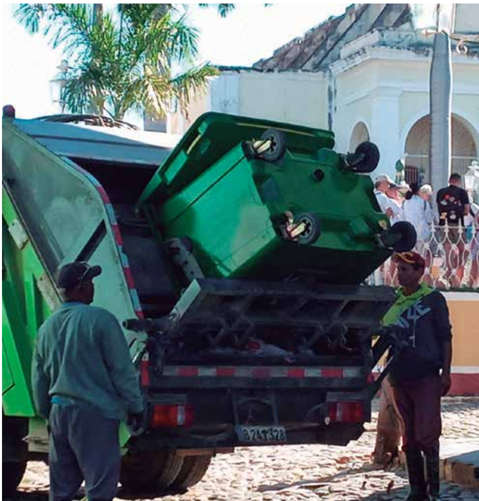
Los nuevos medios para la recogida de la basura importados por la Oficina del Conservador de Trinidad gracias a un proyecto de cooperación internacional contribuyen a la higiene de la ciudad.