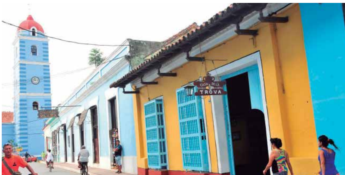
Desde hace algún tiempo comenzó a cambiar el público que asiste a la Casa de la Trova.