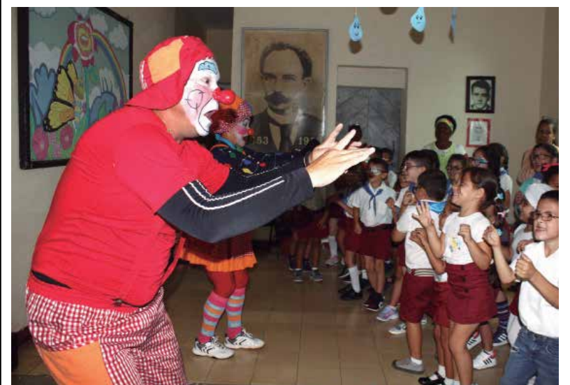
La tropa de Cambolo es siempre bien recibida por todos los públicos, principalmente los niños.

“Para el 2026 o 2027 queremos hacer la invasión de Occidente a Oriente. La idea es honrar la protagonizada por nuestros mambises cuando la Guerra Necesaria, que como sabemos fue a la inversa y, en segundo lugar, porque es una manera de desafiar cualquier contratiempo y demostrar que podemos lograrlo gracias a la unidad y pasión por el teatro”, concluye Pachy. (L. G. G.)