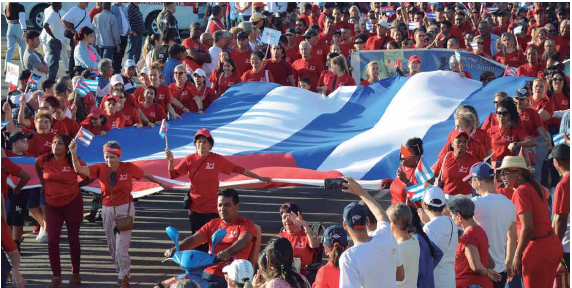
Los espirituanos respaldaron su apoyo a la Revolución.