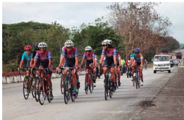
Las caravanas transitaban por carreteras de tres municipios: Cabaiguán, Taguasco y Sancti Spíritus.

Por eso, más allá de este o aquel ganador, el premio es colectivo para quienes hicieron posible que rodaran bicicletas y empeño. (E. R. R.)