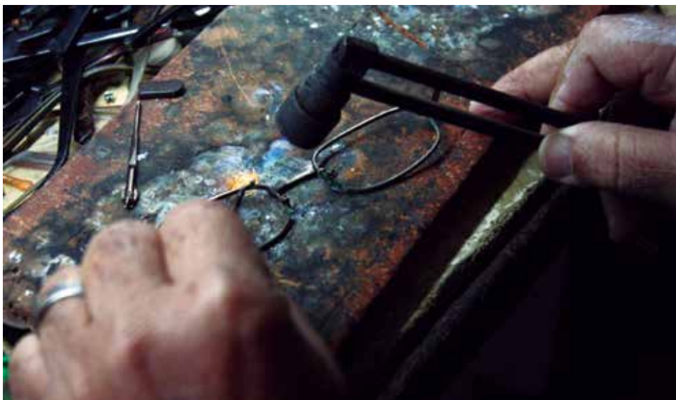
Si de alguna magia se puede hablar es de la recuperación y la inventiva.

Si hay algo bonito en este oficio es que ningún trabajo es igual a otro, mientras más difícil, más didáctico, más lo disfruto. El arreglo bien hecho es mi carta de triunfo y me considero un crítico de mi propio trabajo, cuando veo que algo no me salió, parto de cero otra vez. Nada es más gratificante que un cliente te diga: “Desde que vine con usted, más nunca he tenido problema con los espejuelos”.