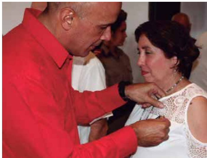
Las condecoraciones fueron entregadas en el contexto de las celebraciones por el Primero de Mayo.

En total fueron entregadas la Orden Lázaro Peña de II Grado a dos trabajadores van-