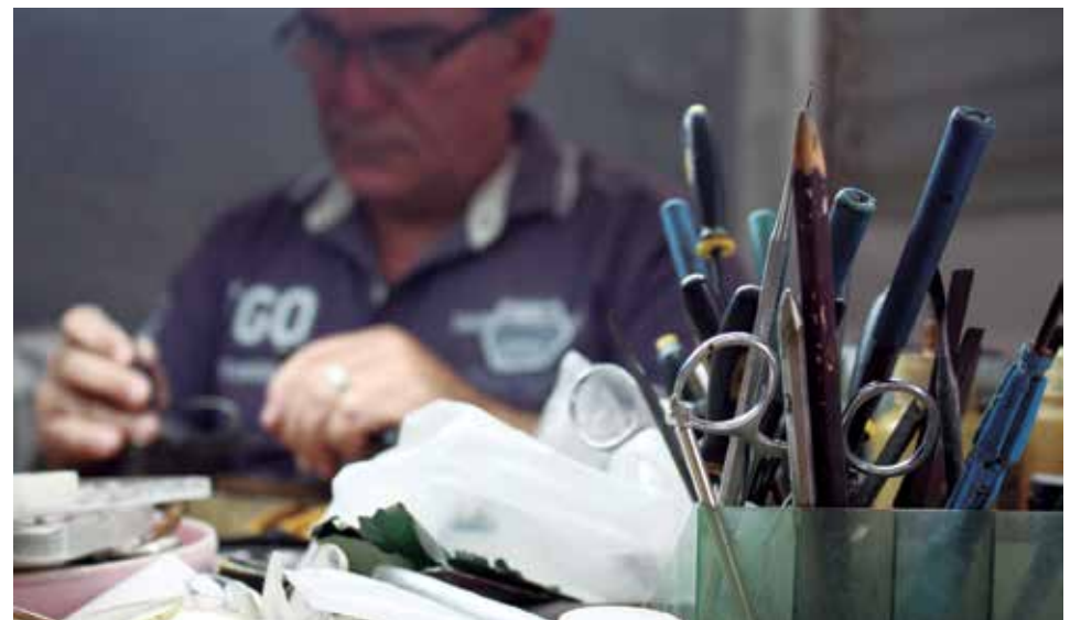
En el pequeño taller siempre hay solución para el desajuste.