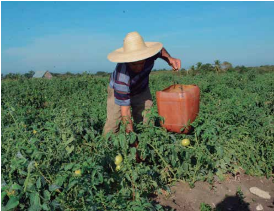
La producción de alimentos se incluye entre los temas más debatidos.