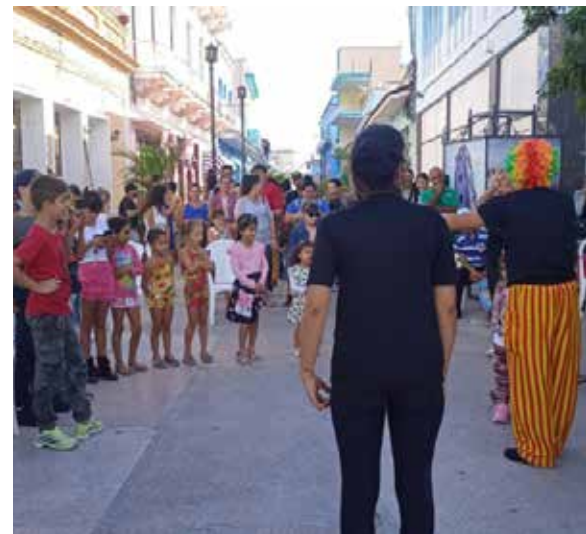
El Guiñol de Santa Clara hará suyo el bulevar de la ciudad del Yayabo.