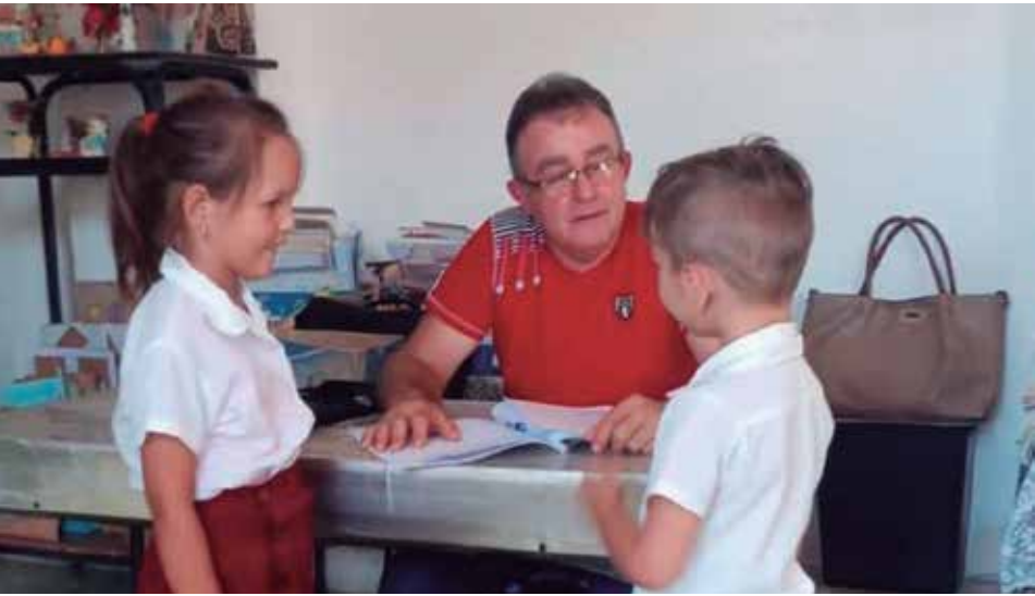
A lo largo de su vida laboral ha obtenido diversos reconocimientos, entre los que figuran las medallas Rafael María de Mendive y Pepito Tey.