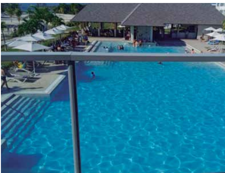
El hotel está en estos momentos a un 70 por ciento de ocupación.