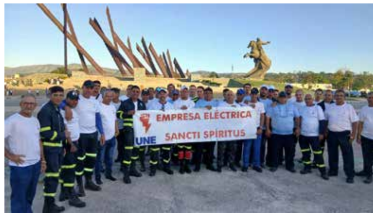
El grupo espirituano recibió el reconocimiento del pueblo santiaguero por su labor.

“La mayoría son muy jóvenes y por un momento pensé que no podrían porque para más de un 40 por ciento de ellos era la primera vez ante un trabajo tan intenso. No defraudaron al pueblo santiaguero y, por ejemplo, en Guamá, donde por tres días se trabajó con el agua a la cintura y