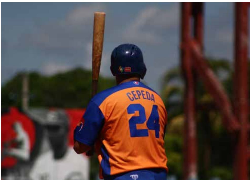
Su nombre suele ser el de un país.

Por su constancia, disciplina y consagración, la impronta del pelotero espirituario traspasa los confines de un estadio para convertirse en un ícono y referente social