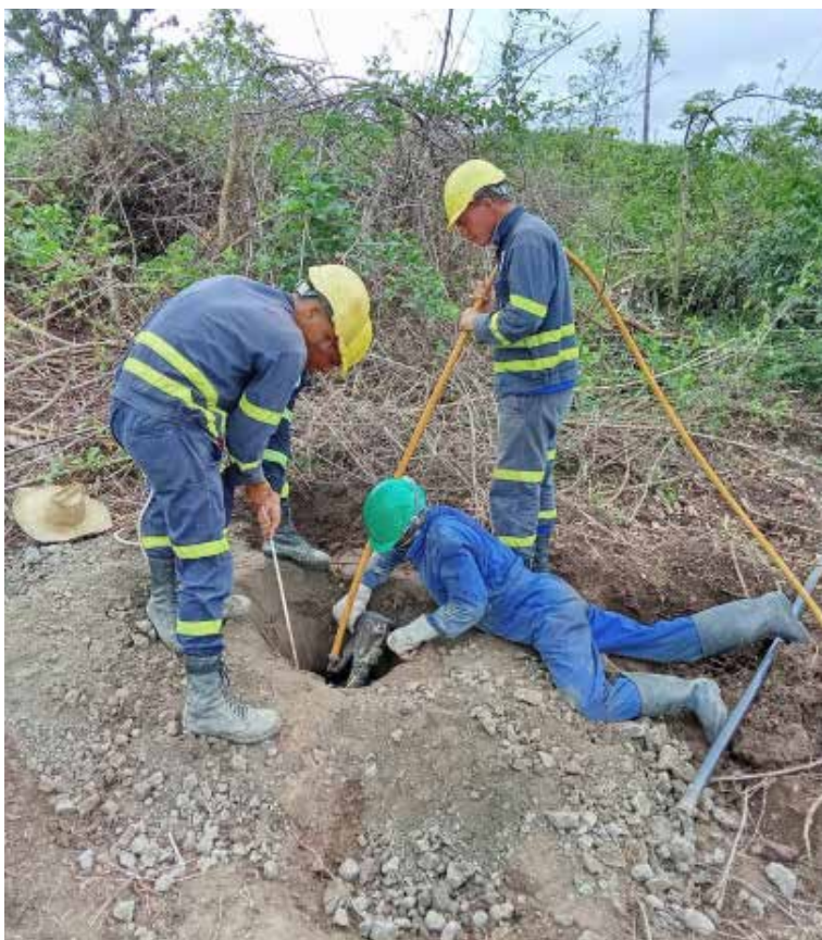
El contingente realizó labores de cambio de postes, muchos de ellos a mano.

Durante todo este tiempo, la consigna fue que todo el mundo era importante y que había que funcionar como un solo equipo; pero la marca del Serafín Sánchez fue la convicción de que sus compatriotas necesitaban la corriente en el menor tiempo posible y que su esfuerzo iluminaría el camino para muchos. En su misión los acompañó el deseo de hacer en cada jornada un poquito más y regresar a casa con el deber cumplido, sanos y salvos.