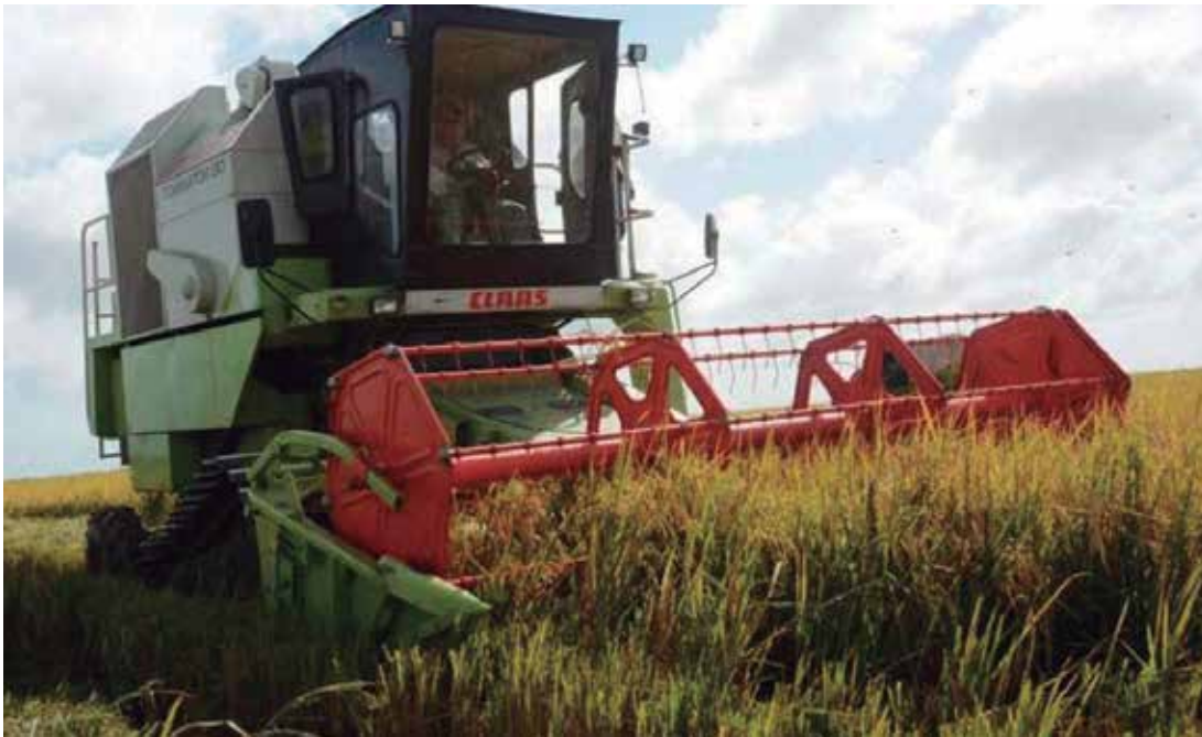
La empresa espirituana acumula probada experiencia en el cultivo del cereal.