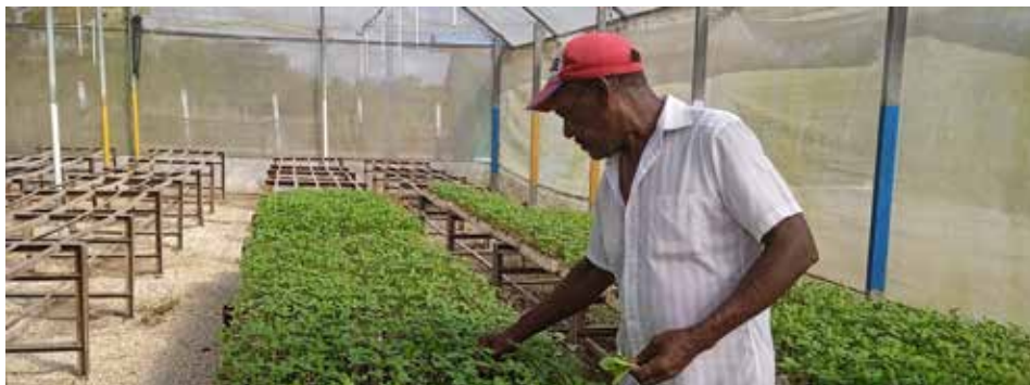
Unas 50 000 plantas nacidas a partir del grelo de papa crecen en La Quinta, como parte de un programa que por vez primera se aplica en este territorio.

Según el propio administrador, esta situación ya quedó resuelta y se pudo reanudar la siembra de tomate, col, lechuga, acelga y cilantro isleño, entre otros productos, algunos de los cuales comenzarán a cosecharse durante los días finales del año.