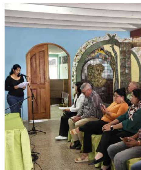
La inauguración de Ediciones UNISS Raúl Ferrer supone un sueño cumplido.