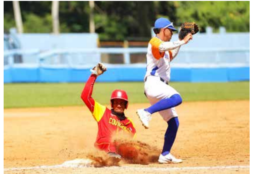
Los espirituanos han mostrado coraje y energía en el terreno.

“Me sorprendió completamente y, como es una cosa que disfruto, también disfruté de la noticia. Hay mucha gente que puede merecer eso porque se dedica al deporte o hace cosas por él sin ser del sector, pero me agradó porque al final si yo corriera y la gente no me acompañara no valdría la pena. Por eso los que me acompañan tienen una cuota en ese reconocimiento. Mucha gente me llamó, me felicitó”.