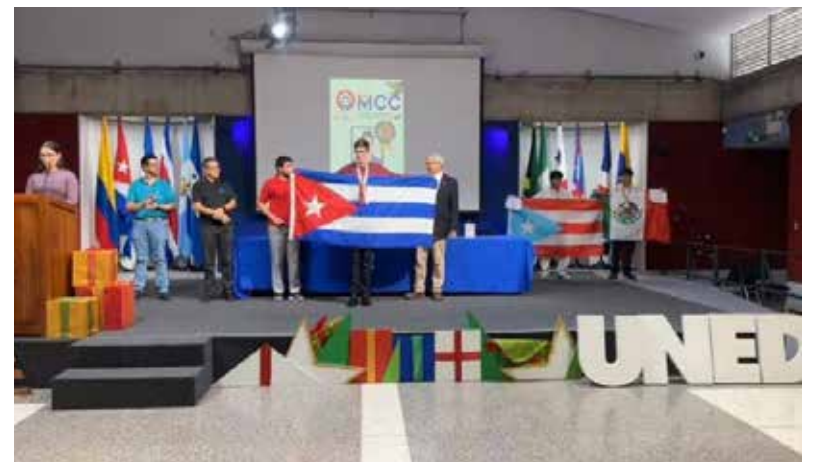
Los resultados también son un regalo para todos los educadores que han formado parte del proceso de preparación de estos jóvenes.

Ya los estudiantes espirituanos se alistan para el Ciclo Olímpico del próximo año, de cara a los concursos provinciales y nacionales que tendrán lugar a partir del próximo mes de enero con el objetivo de mantener y superar estos resultados para que Sancti Spíritus se mantenga a la vanguardia del país en este tipo de eventos.