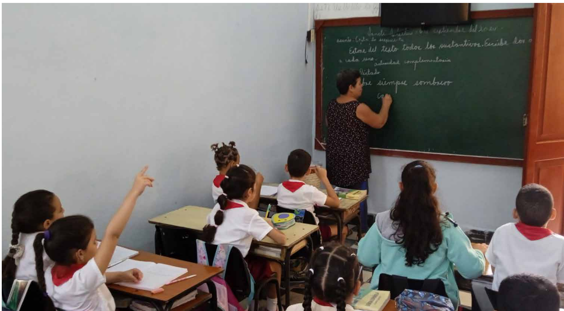
El aula es el sitio sagrado donde los educadores forjan a los profesionales del futuro.

En un curso escolar cuyo reto mayor ha sido el hecho mismo de mantener las instituciones educativas abiertas, los trabajadores docentes escriben cada día páginas de heroísmo que deberemos recordar siempre