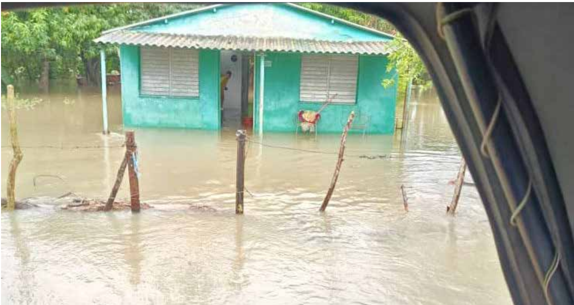
Las viviendas ubicadas en las zonas más bajas sufrieron las inundaciones más severas.