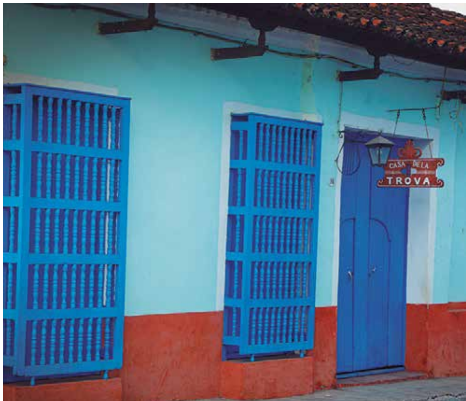
La programación de esta emblemática institución cultural ha mermado notablemente.

“No resulta fácil cuando solo cada dos semanas tenemos todo el tiempo servicio de electricidad. La planta que usamos para