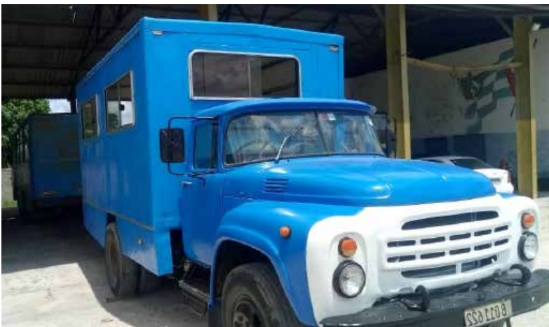
Muchos de los ómnibus recuperados ya prestan servicio en el traslado de pasajeros desde los municipios.

Igualmente, destacó que, como parte de este movimiento de recuperación, en el que resultan determinantes la labor y el sentido de pertenencia de los propios choferes, así como de los mecánicos, innovadores y demás personal de apoyo en las distintas bases, se logró rescatar ómnibus para el traslado de pasajeros en La Sierpe, Taguasco y Yaguajay, así como el coche motor que circula de Jatibonico a Jobo, entre otros medios.