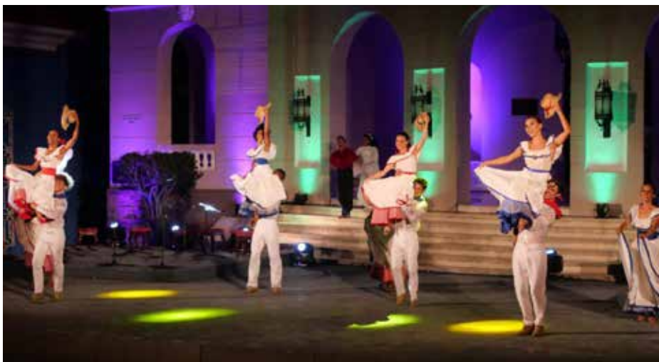
El impacto de la labor del gremio artístico fue reconocido.

cen como deudas y que integran las agendas del sindicato está el histórico impago a los músicos del catálogo espirituaño y el desfavorable estado constructivo del sistema institucional del sector.