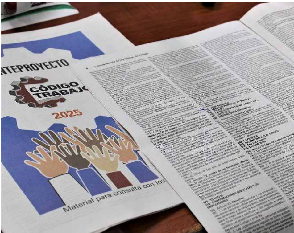
El documento ha sido debatido durante los últimos meses en los colectivos laborales de la isla.