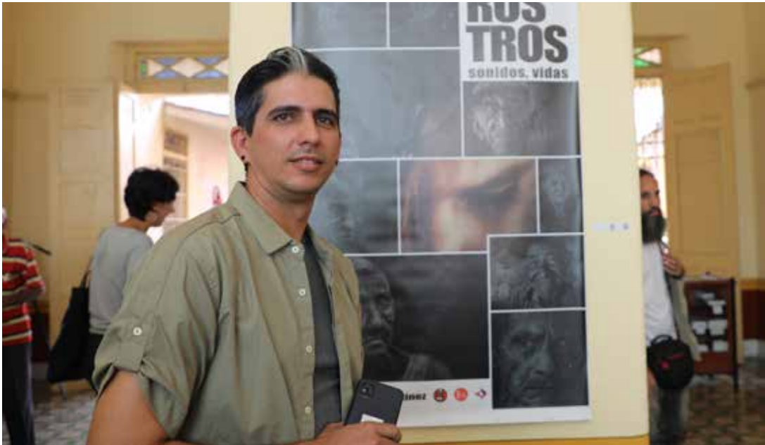
Rostros, sonidos, vidas es el estreno expositivo del reconocido realizador espirituaño.

Se lo propuso de esa forma el artista. A su paso por sitios diversos y cámara en ristre, hurgó en muchas de las diversidades cubanas: la memoria fresca tras el paso del huracán Ian por San Luis, fragmento occidental de Cuba; miradas perdidas en las horas desde un parque y portal en San Pedro, la algarabía en Tuinucú mientras los azucareros hacen historia también en su estadio de pelota, la sabiduría campesina de hacer parir la tierra a fuerza de guataca y recursos naturales, el tributo a las deidades legadas de los antepasados arrancados de África, la música de hoy y de siempre, aunque la conga que late en el barrio yayero de