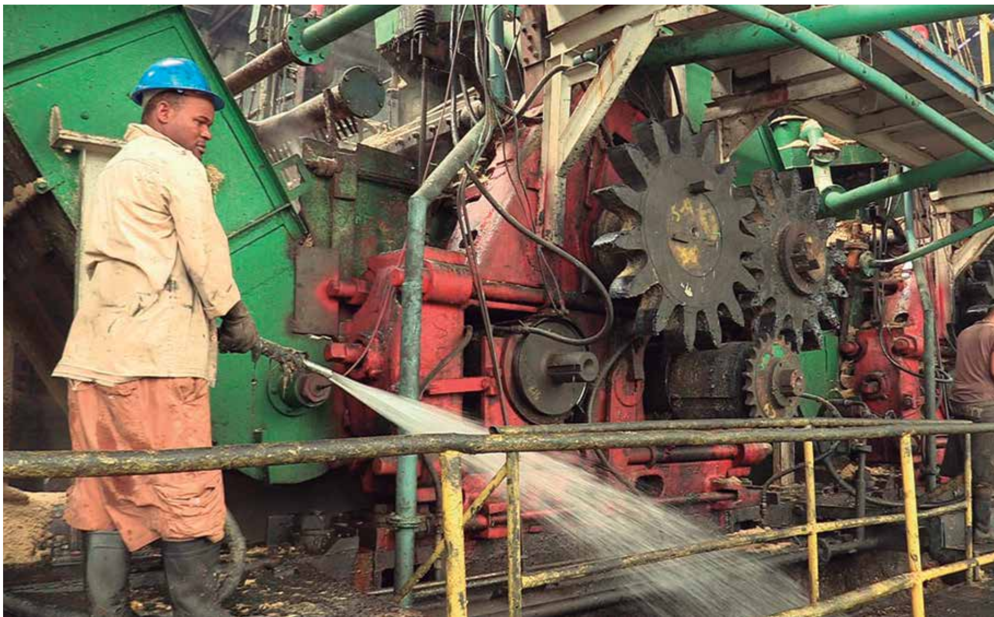
La calidad de las reparaciones resulta vital en esta etapa para la industria de Tuinucú.