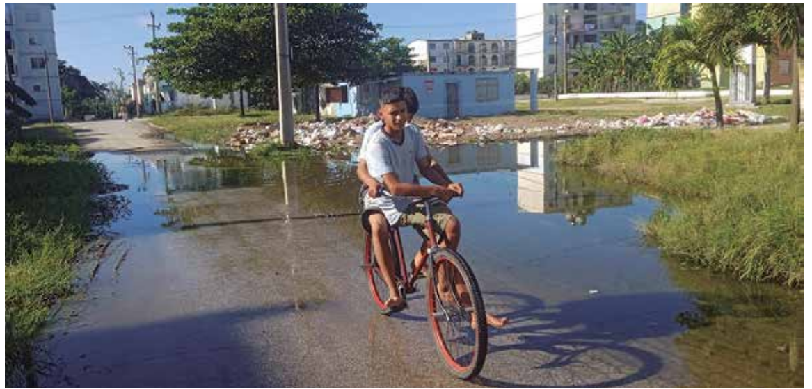
El agua potable corre por las calles y se estanca en el sitio donde está el microvertedero.

La vicedirectora de Asistencia Médica llamó a la población a asistir al médico oportunamente y redoblar las medidas de protección, en particular con los grupos más vulnerables como los ancianos solos y los menores de dos años.