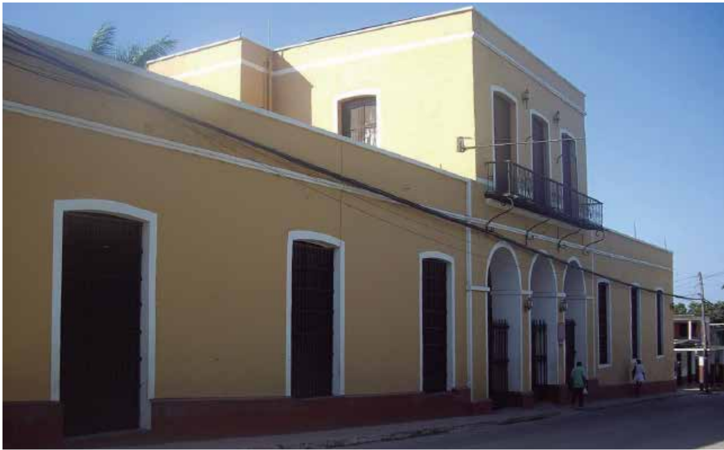
Así permanece, erguida y desafiante al tiempo, una de las cárceles más antiguas de Cuba.

Una de las cárceles más antiguas de Cuba se mantiene a buen recaudo en medio de una ciudad orgullosa de su patrimonio