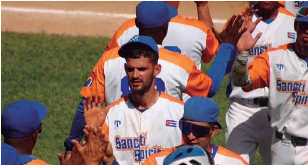
Los espirituanos esperan que pueda concretarse la clasificación para coronar una buena campaña.