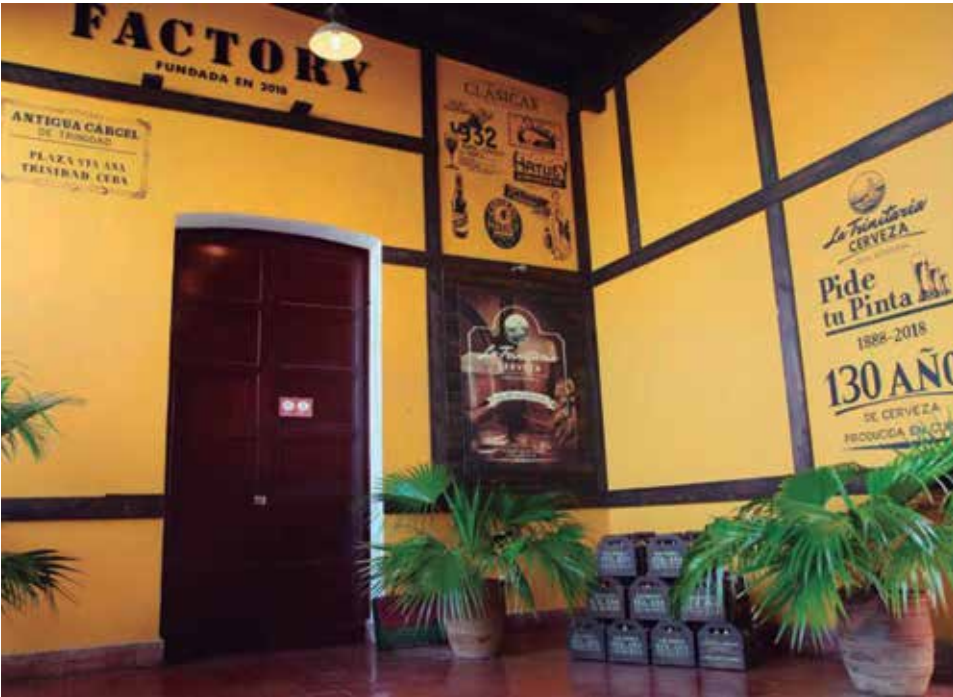
La instalación alberga actualmente la fábrica de cerveza La Trinitaria y espacios de recreo.