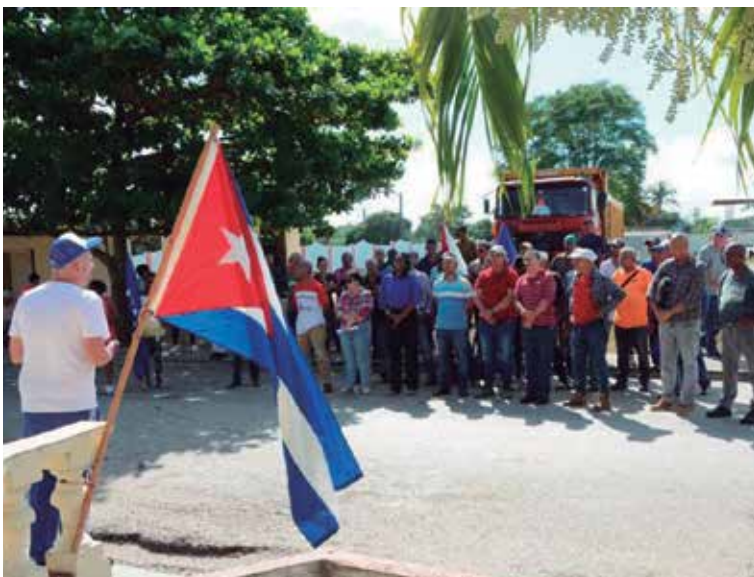
Luego de 30 días de apoyo a las labores de recuperación, los constructores espirituanos regresan a su tierra.