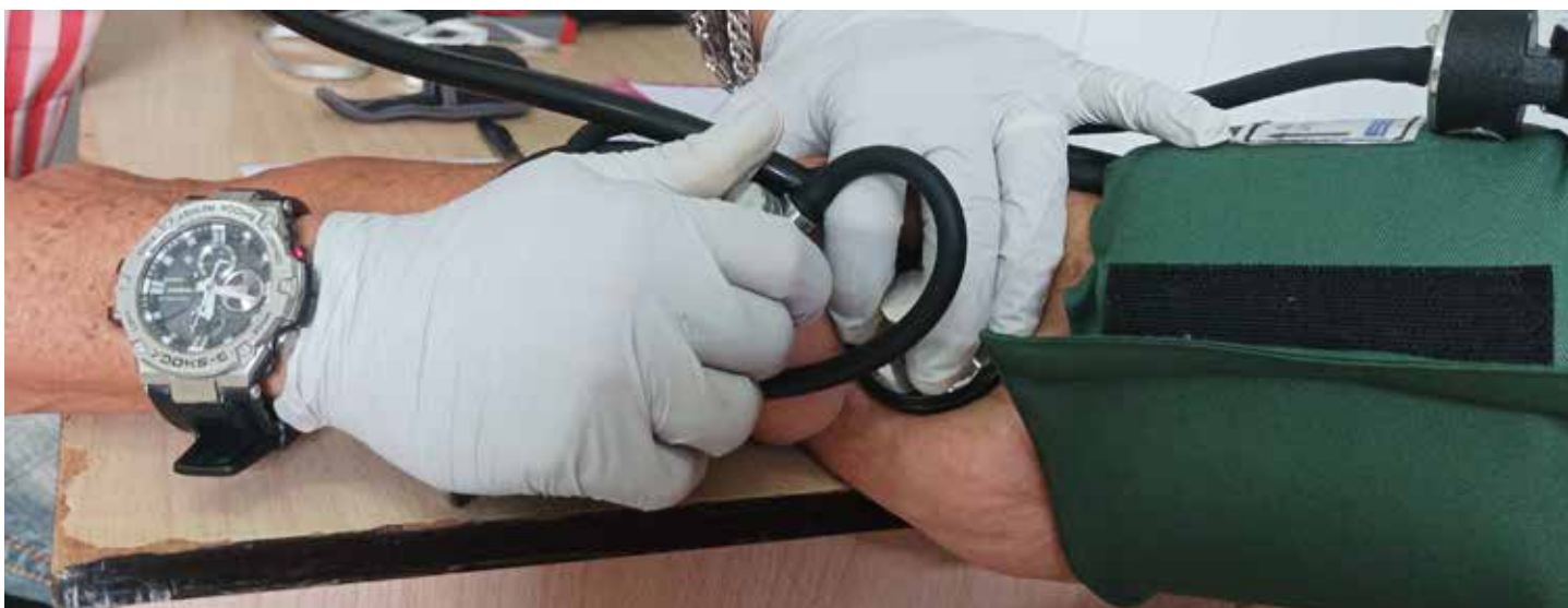
“Ninguna profesión tolera la mediocridad; pero la Medicina mucho menos”, sostiene este médico espiritano.

Tiene que ser así. He salido de una guardia y he tenido que ir con un médico de la familia a ver un electro de un paciente; de regreso, me he bajado de un carro y así, lleno de tierra, he tenido que ir para el policlínico porque me han llamado para atender una urgencia. En ese momento, claro está, no puedo decir que vengo cansado. Otras veces ando con la vestimenta de campo y así mismo tengo que venir. Es la profesión que elegimos. Te lo dice aquel muchacho que salió de la Cueva del Humo, Kilo-12, y se hizo cardiólogo.