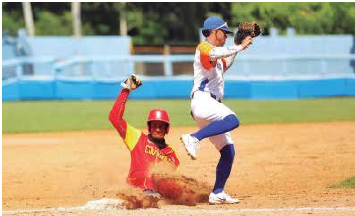
En la batalla de los pronósticos frente a los Cocodrilos, los augurios no favorecen a los Gallos, pero habrá pelea en el terreno.

“Forzada” a cumplir mi cometido profesional, en materia de pronósticos, no considero que puedan pasar esta prueba, aunque me inclino por que puedan dar ese gran play off que deje al menos complacida a buena parte de la afición.