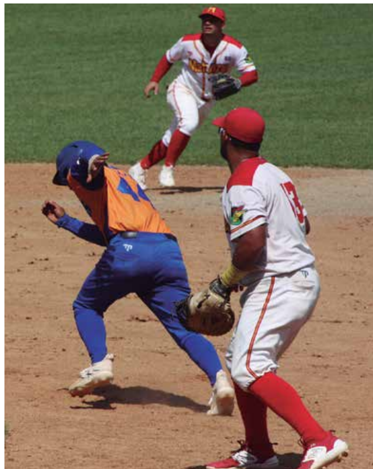
El play off es una miniserie aparte, donde se borran los números y entran a jugar otros factores.

Con la bola de cristal en contra, no concuerda con los criterios con-