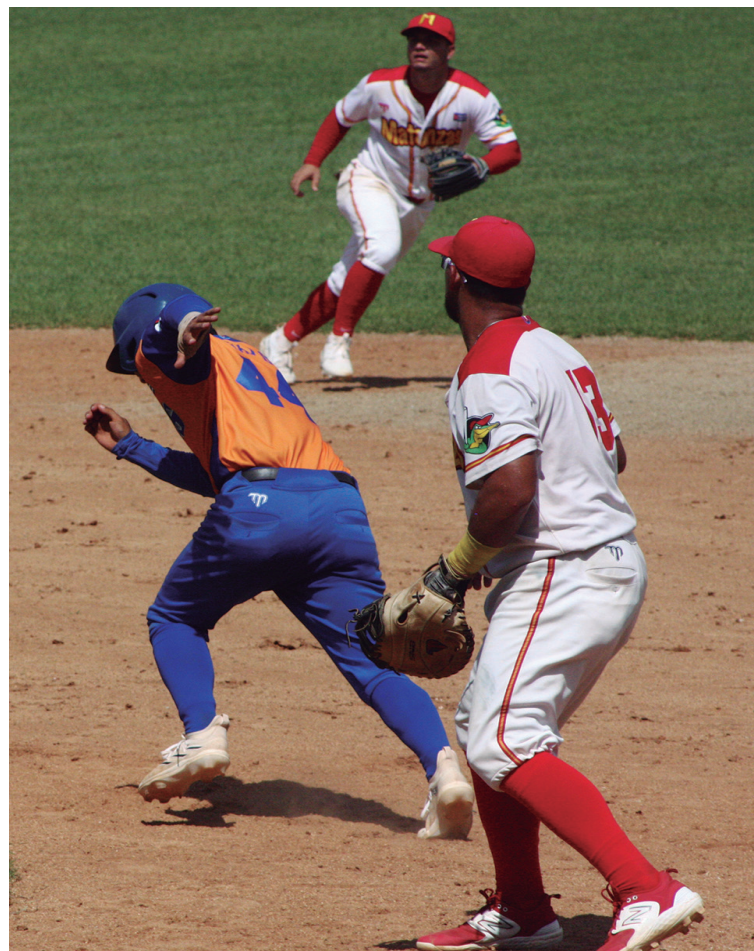
El play off es una miniserie aparte, donde se borran los números y entran a jugar otros factores.

Con la bola de cristal en contra, no concuerda con los criterios con-