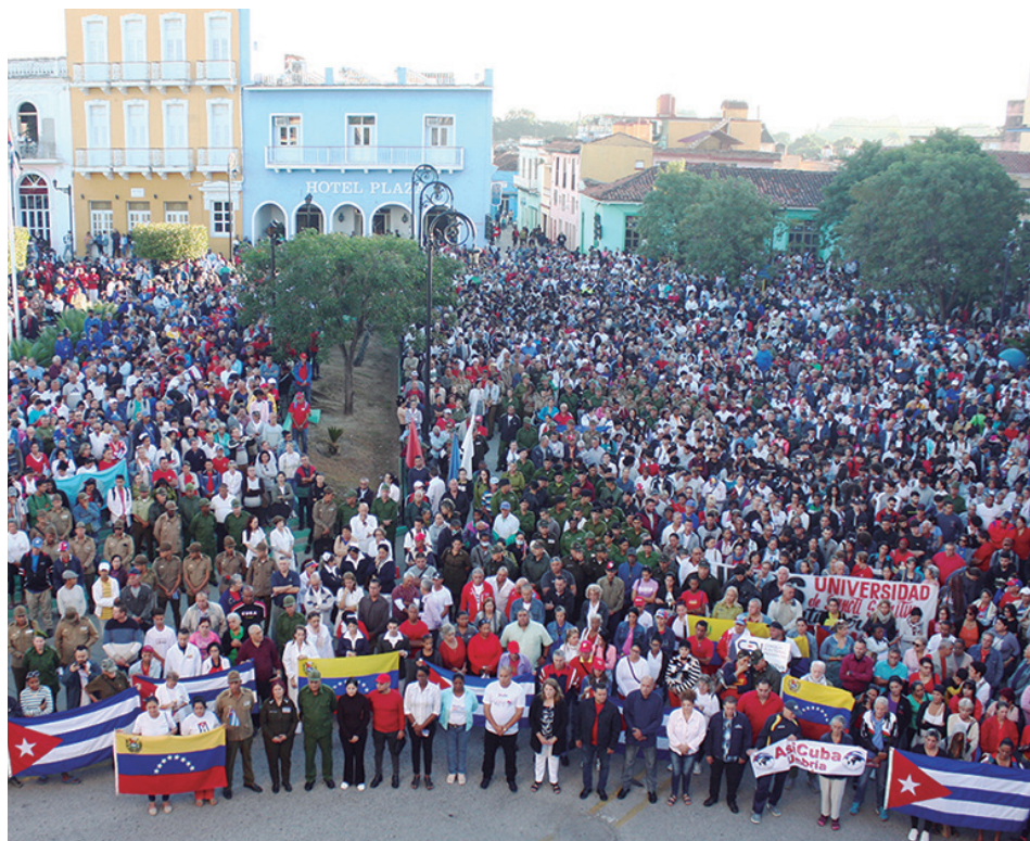
Miles de espirituanos se dieron cita en el parque Serafín Sánchez para denunciar la agresión contra el hermano pueblo de Venezuela.

“Una vez más el gobierno de los Estados Unidos usa pretextos falsos para justificar una agresión militar; esta vez contra Venezuela, con el objetivo de apropiarse de sus recursos petroleros —asegura—. Desde Sancti Spíritus, como en toda Cuba, exigimos