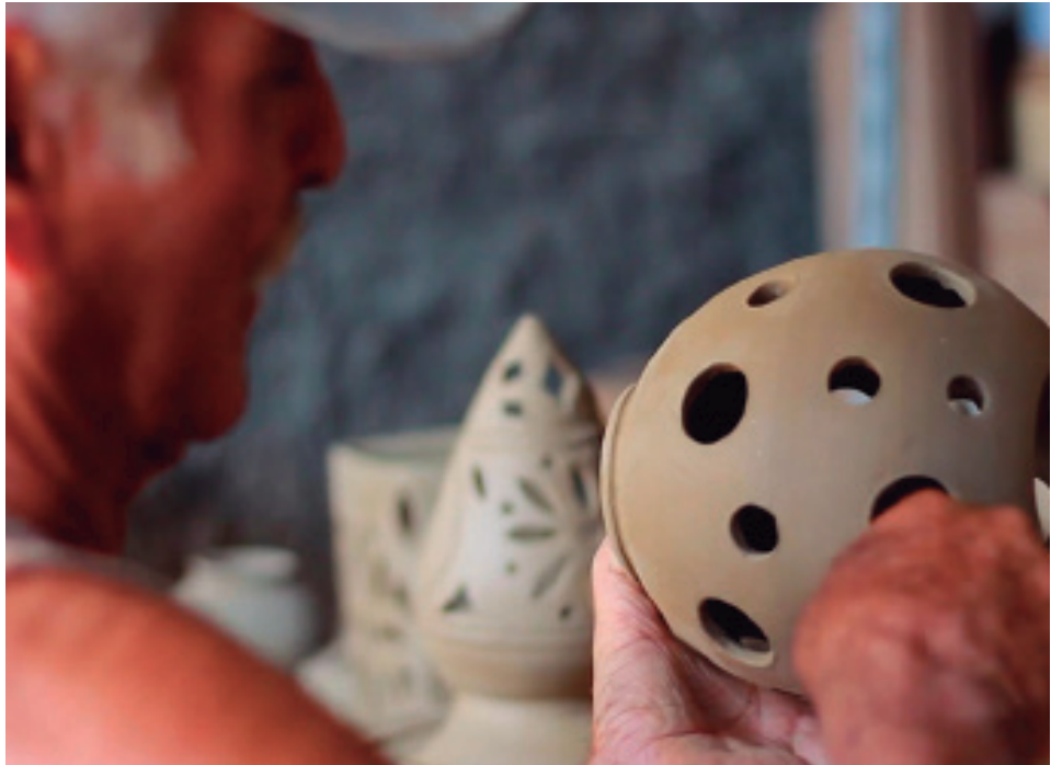
La ciudad se precia de su artesanía y sus tradiciones.

Son ellos los verdaderos cronistas, los que aseguran que esta ciudad-museo, esta ciudad-leyenda, siga contando su historia al mundo, piedra a piedra.