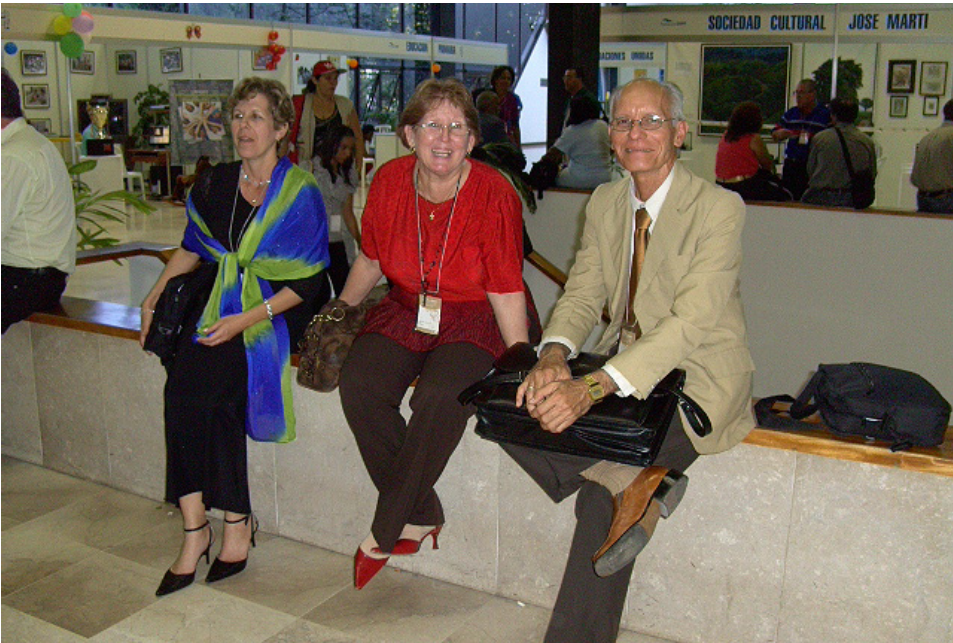
Al magisterio le ha dedicado sus mejores energías y ha sido recompensado con el aprecio de alumnos y compañeros de trabajo.

Entre los múltiples reconoci- mientos que atesora, sobresalen el Premio al Mérito Científico, las medallas José Tey y Frank País y la Distinción por la Educación Cubana, así como otros recono- cimientos institucionales, minis- teriales y de carácter nacional.