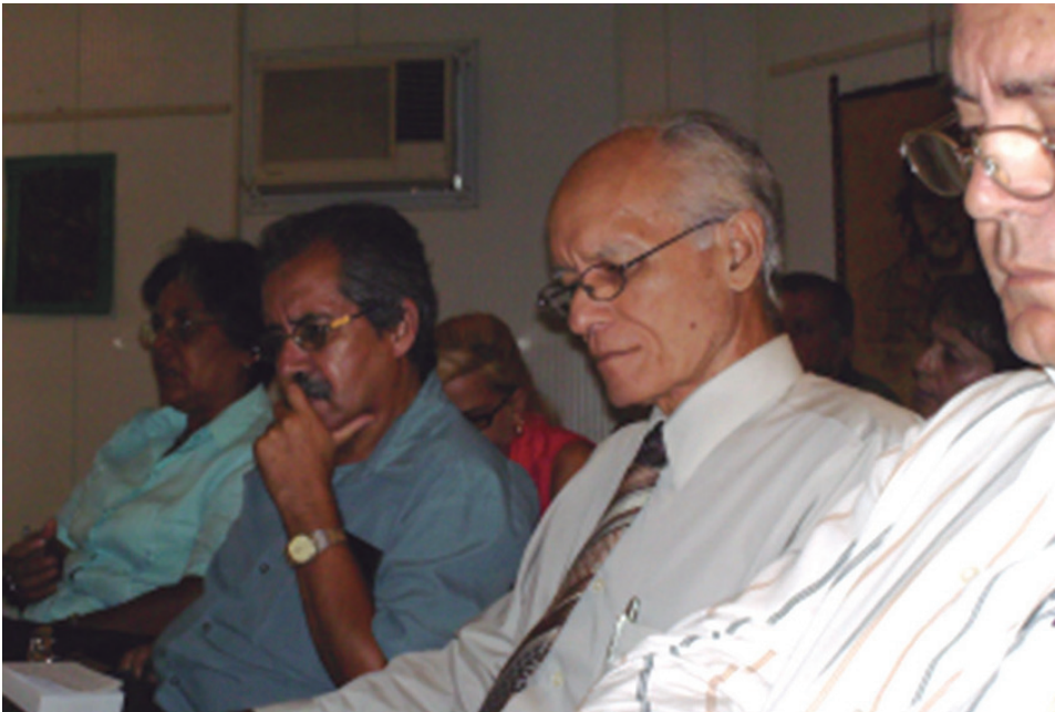
Durante su prolífica carrera ha participado en numerosos eventos científicos nacionales e internacionales.