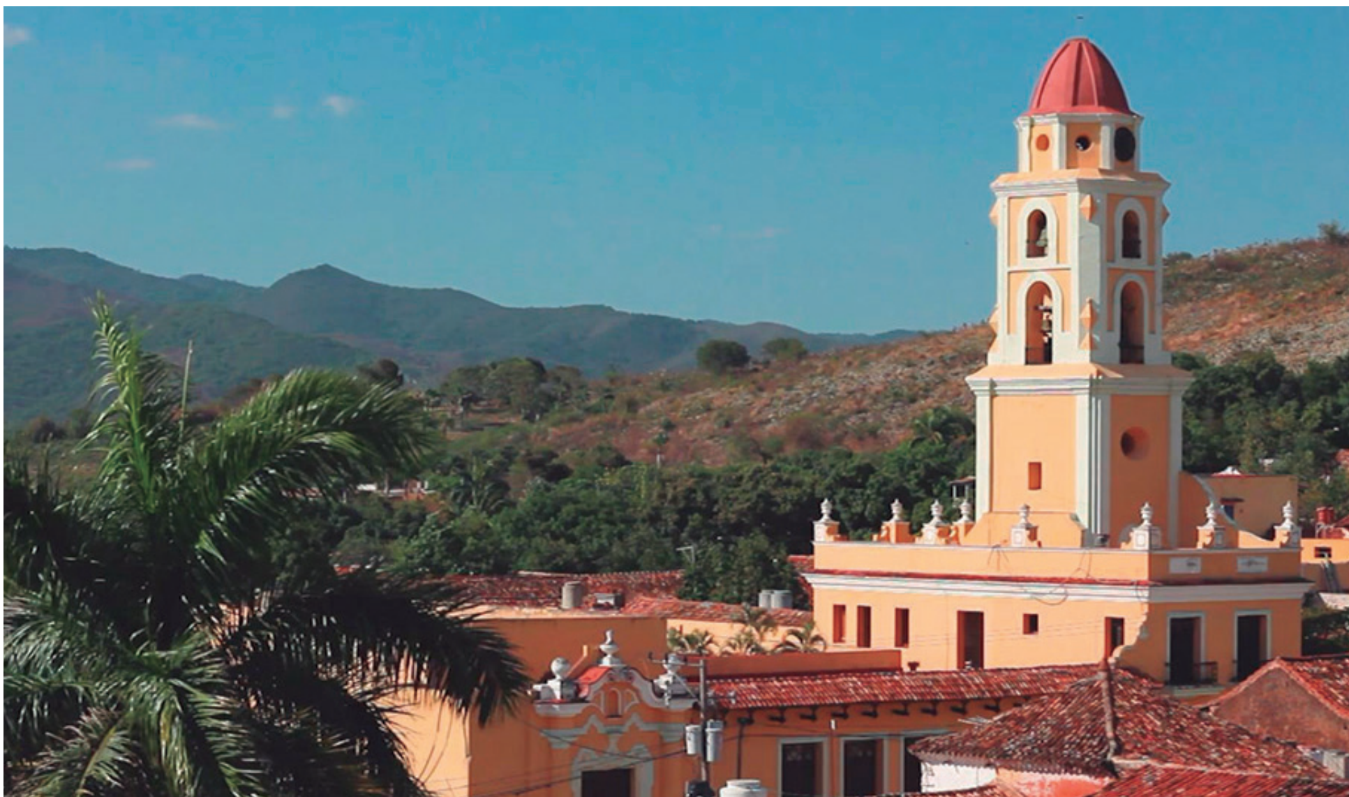
Con más de cinco siglos de historia, Trinidad preserva de un modo único sus valores patrimoniales.