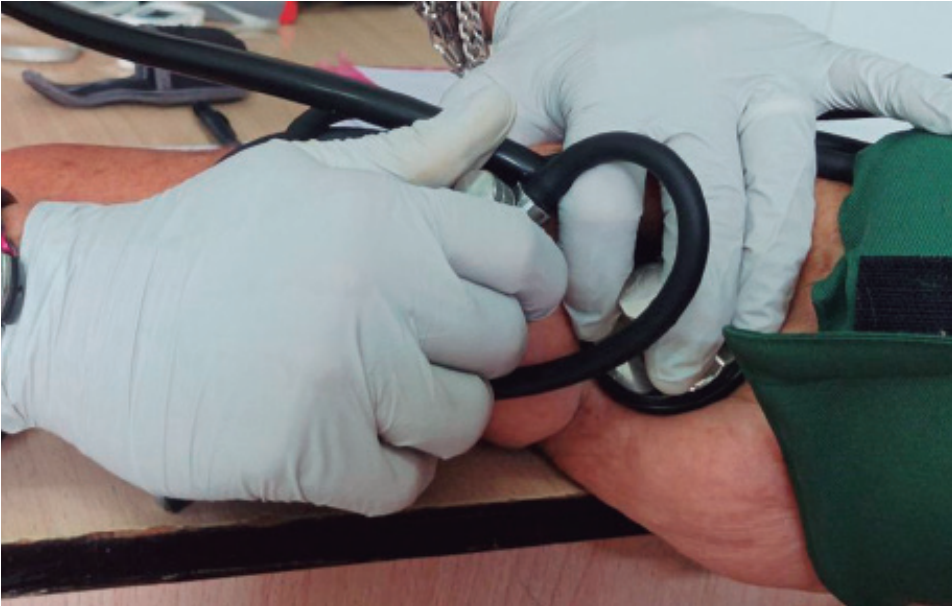
Atendiendo a las condiciones específicas de cada territorio, algunos profesionales ya retomaron sus funciones habituales.

La funcionaria indicó que, atendiendo a las condiciones específicas de cada territorio, algunos profesionales ya retomaron sus funciones habituales, mientras que otros permanecen