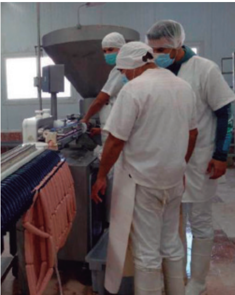
El acto nacional se celebrará el próximo 25 de enero en la Empresa Cárnica de Sancti Spíritus.

Ciego de Ávila será distinguida como provincia destacada y Cienfuegos recibirá un reconocimiento especial que será otorgado por el Secretariado Nacional del SNTIAP.