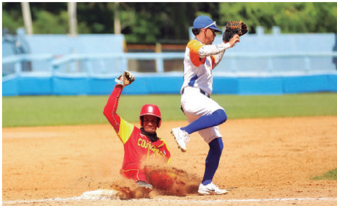
En la batalla de los pronósticos frente a los Cocodrilos, los augurios no favorecen a los Gallos, pero habrá pelea en el terreno.

“Forzada” a cumplir mi cometido profesional, en materia de pronósticos, no considero que puedan pasar esta prueba, aunque me inclino por que puedan dar ese gran play off que deje al menos complacida a buena parte de la afición.