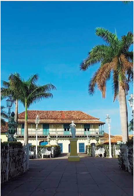
Su peculiar patrimonio arquitectónico perdura y seduce.