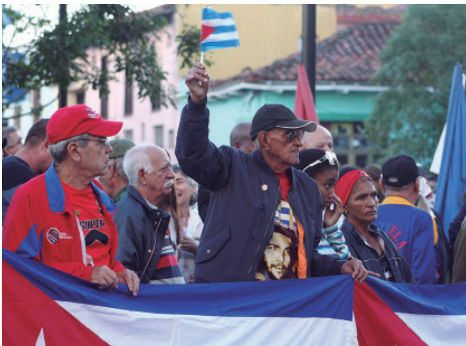
Las muestras de apoyo a Venezuela son palpables en las redes sociales y escenarios físicos de Sancti Spíritus.

Al cierre de este reporte, continuaban las muestras de apoyo a Venezuela en las redes sociales y escenarios físicos de Sancti Spíritus, una provincia que, como el resto de Cuba, ha sido un puntal en las misiones sociales desarrolladas en los más intrincados parajes de la geografía venezolana.