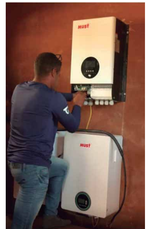
La autonomía energética es uno de los pilares del programa de reanimación para la comunidad.