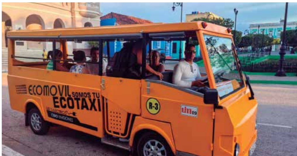
Con las actuales limitaciones del transporte urbano, los microbuses eléctricos han asumido un rol protagónico.