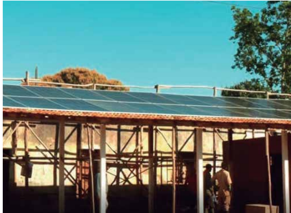
Las labores avanzan en la emblemática edificación de Manaca Iznaga.

En lo que fue la antigua enfermería de esclavos de uno de los ingenios con mejores zafras y ganancias de la industria azucarera cubana recupera su prestancia un edificio testigo de un capítulo trascendental de la historia de la esclavitud y que una vez restaurado, contribuirá a la educación, sensibilización y formación de