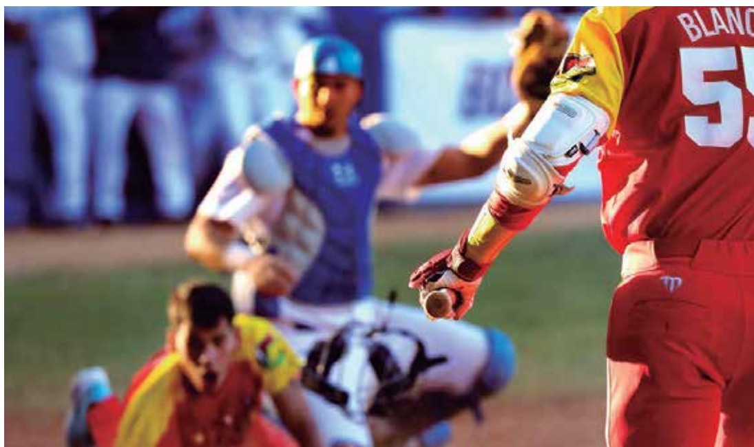
No pocas emociones regaló el principal torneo beisbolero de la isla.