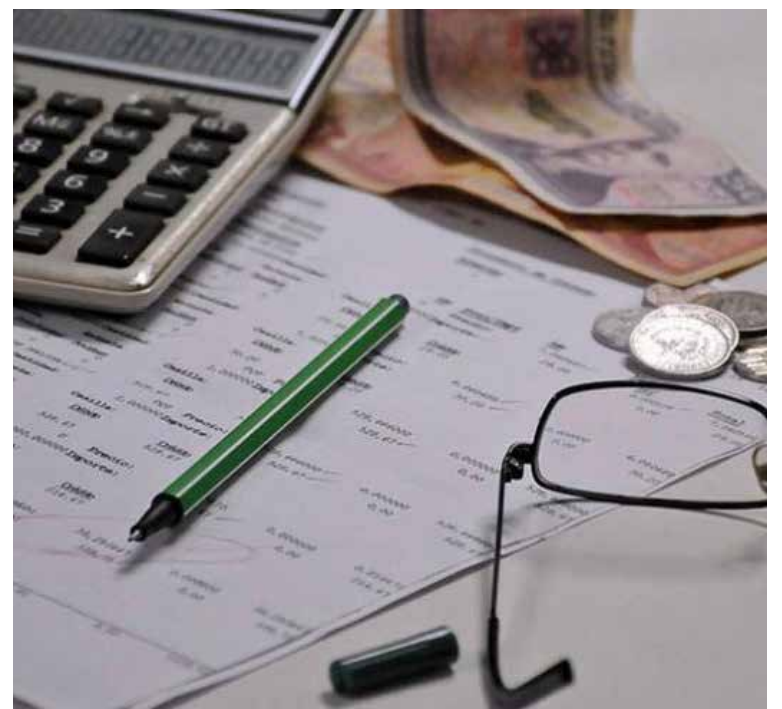
Las nuevas disposiciones legales persiguen que todos los contribuyentes cumplan con sus aportes.

A pesar de la escasez de auditores y fiscalizadores, que limita un mayor despliegue de los controles fiscales, en el 2025 se determinaron 460 millones de pesos de deudas en la provincia.