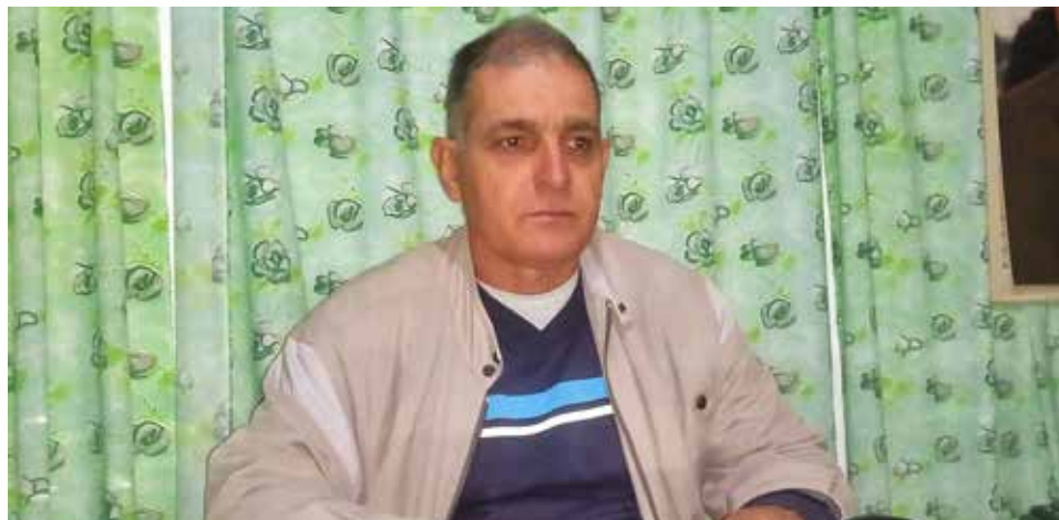
“En esta escuela he estado siempre”, asegura.