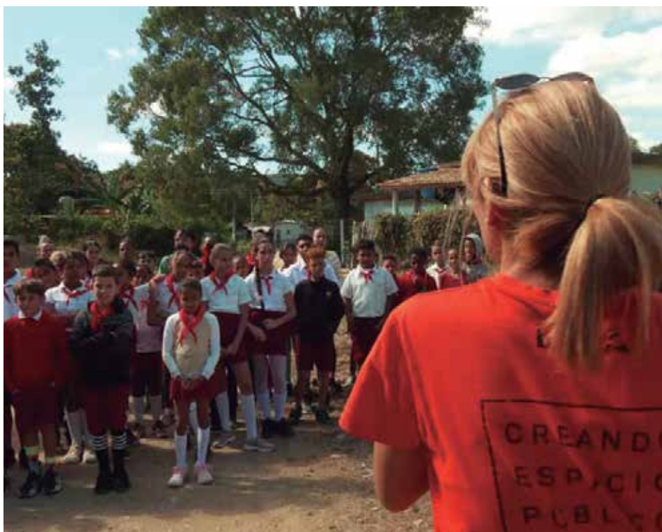
Para los niños de la escuela primaria Pablo Pérez Cabrera el proyecto ha traído también singulares beneficios.

En Manaca Iznaga se vale soñar en grande; las primeras luces del renacer de un edificio que se sacude del olvido ya comienzan a brillar y sostienen los cimientos de la memoria que se abraza al futuro.