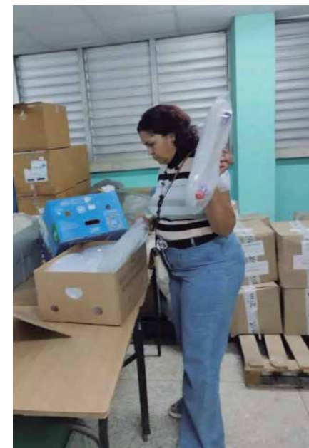
La ayuda incluyó material gastable e insumos para la asistencia médica.

La organización solidaria Cuba Sí, grupo de trabajo del Partido La Izquierda (Die Linke), de Alemania, ha colaborado en ocasiones anteriores con el área materno-infantil del Camilo Cienfuegos.