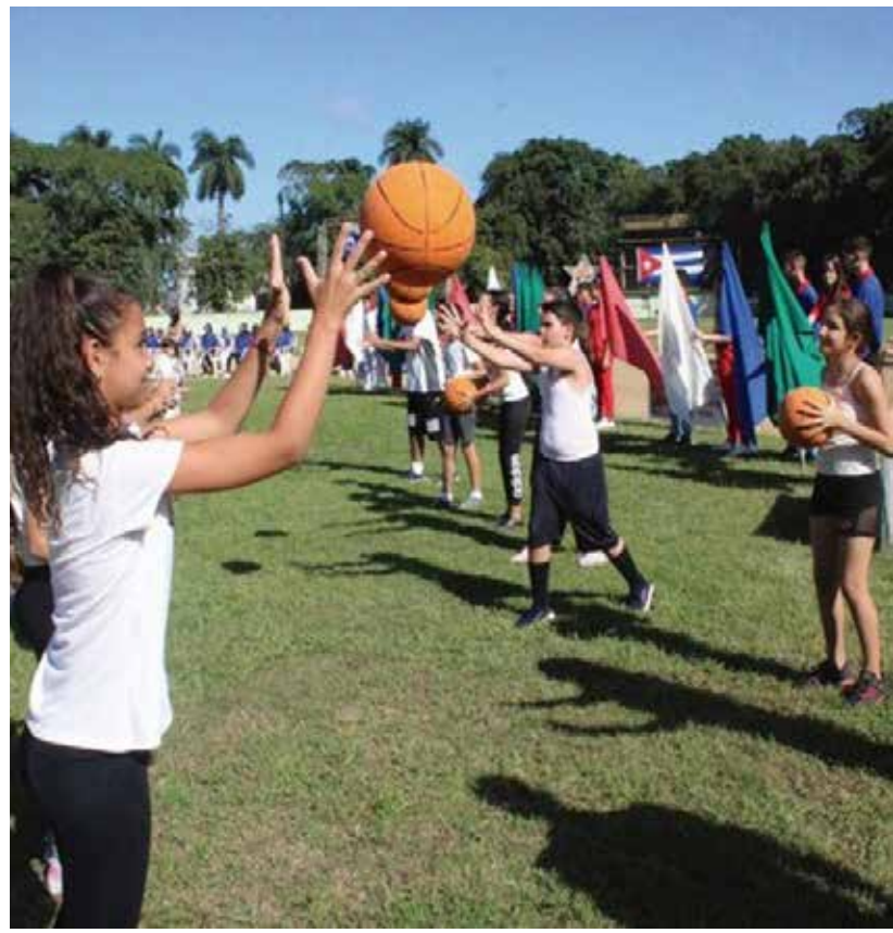
En la provincia se promueve la práctica sistemática de ejercicio físico.

Según la fuente, también se busca aumentar desde los combinados deportivos el desarrollo de los torneos y copas interbarrios, principalmente aquellos en condiciones de vulnerabilidad y del Plan Turquino. (E. R. R.)