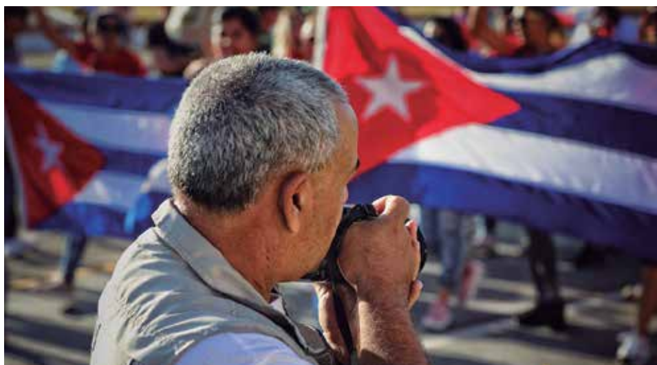
Oscarito ha laborado como periodista y fotógrafo en varios medios de prensa.