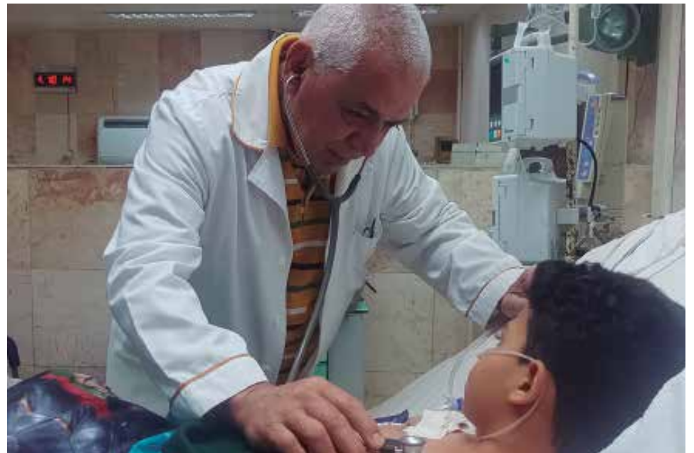
La terapia intensiva del Pediátrico espiritua sobresale por el alto nivel de especialización del personal médico y paramédico que allí labora.

De acuerdo con la literatura médica, el derrame pleural paraneumónico se clasifica como