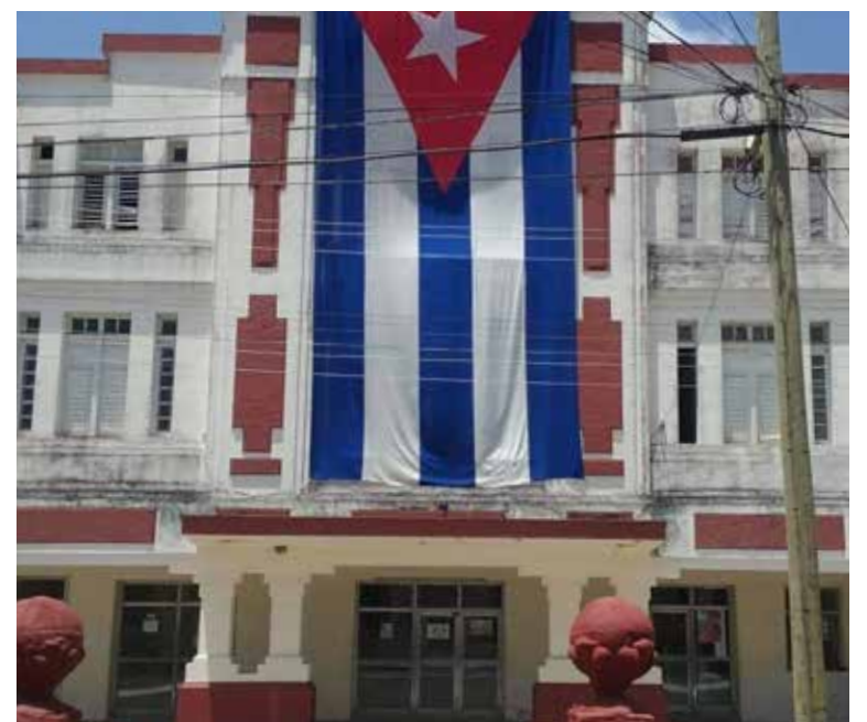
La fachada de la institución fue pintada en el mes de diciembre.

“En el caso de los de Fomento y Trinidad se conservan bien. Por tanto, no hubo que hacer nada. Todos los colectivos conocen que deben resguardarse y protegerse para evitar que se pierdan las condiciones actuales”, concluyó. (L. G. G.)