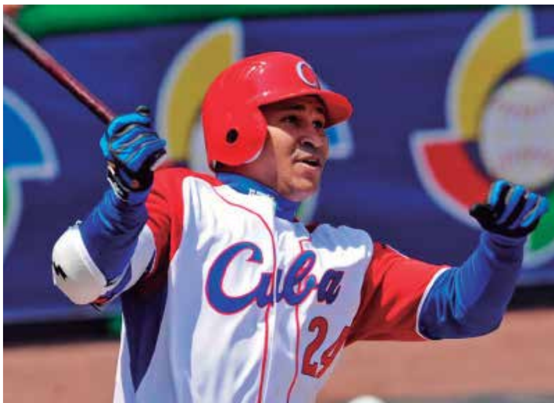
Cepeda sigue siendo leyenda del béisbol cubano.