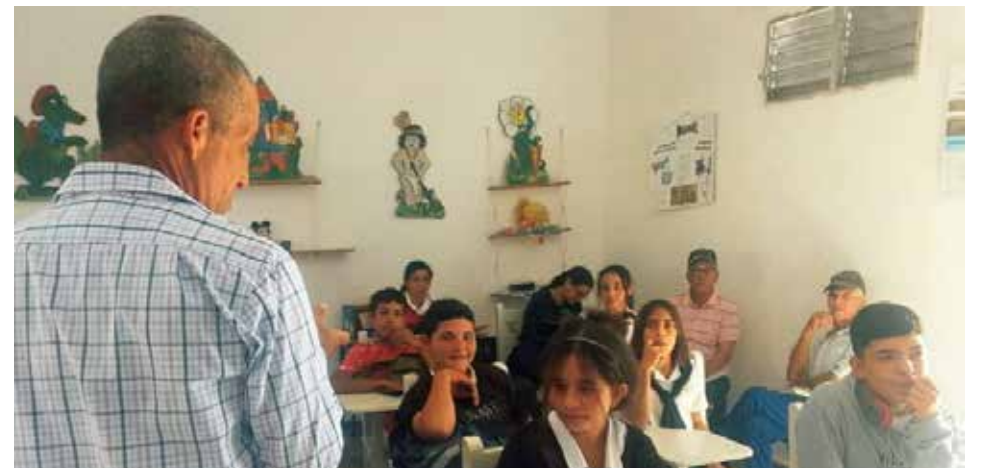
Los maestros de la escuela Ismaelillo asumen el reto de impartir clases para otro nivel de enseñanza.