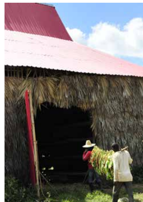
Los estímulos en Moneda Libremente Convertible han contribuido al despegue tabacalero.