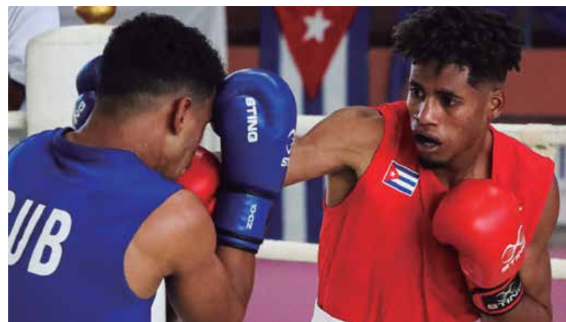
Claro es uno de los mejores púgiles espirituarios del momento.

Cuba tiene la intención de incluir a un equipo completo para la cita dominicana, que tendrá lugar del 24 de julio al 8 de agosto. (E. R. R.)