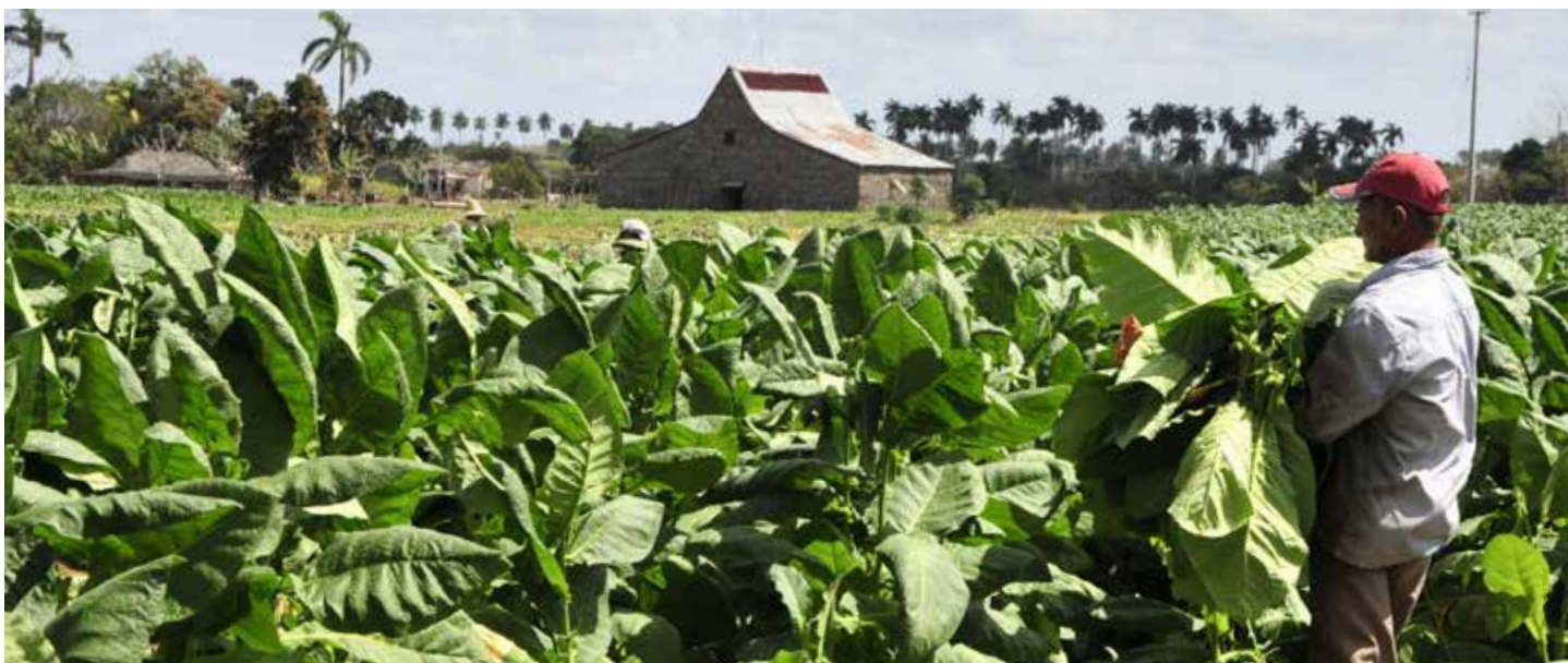
Los productores espirituanos aseguran mayor rendimiento de sus cultivos.