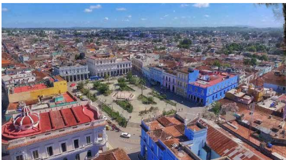
Asumir la conservación y el diálogo con los paisajes culturales de la cuarta villa de Cuba resulta prioridad.

Con la mirada fija en el área que bordea el frente de la Iglesia Parroquial Mayor de la cuarta villa de Cuba están los especialistas de la Oficina del Conservador de la Ciudad de Sancti Spiritus.