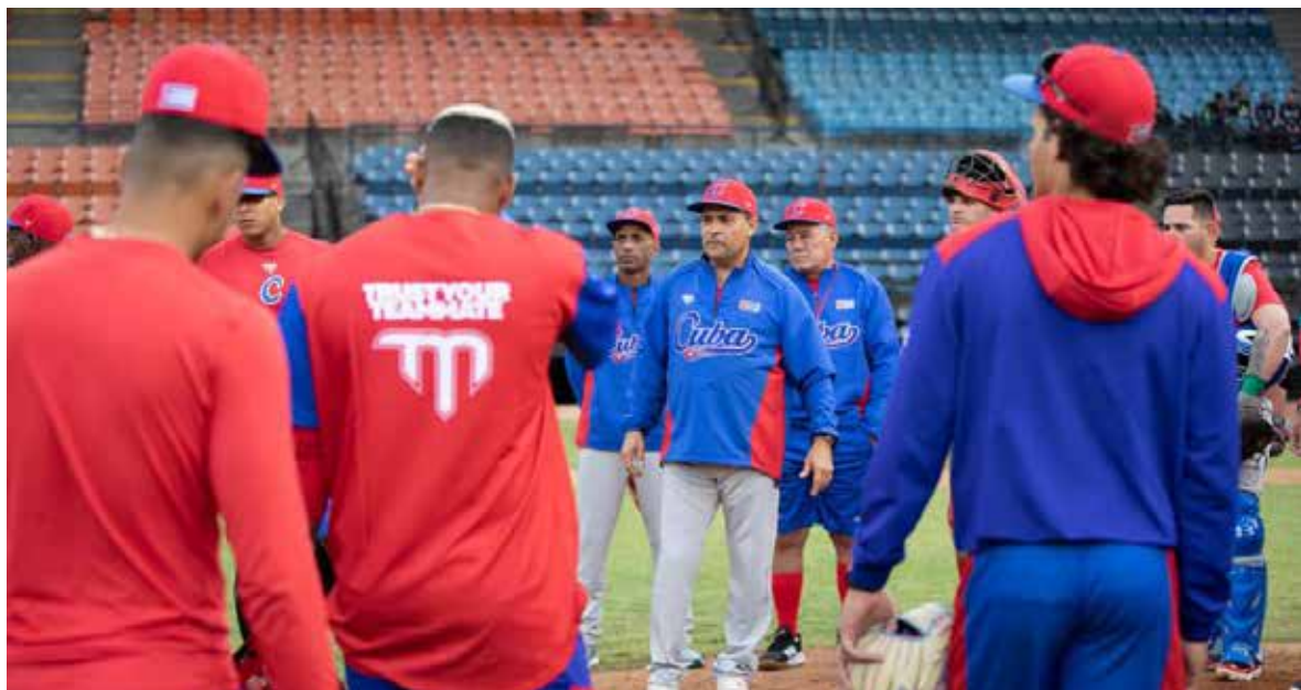
El conjunto cubano tiene ante sí un gran desafío.