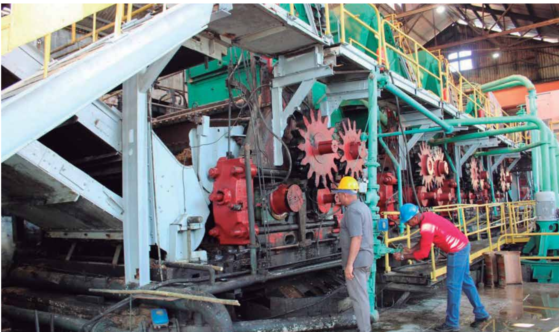
Todos los indicadores de eficiencia han ido mejorando.