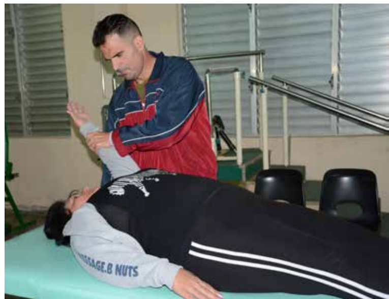
El chikungunya deja varias secuelas, refieren los pacientes.