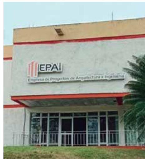
La entidad ha demostrado sus competencias profesionales.

En el 2019, la Empresa de Proyectos de Arquitectura e Ingeniería de Sancti Spíritus