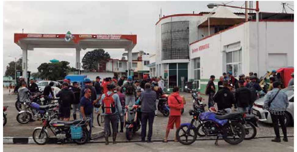
La insuficiencia de combustible genera largas colas en los servicerios.

Especificó que en estos momentos no existe ninguna garantía para los portadores privados vinculados a la transportación de pasajeros, pues “solamente se está priori-