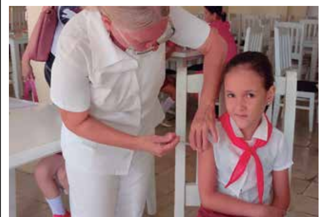
La vacuna Cecolin bivalente protege contra los serotipos 16 y 18 del Virus del Papiloma Humano.

La vacuna contra el VPH formará parte del Programa Nacional de Inmunización de Cuba y fortalecerá la capacidad del sistema de salud para reducir la incidencia de enfermedades prevenibles por esta infección.