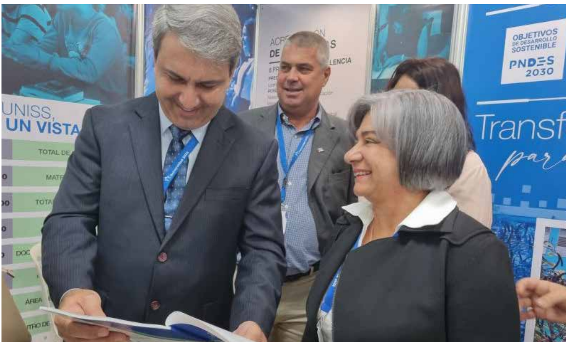
La también Premio de Innovación Provincial del Citma en cinco ocasiones ha publicado artículos científicos en revistas de impacto y dos libros en calidad de coautora, además de participar en más de 40 eventos nacionales e internacionales.

“Es un tributo no solo a mi trabajo, sino a todo mi equipo del CEEPI y a la UNISS por su constante apoyo; no es un final, sino un renovado compromiso para continuar investigando, enseñando y contribuyendo al progreso. Es un motivo de profundo orgullo personal, familiar y para la institución a la que represento”.