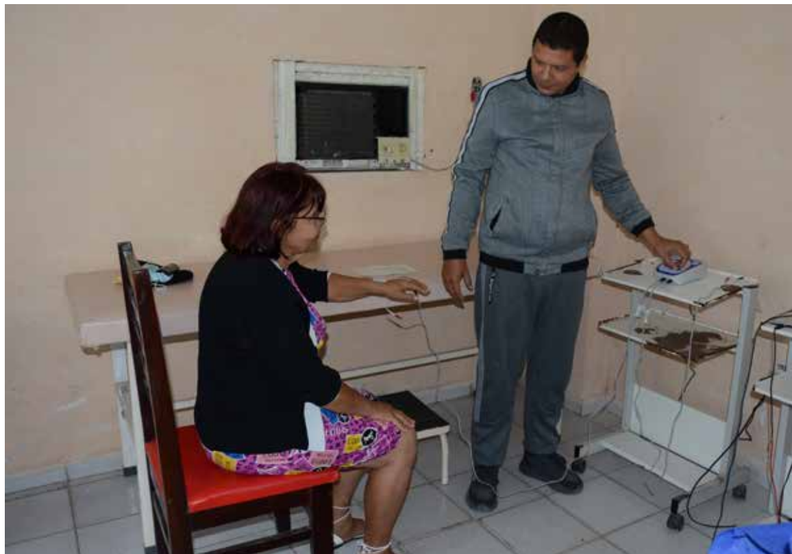
Las salas de Fisioterapia contribuyen a aliviar las dolencias causadas por el virus.

centro asistencial específico donde se brinde una consulta multidisciplinaria para la atención directa a estos pacientes, como ocurre en otras provincias?