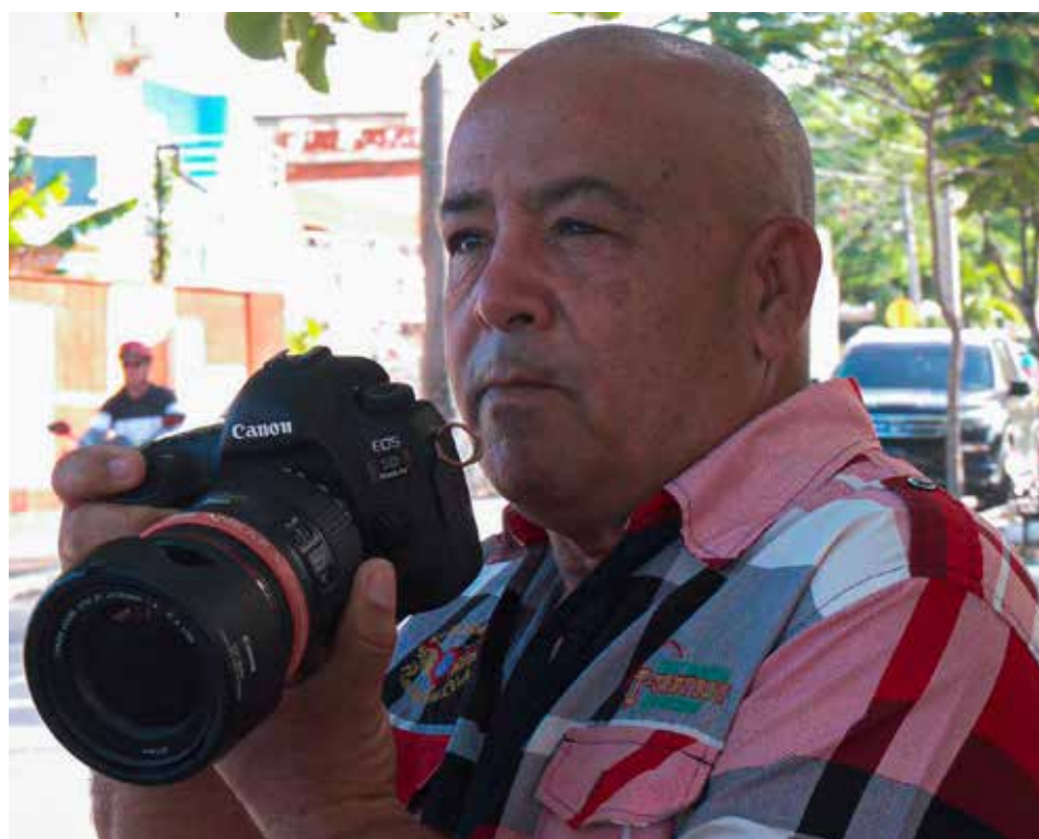
“A donde quiera que vaya, a lo que vaya, llevo mi cámara fotográfica”, afirma.

No ha existido divorcio entre el hombre y el periodista, entre el fotógrafo y el reportero. Para Oscarito, como le llaman más por el afecto que por la estatura, todo parte de una misma razón.