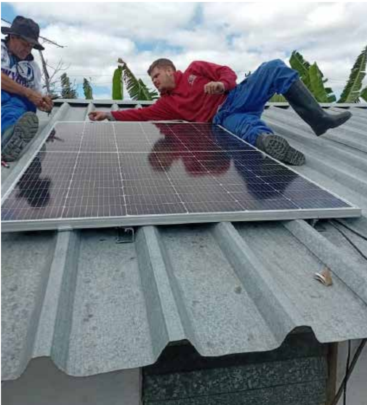
Parte del equipo de montaje en El Guineo, Fomento.