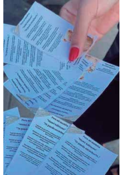
Este es uno de los proyectos de la UNISS con impacto más directo en las comunidades.

Estos resultados han sido promovidos a nivel científico, pues se han convertido en trabajos científicos estudiantiles y proyectos de tesis que, por su relevancia, han sido presentados en importantes eventos como Yayabociencia y Pedagogía.