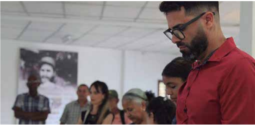
En el acto fueron reconocidos los ganadores del premio por la obra del año.