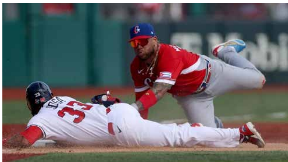
El equipo cubano ganó dos partidos y luego cayó ante Canadá.