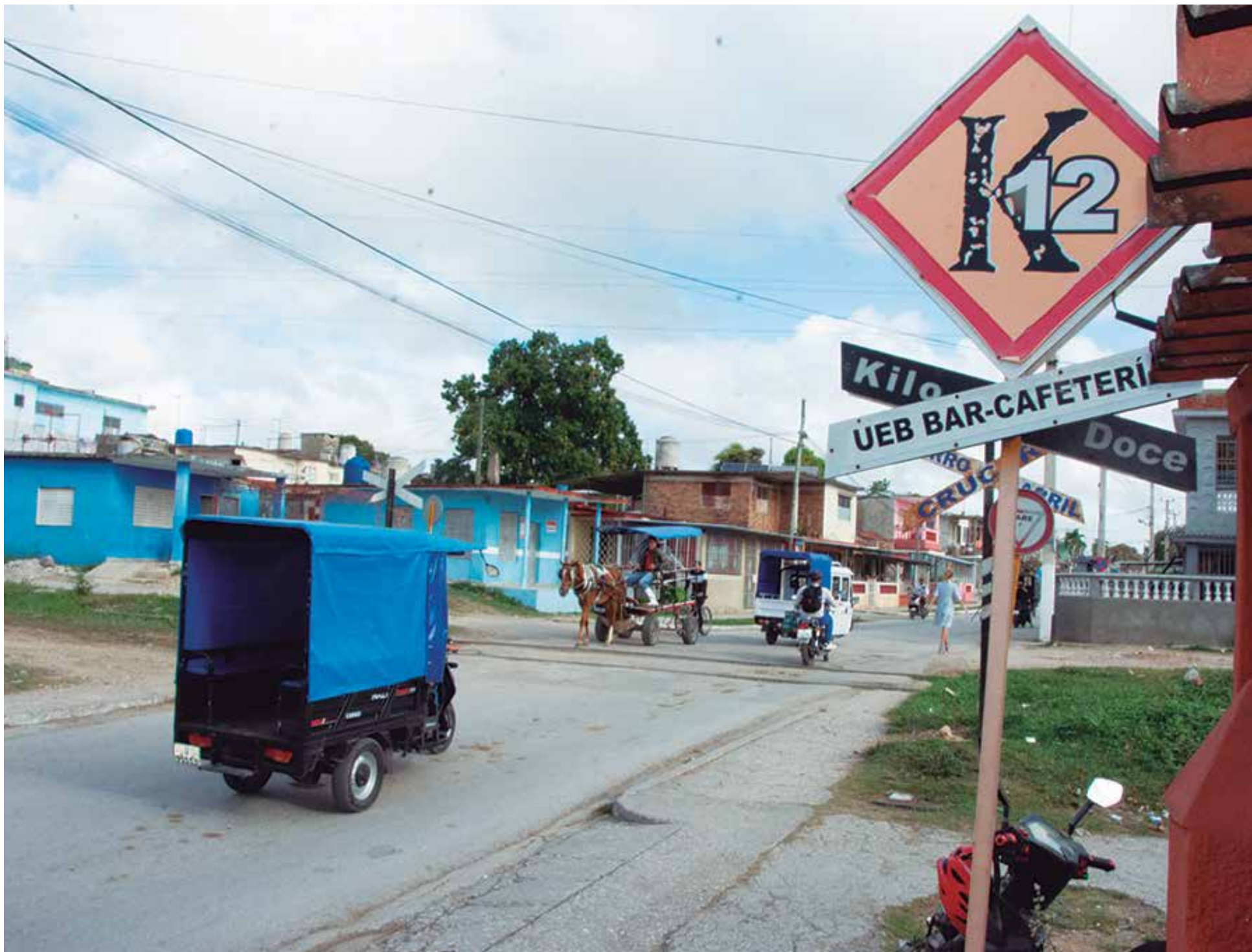
Unas 15 000 personas residen en esa área de la capital provincial.