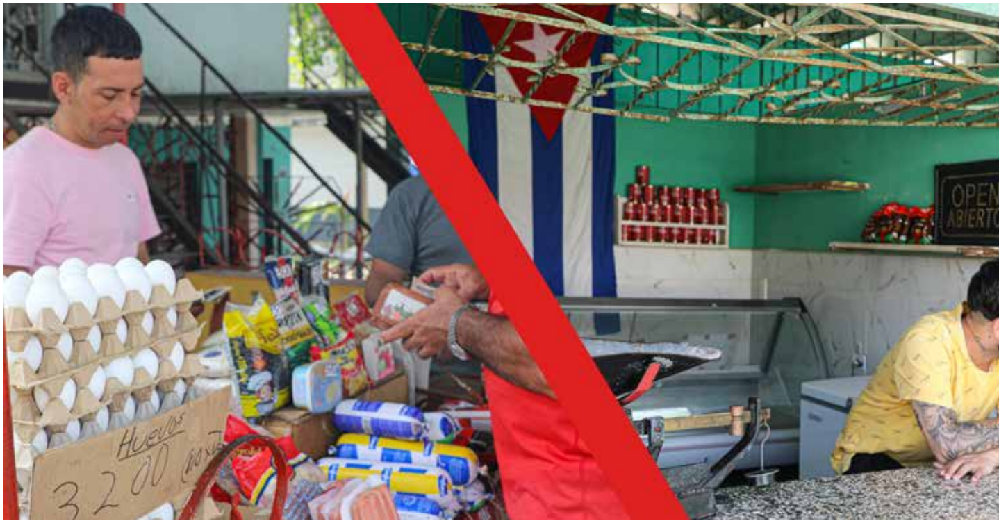
El sector privado, a diferencia del estatal, mantiene la voz cantante en la venta de productos diversos.