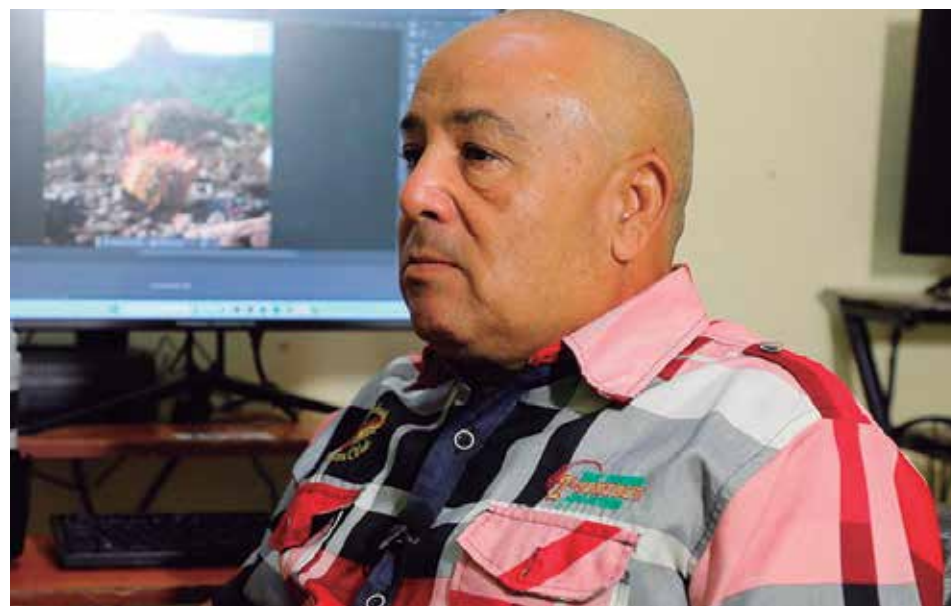
El espíritu aventurero lo acompaña en cada uno de sus proyectos.

“Yo nunca he dejado de escribir. No voy a un lugar solo a hacer fotos, todo lo que me parezca noticia lo escribo.