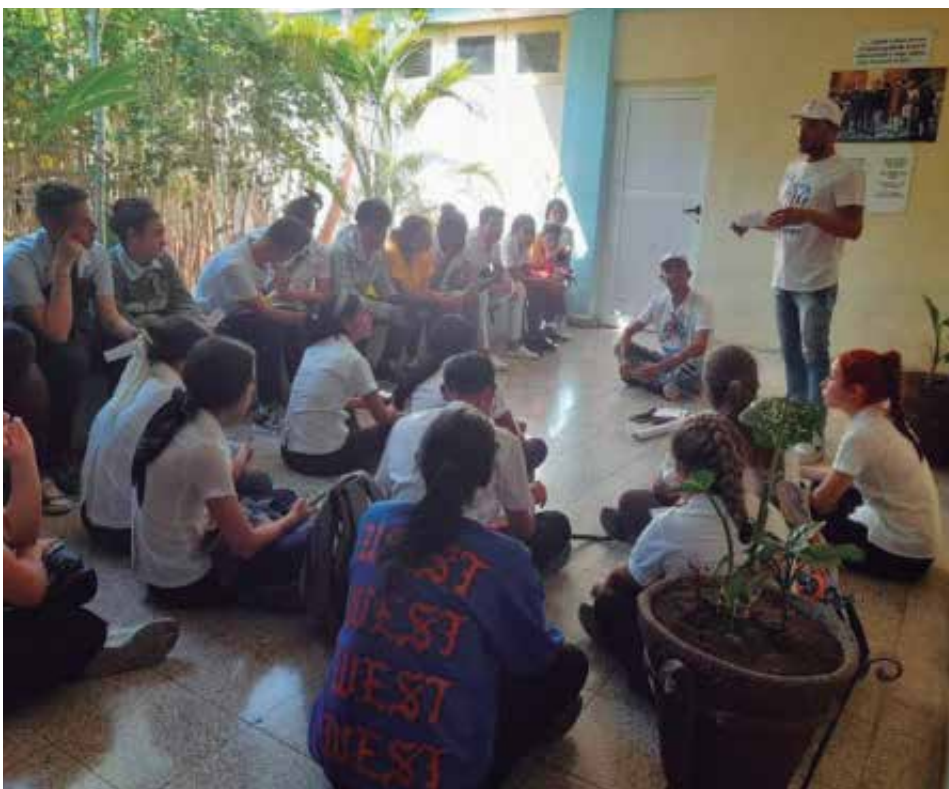
En las instituciones educativas se precisa abordar el tema de las ITS sin tapujos.

**El nombre de la entrevistada ha sido cambiado para respetar su privacidad